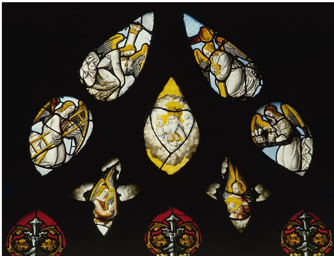
Vue d'ensemble du tympan : Dieu le Père bénissant entouré de quatre anges portant les instruments de la Passion et de deux bustes d'anges musiciens.