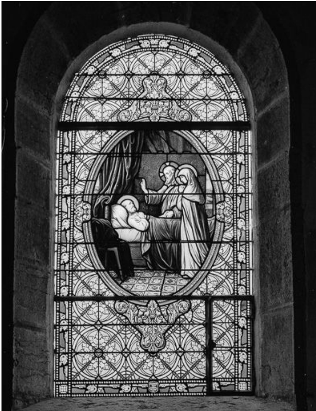
Baie 4 : vue d'ensemble.