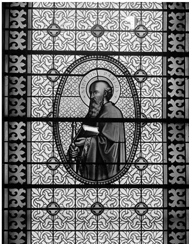
Baie 2 : le médaillon.