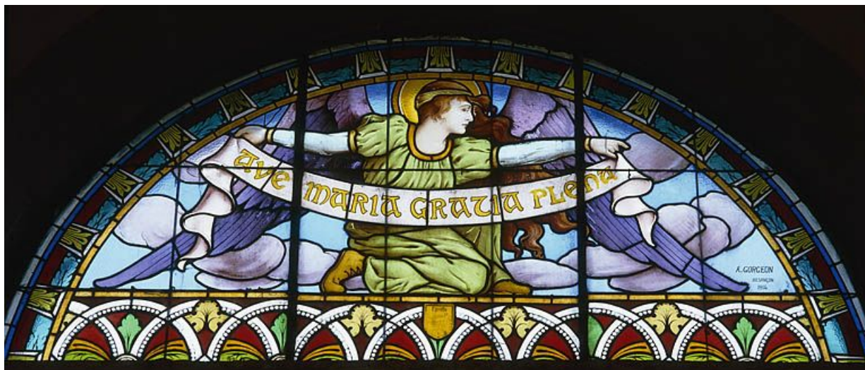
Baie 1 créée par A. Gorgeon en 1914 : grand ange à genoux tenant une banderole avec l'inscription AVE MARIA GRATIA PLENA. 25, Arçon