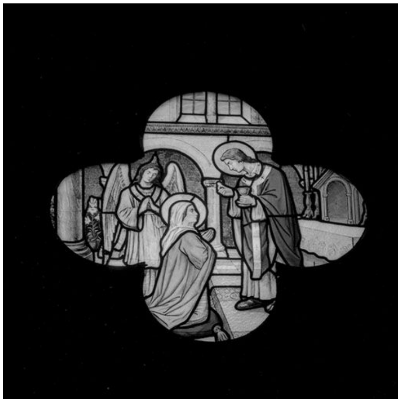
Baie 112 : Communion de la Vierge. 25, Besançon chemin de l' Espérance