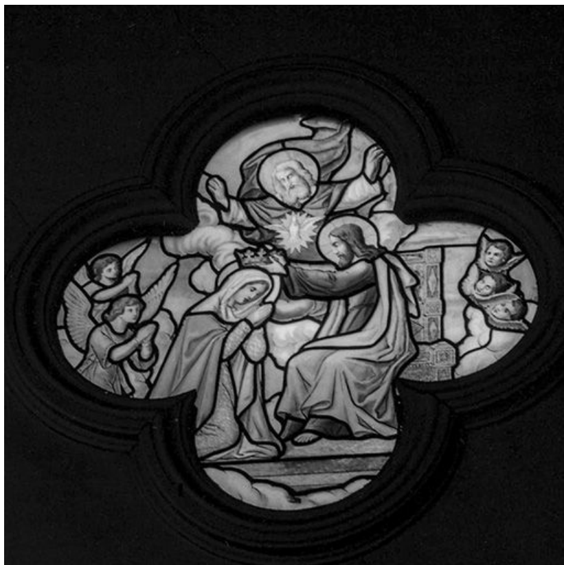
Baie 106 : le Couronnement de la Vierge.