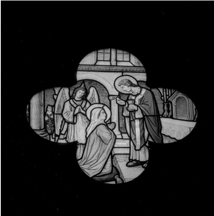
Baie 112 : Communion de la Vierge. 25, Besançon chemin de l' Espérance