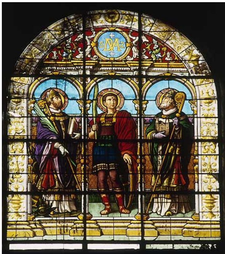
Baie 104 : saint Maurice entre saint Antide et saint Donat.