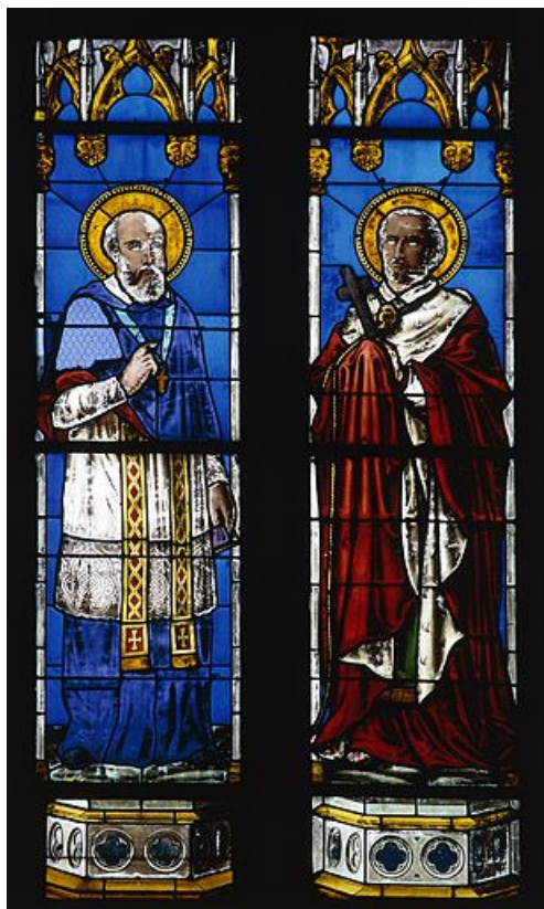
Baie 3 : saint François de Sales et saint François Xavier, écu armorié au tympan, inscription 1881, inscription effacée LAUDET ET FINCK (?) : les deux saints.