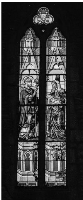
Baie 2 : saint Claude évêque bénissant une femme et son enfant, armoiries au tympan. 25, Besançon rue Jean Wyrsh