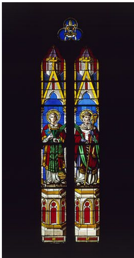
Baie 1 : saint Ferréol et saint Ferjeux (?) ; armoiries surmontées de la tiare papale au tympan. 25, Besançon rue Jean Wyrsh