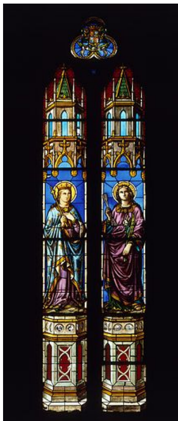
Baie 4 : deux saintes non identifiées et un écu armorié au tympan.