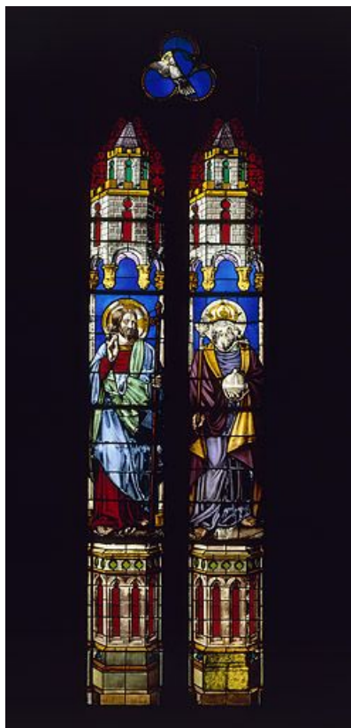
Baie 0 : le Christ et Dieu le Père, Saint Esprit au tympan.