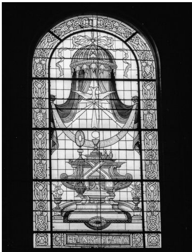
Baie 104 : le sacerdoce.