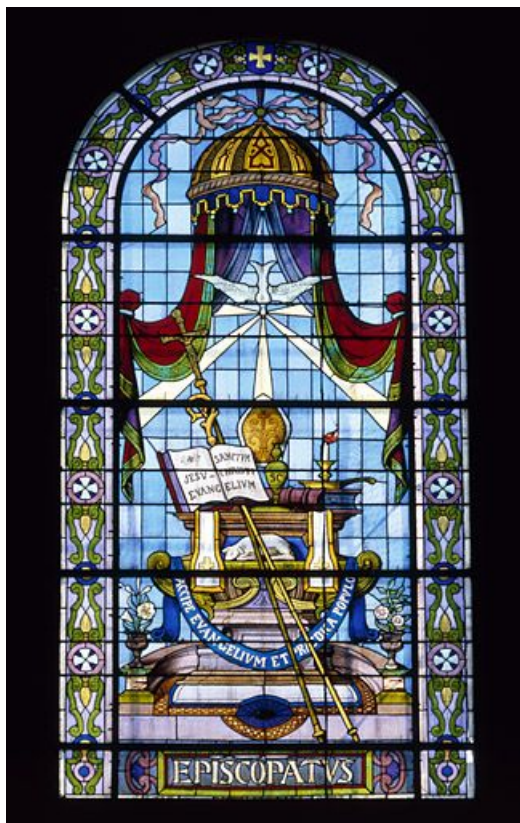
Baie 103 : l'épiscopat.