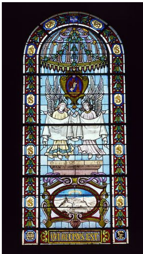
Baie 102 : vue d'ensemble.