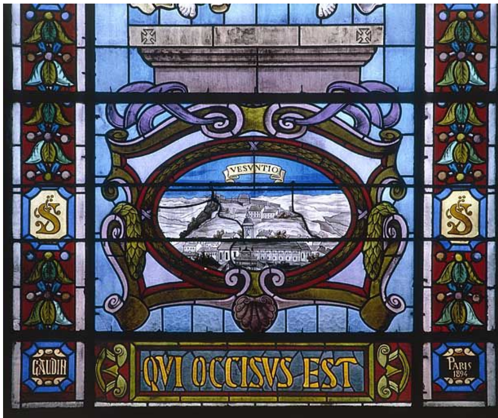
Baie 102 : registre inférieur.