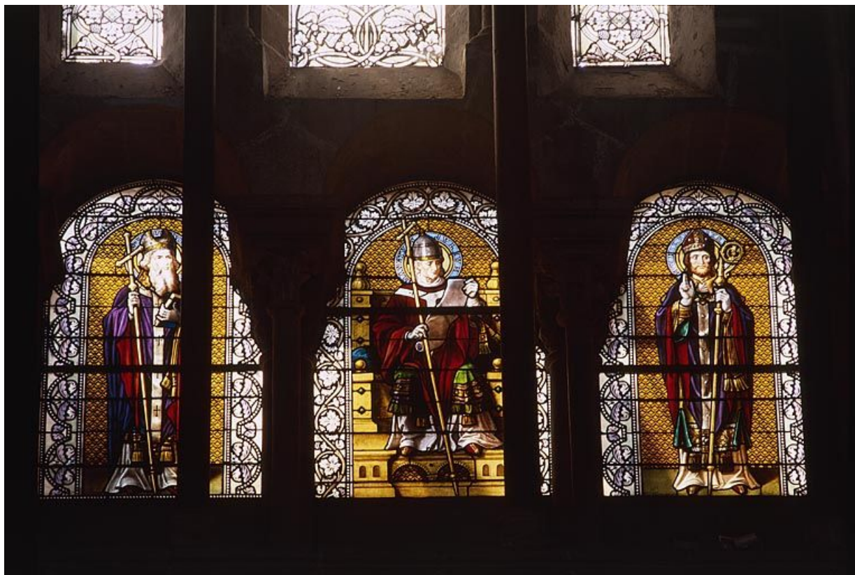
Baie 207 : le Pape Jules entre Basile le Grand et saint Hilaire.