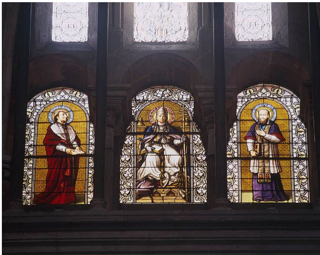
Baie 214 : le Pape Pie V entre saint Charles Borromée et saint François de Sales. 25, Besançon rue de la Convention