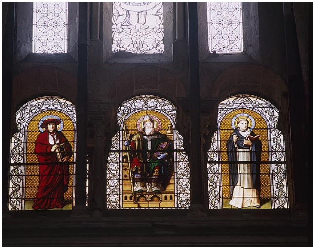
Baie 212 : le Pape Innocent IV entre saint Bonaventure et saint Thomas d'Aquin. 25, Besançon rue de la Convention