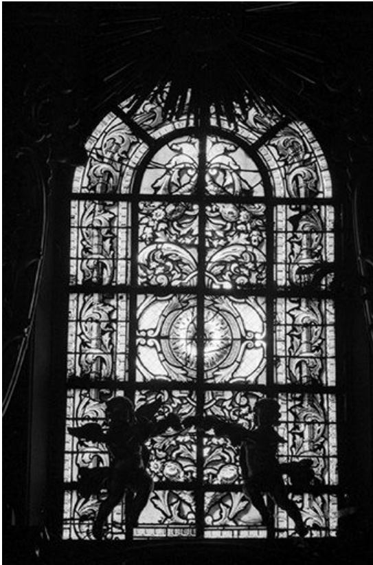
Baie 121 : vue d'ensemble.