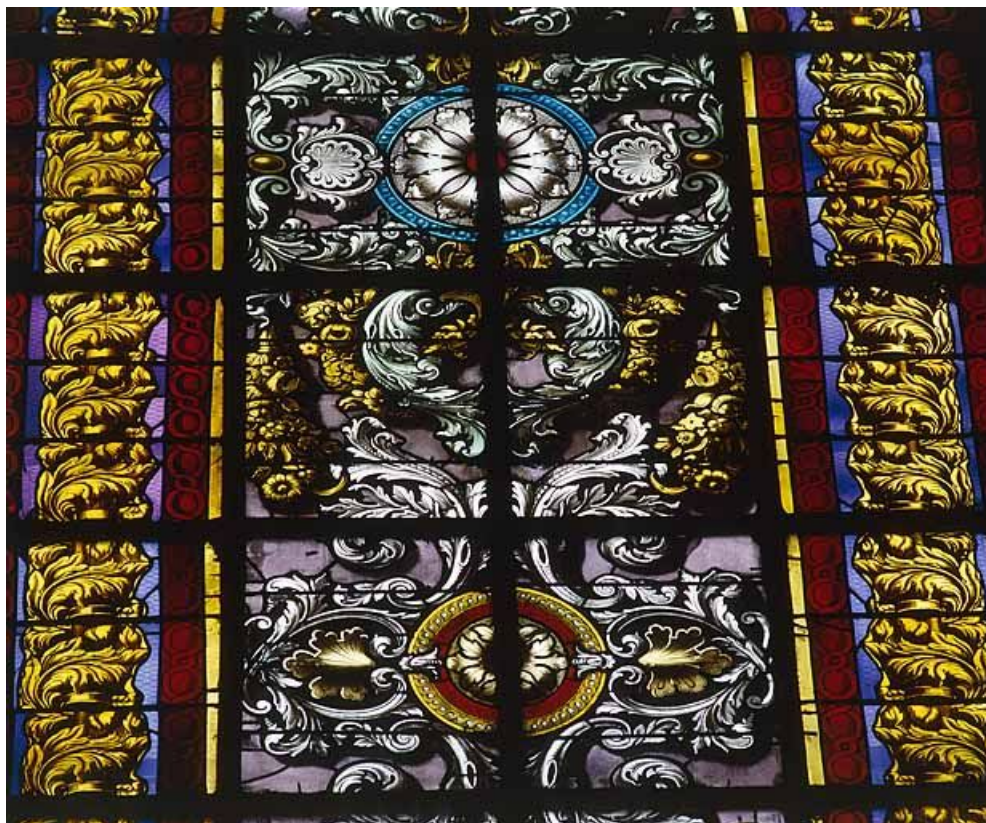
Baie 126 : détail.