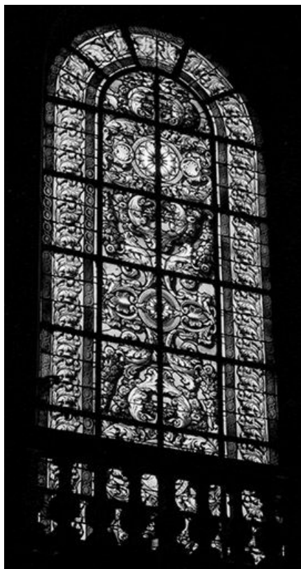
Baie 126 : vue d'ensemble.