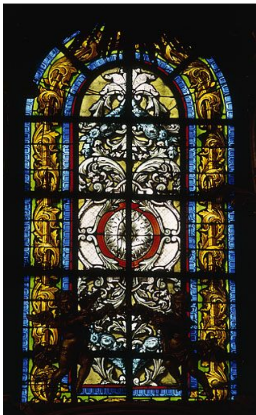
Baie 121 : détail.