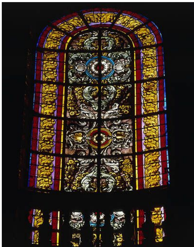
Baie 126 : vue d'ensemble..