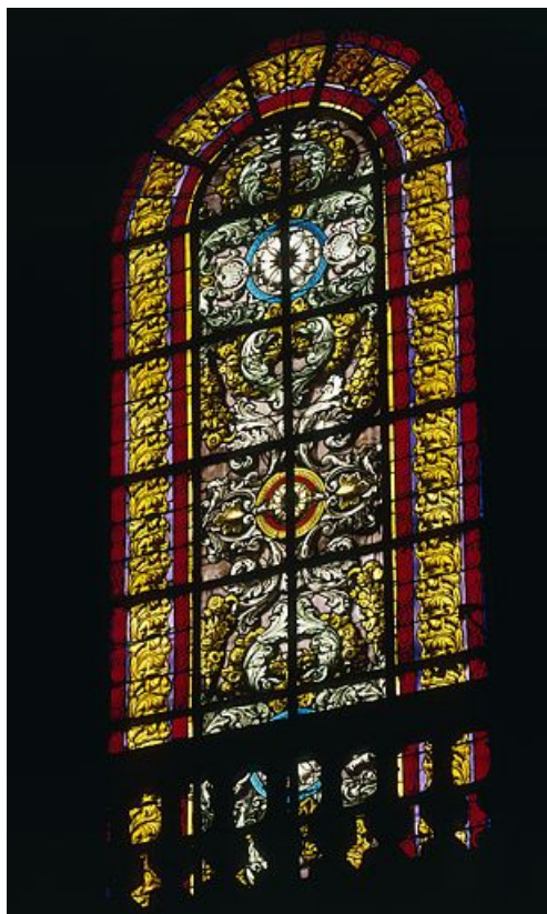
Baie 125 : vue d'ensemble.