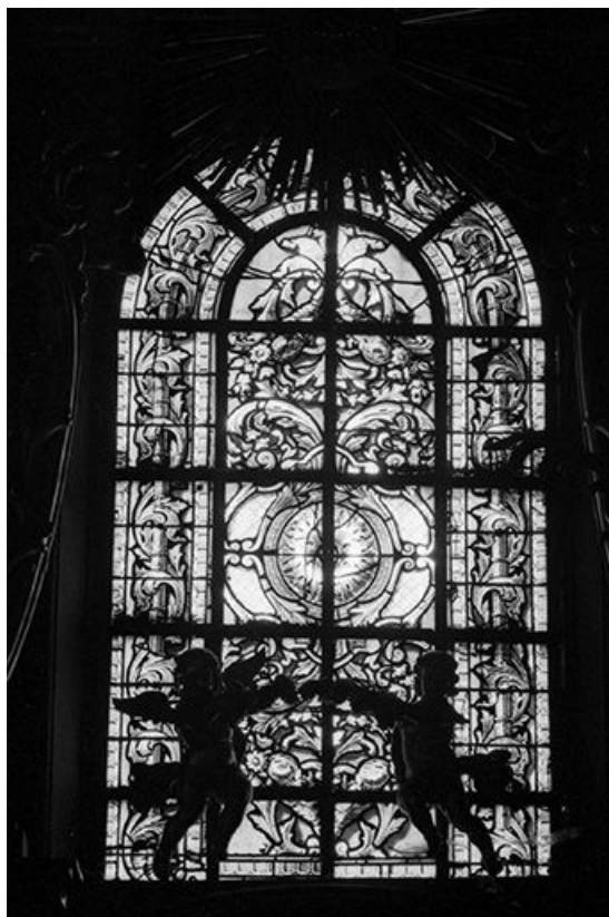
Baie 121 : vue d'ensemble.