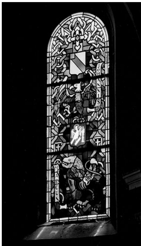
Baie 17 : vue d'ensemble.