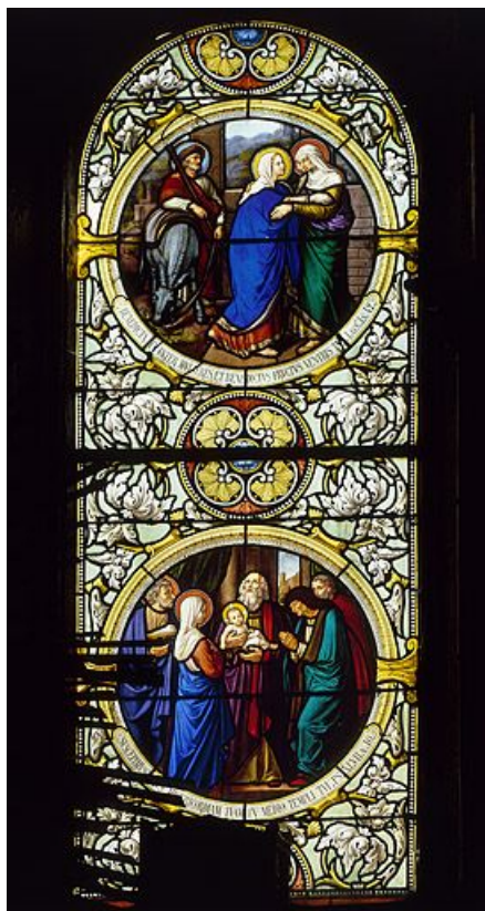
Baie 23 : la Présentation au Temple et la Visitation.