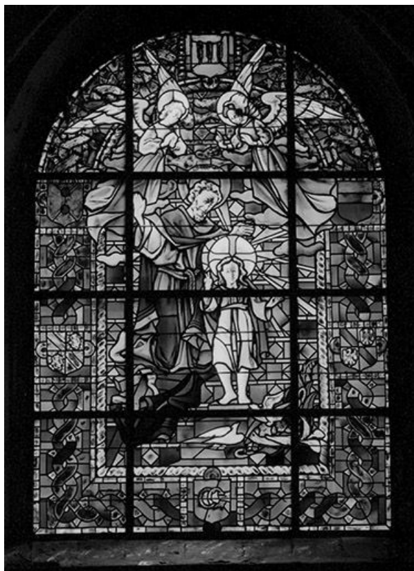
Baie 27 : saint Joseph et l'Enfant Jésus adorés par deux anges, bordure d'entrelacs et d'écus armoriés. 25, Besançon rue de la Convention