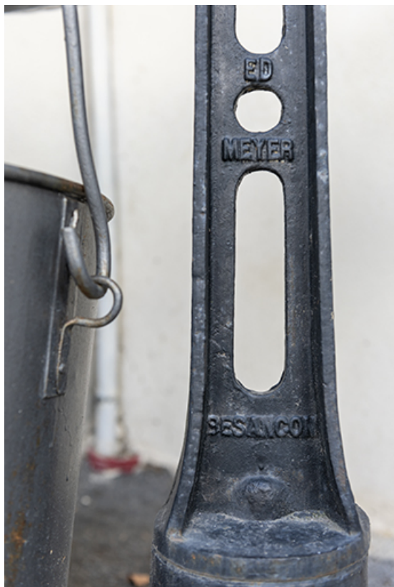
Nom du constructeur (Ed. Meyer) et lieu de fabrication (Besançon). 25, Valoreille, 2 rue de l' Eglise