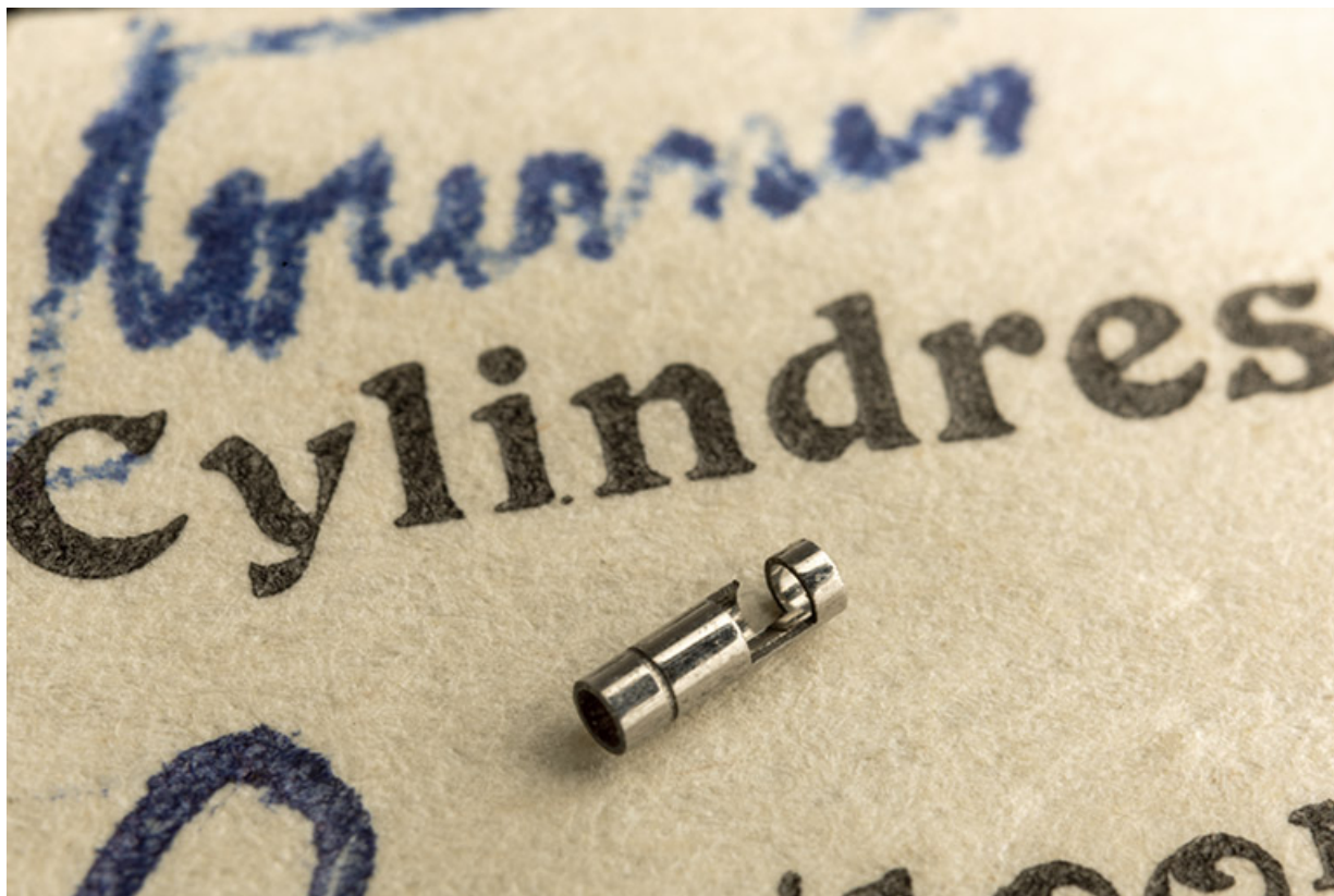
Ecorce de cylindre achevée et polie.

25, Le Russey, 64 avenue de Lattre de Tassigny