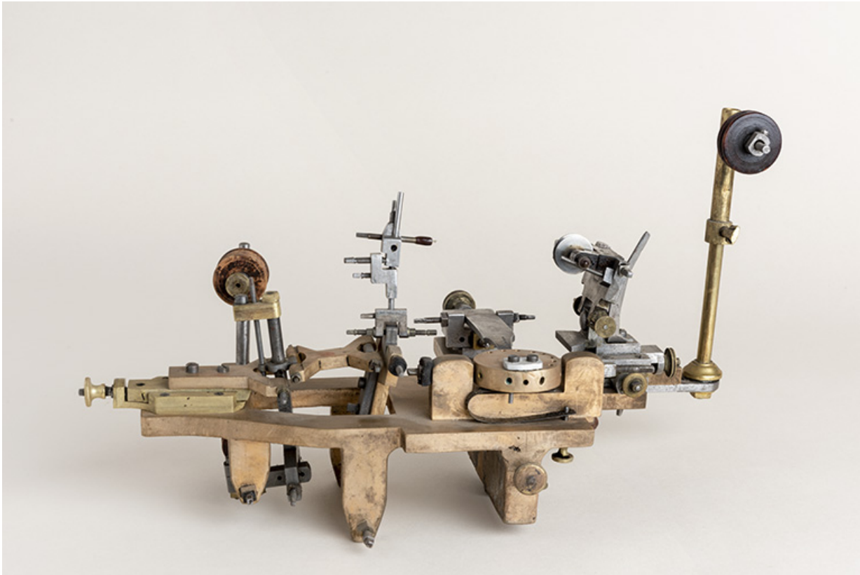
Vue de face, côté tasseau. Lime (au centre) et meule (à droite) sont levées.

25, Le Russey, 64 avenue de Lattre de Tassigny