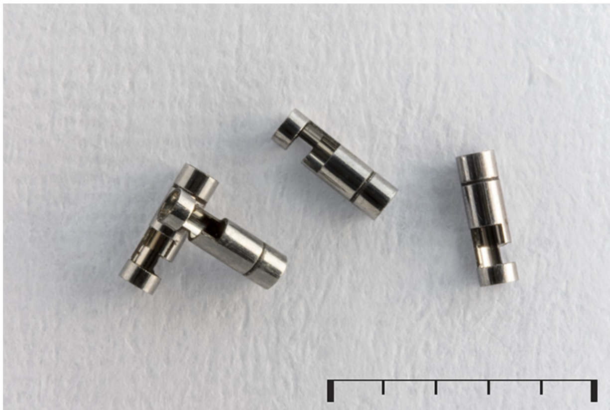
Ecorces de cylindre achevées et polies.

25, Le Russey, 64 avenue de Lattre de Tassigny