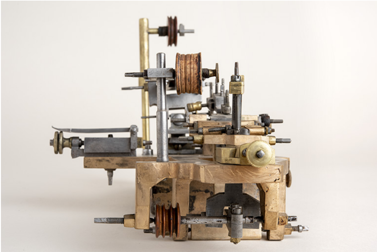
Vue de l'extrémité côté lime.

25, Le Russey, 64 avenue de Lattre de Tassigny