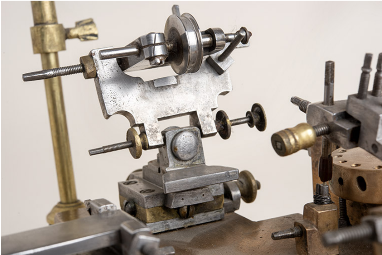
Support de la meule en saphir (à droite), avec sa poulie motrice.

25, Le Russey, 64 avenue de Lattre de Tassigny