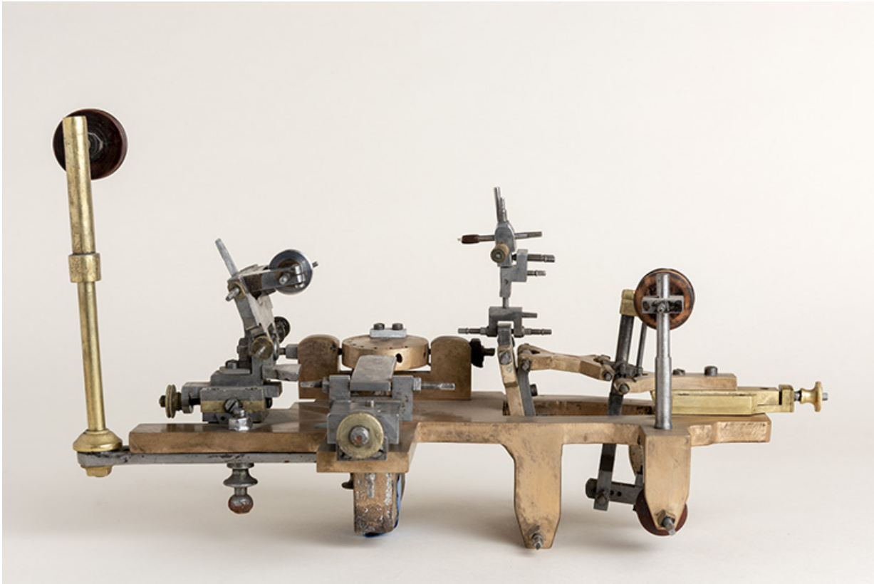
Machine à meuler et à limer (machine à passer les levées) de Léon Girardin, au Russey.

25, Le Russey, 64 avenue de Lattre de Tassigny