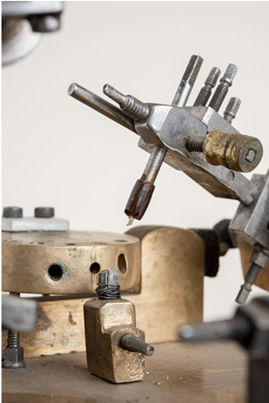
Tasseau (à gauche) et lime sur son support.

25, Le Russey, 64 avenue de Lattre de Tassigny