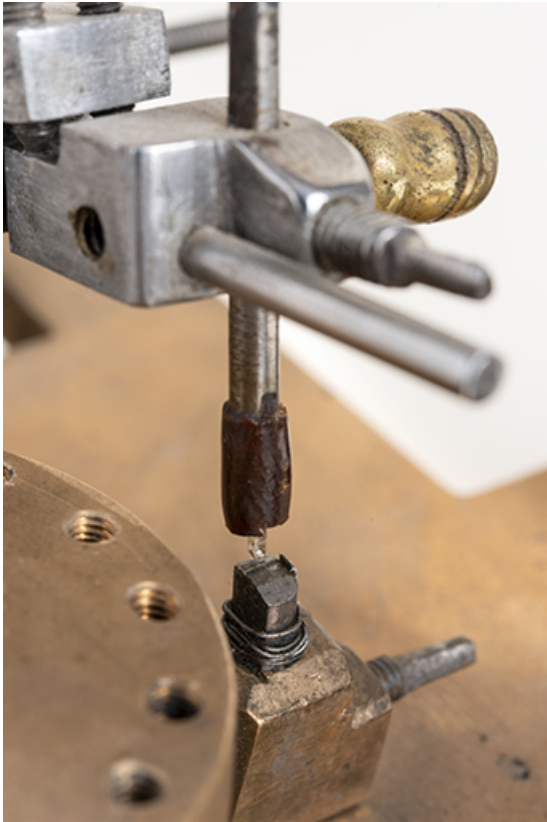
Lime en position baissée.

25, Le Russey, 64 avenue de Lattre de Tassigny