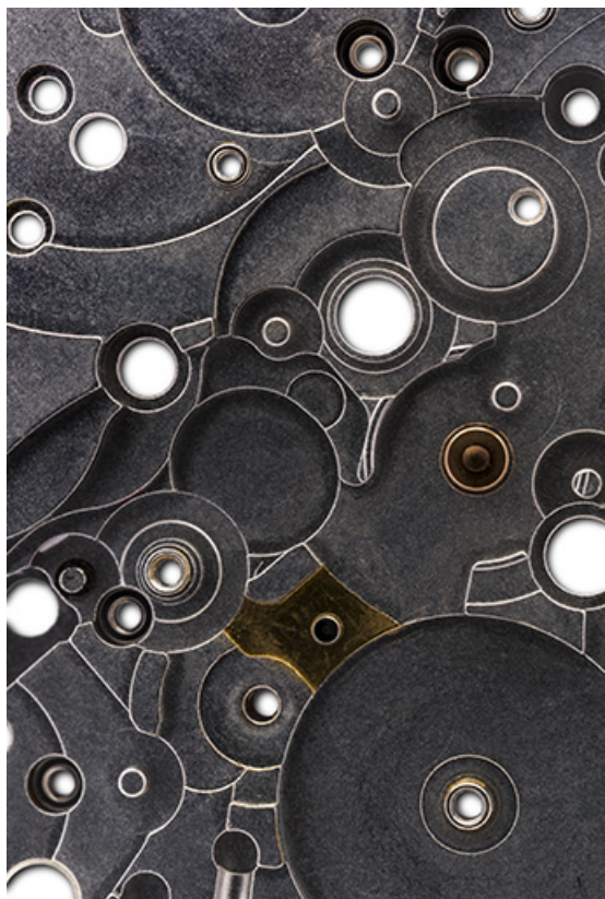
Platine, face côté cadran : détail.