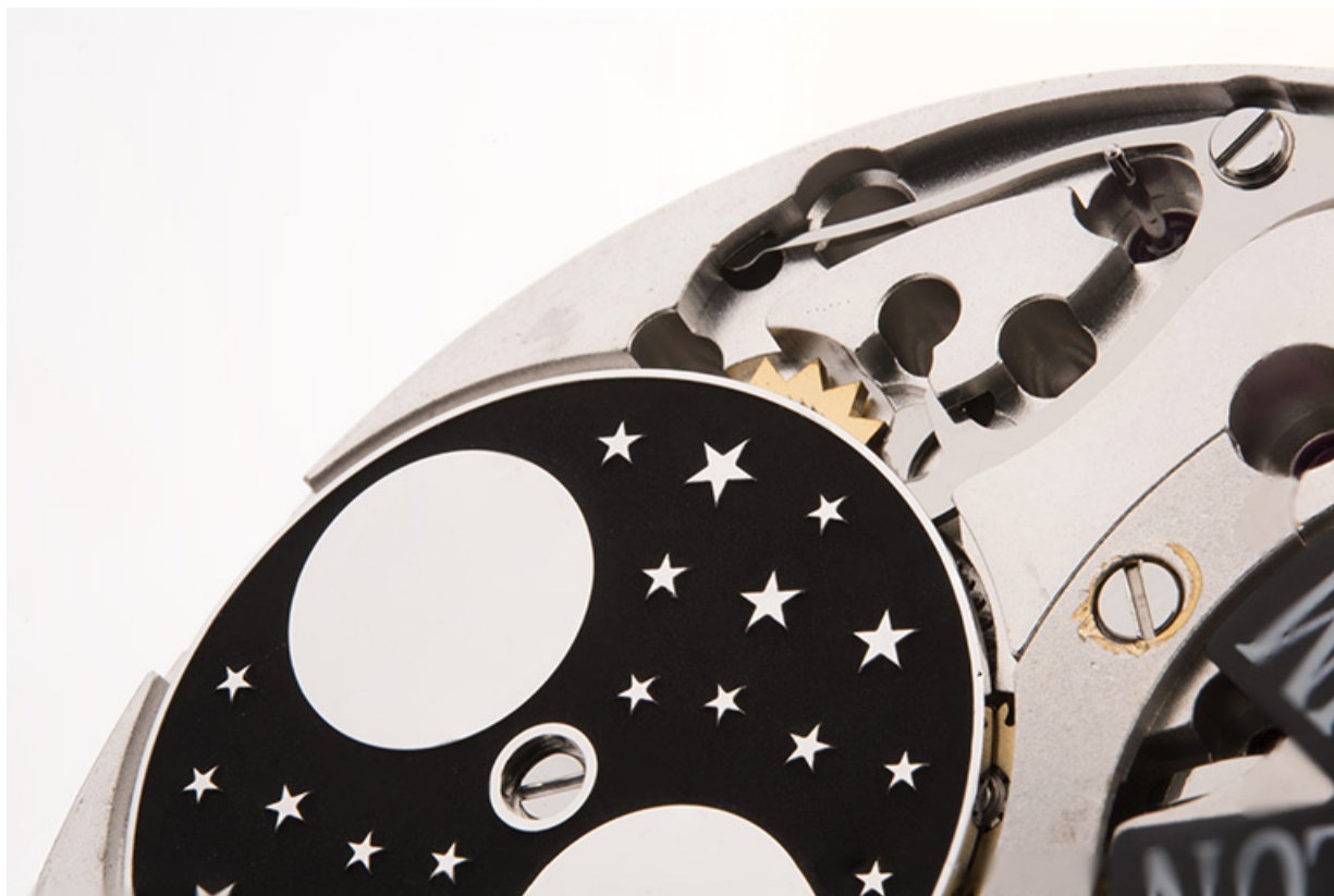
Face côté cadran : détail du disque des phases de lune.