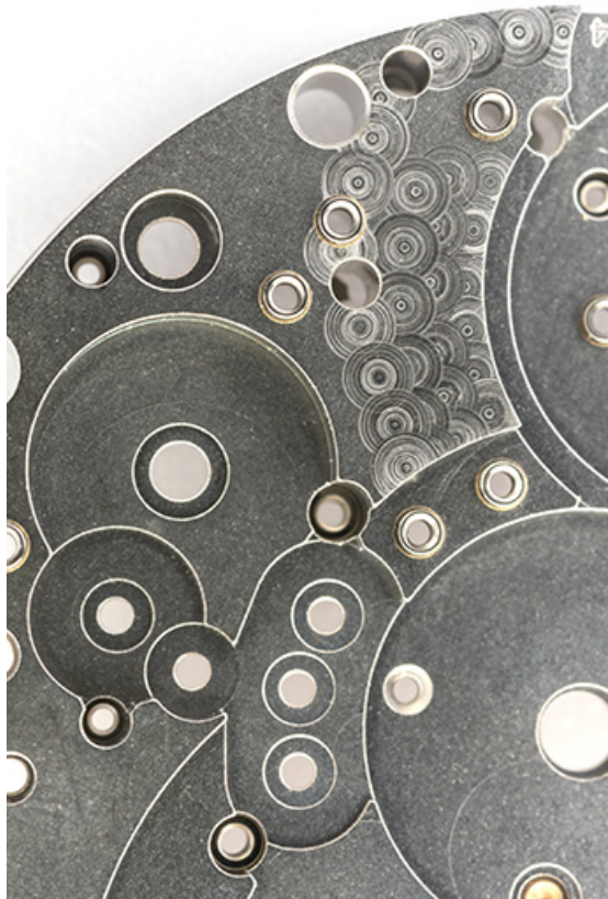
Platine, face côté fond : détail.