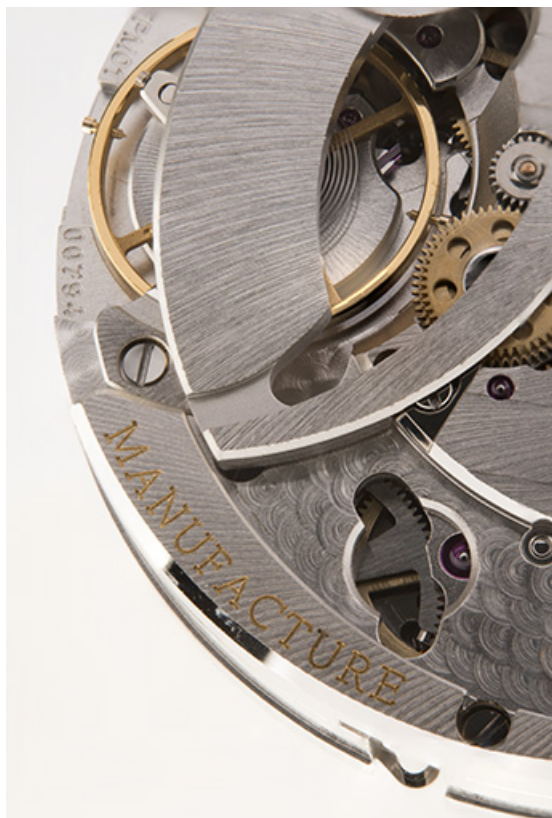
Face côté fond : détail du balancier-spiral et inscription.