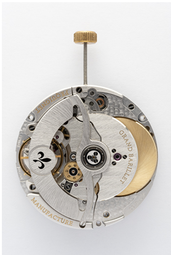
Calibre Royal, côté fond. 25, Morteau, 1 rue du Bief