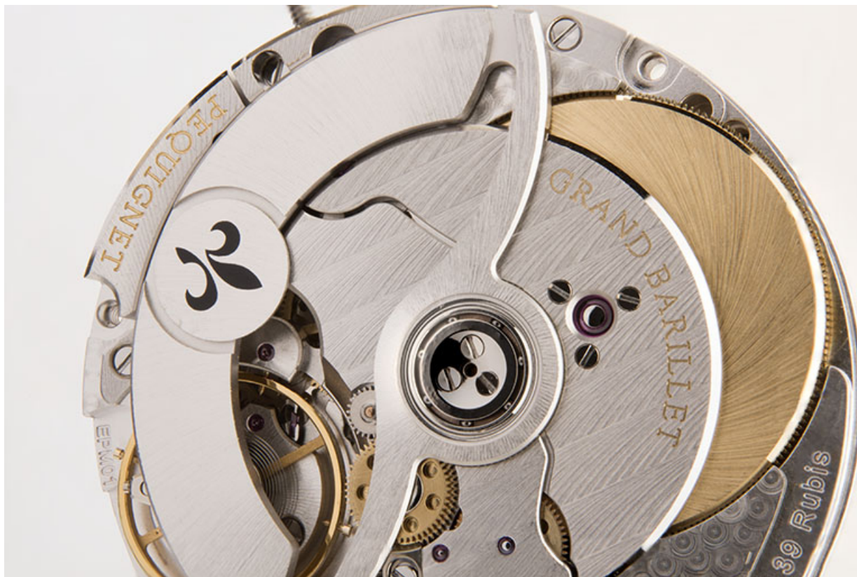
Face côté fond : partie centrale.