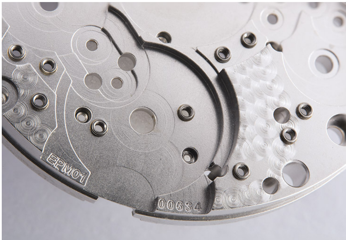
Platine, face côté fond : emplacement destiné au balancier-spiral.