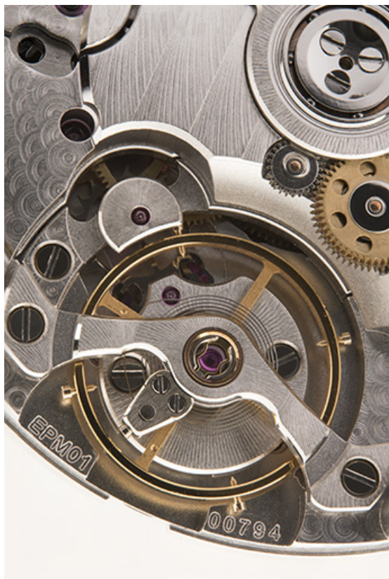
Face côté fond : balancier-spiral (vue rapprochée). 25, Morteau, 1 rue du Bief