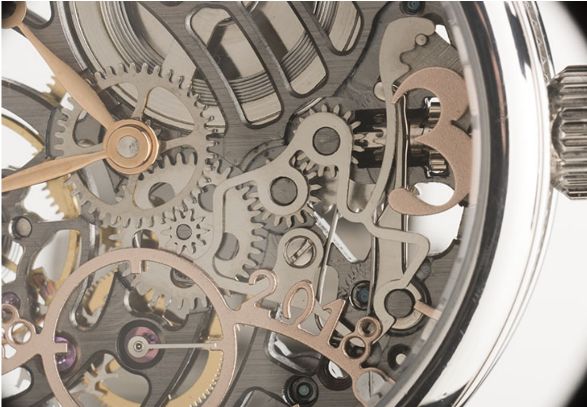
Cadran : cadran des secondes et tirette.