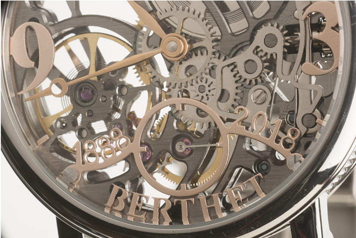
Cadran : inscriptions et cadran des secondes.