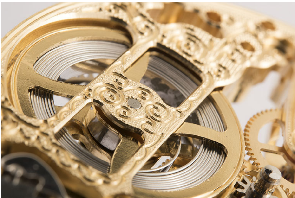
Détail : pont guilloché et ressort moteur.