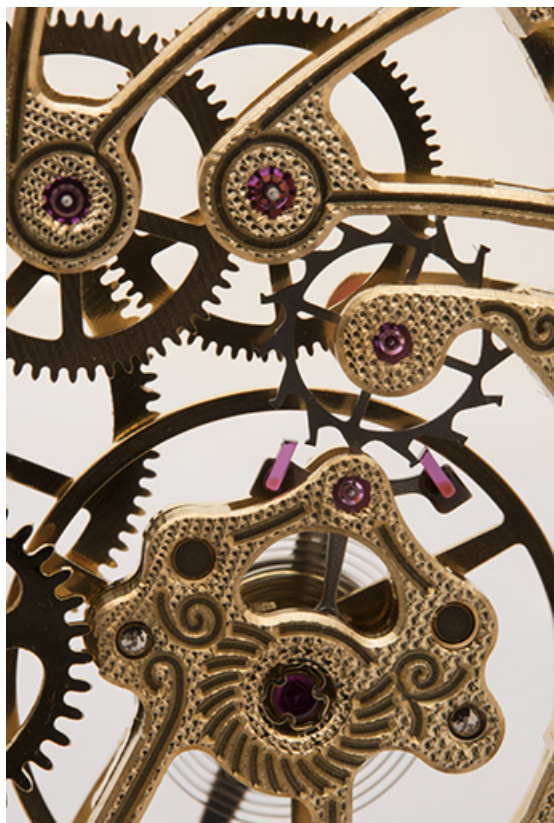
Détail : échappement à ancre (avec le coq au premier plan). 25, Villers-le-Lac, 4 place Saint-Jean