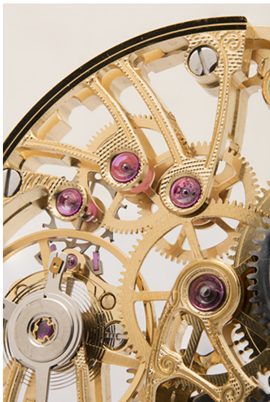
Détail : rubis et amortisseur de choc (à gauche). 25, Villers-le-Lac, 4 place Saint-Jean