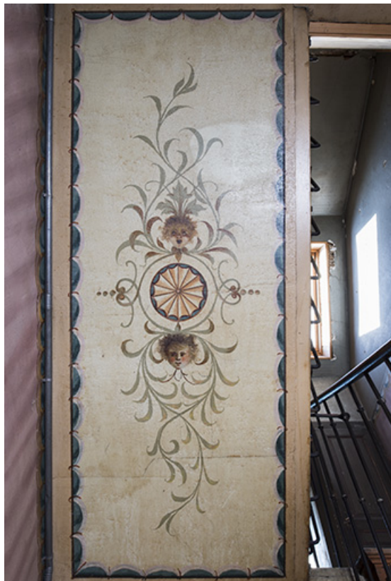
Plafond de la 5e volée.