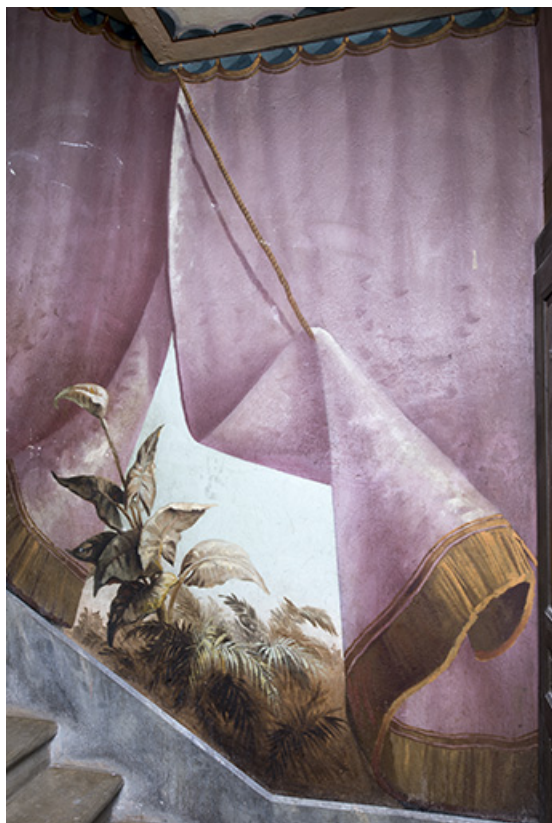
Repos entre le 1er et le 2e palier (à gauche) : plante grasse (arum ?). 25, Morteau, 8 rue Gonsalve Pertusier