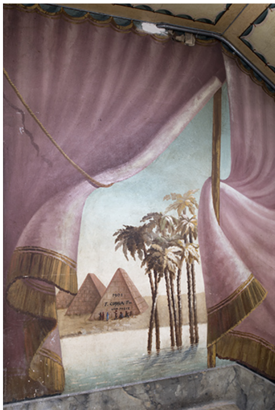
3e palier (à droite) : pyramides et palmiers.