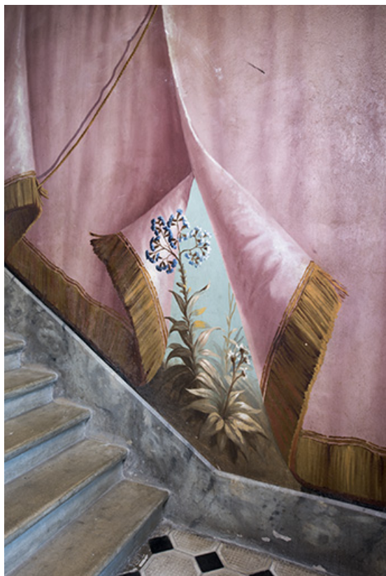
Repos entre le 2e et le 3e palier (à gauche) : fleurs bleues. 25, Morteau, 8 rue Gonsalve Pertusier