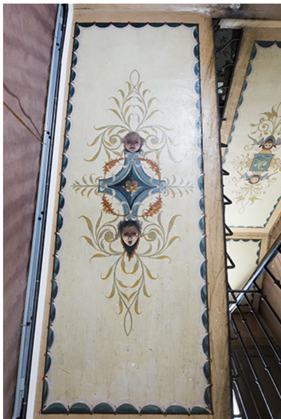
Plafond de la 1ère volée.