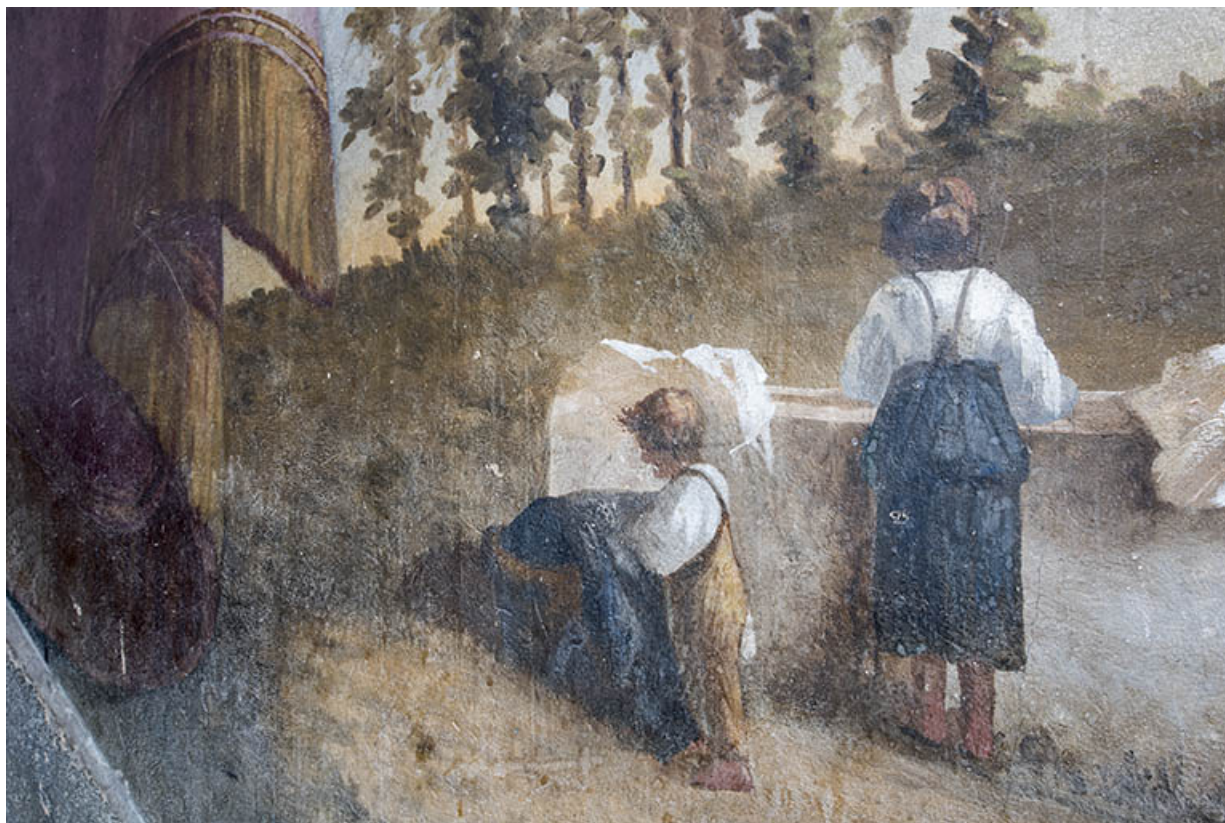
Départ de la 1ère volée (à droite) : femme et enfants au lavoir (détail). 25, Morteau, 8 rue Gonsalve Pertusier