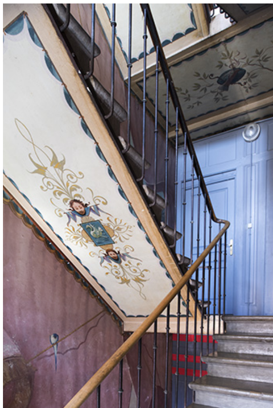
Cage d'escalier depuis la 3e volée (à gauche, plafond de la 2e volée). 25, Morteau, 8 rue Gonsalve Pertusier