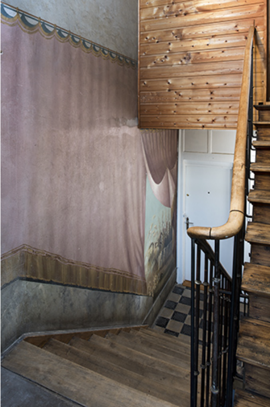
Cage d'escalier depuis le repos entre le 3e et le 4e palier (6e volée). 25, Morteau, 8 rue Gonsalve Pertusier