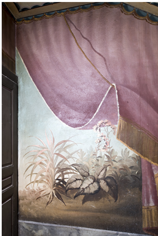
Repos entre le 2e et le 3e palier (à droite) : végétation avec fleurs (détail). 25, Morteau, 8 rue Gonsalve Pertusier