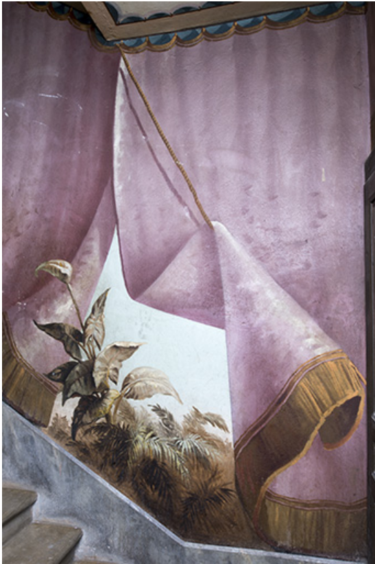
Repos entre le 1er et le 2e palier (à gauche) : plante grasse (arum ?). 25, Morteau, 8 rue Gonsalve Pertusier