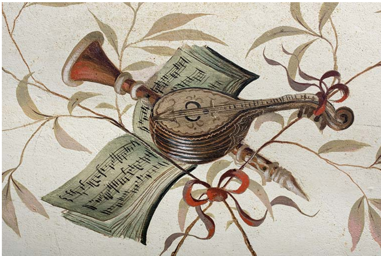
Plafond du repos entre le 2 e et le 3 e palier : trophée de musique (détail).