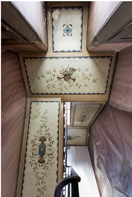
Plafond depuis le repos entre le 2e et le 3e palier (4e volée à gauche, 5e à droite). 25, Morteau, 8 rue Gonsalve Pertusier