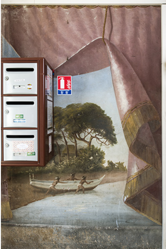
Départ de la 1ère volée (à gauche) : pêcheurs et leur barque. 25, Morteau, 8 rue Gonsalve Pertusier