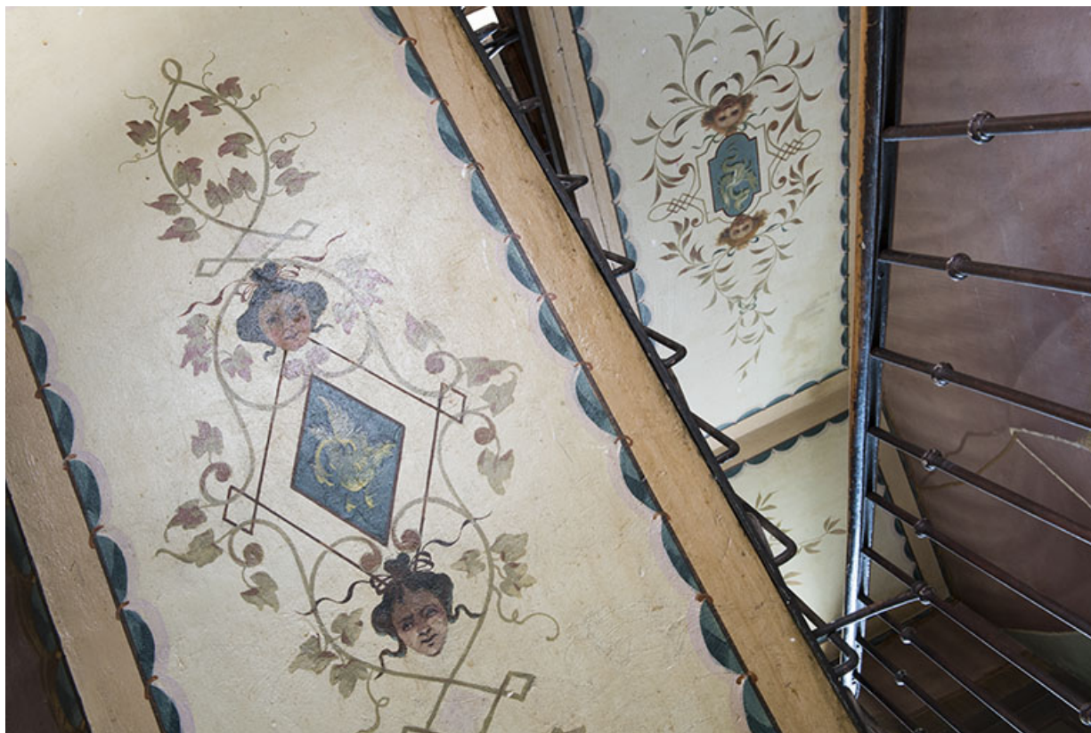
Plafond des 3e (gauche) et 4e (droite) volées. 25, Morteau, 8 rue Gonsalve Pertusier