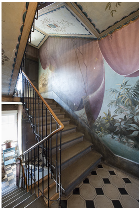
Cage d'escalier depuis le 2e palier (à droite, la 4e volée). 25, Morteau, 8 rue Gonsalve Pertusier