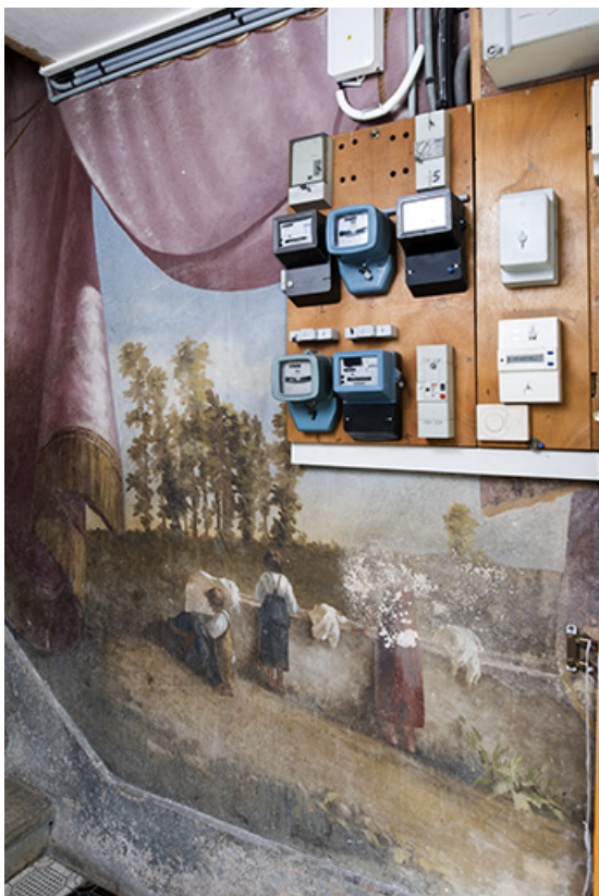
Départ de la 1ère volée (à droite) : femme et enfants au lavoir. 25, Morteau, 8 rue Gonsalve Pertusier