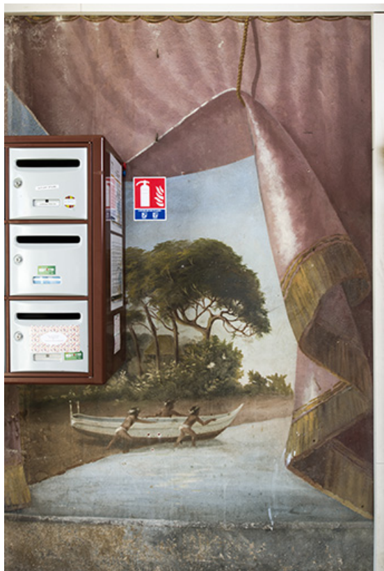
Départ de la 1ère volée (à gauche) : pêcheurs et leur barque. 25, Morteau, 8 rue Gonsalve Pertusier