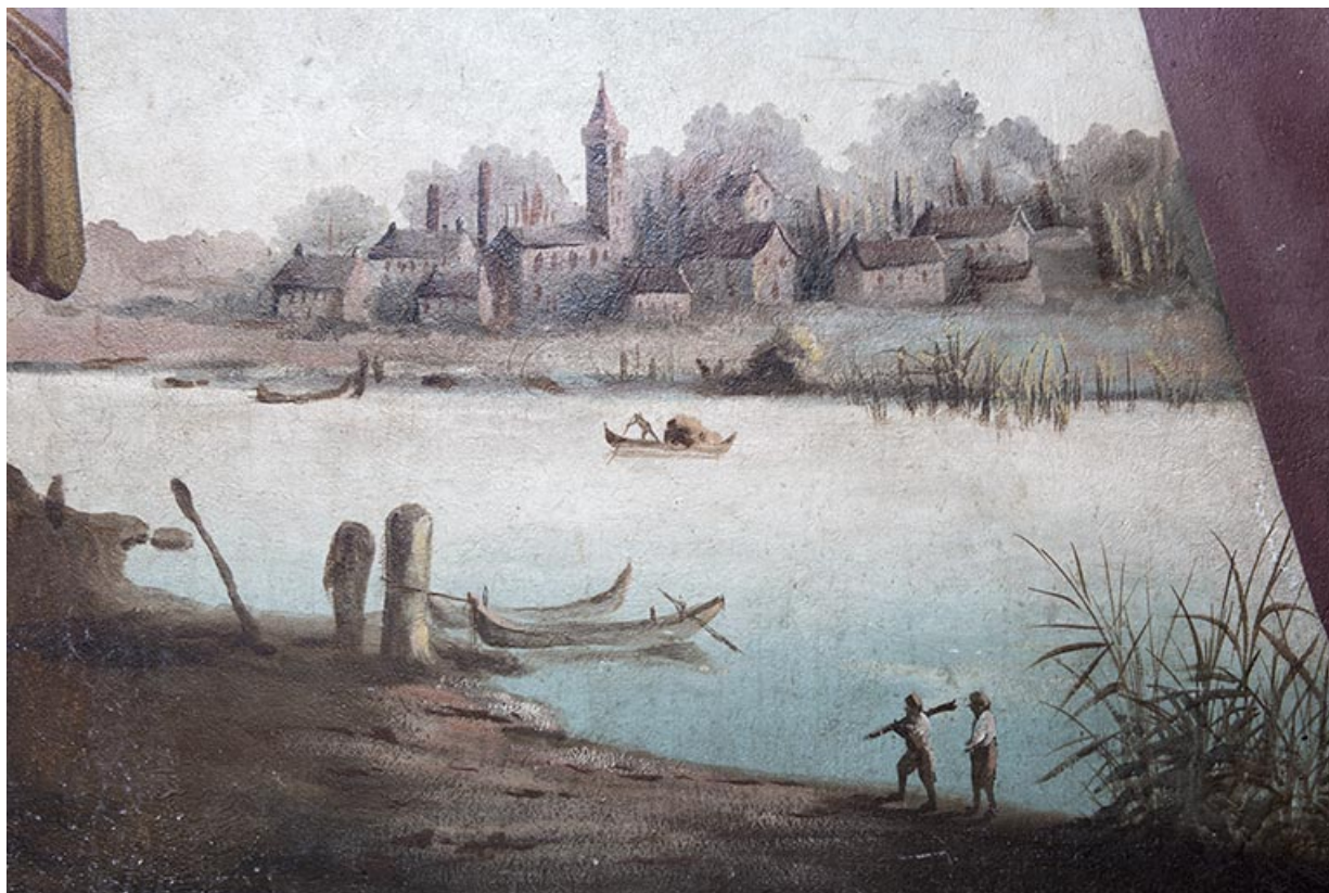
2e palier (à droite) : ville et rivière (détail). 25, Morteau, 8 rue Gonsalve Pertusier