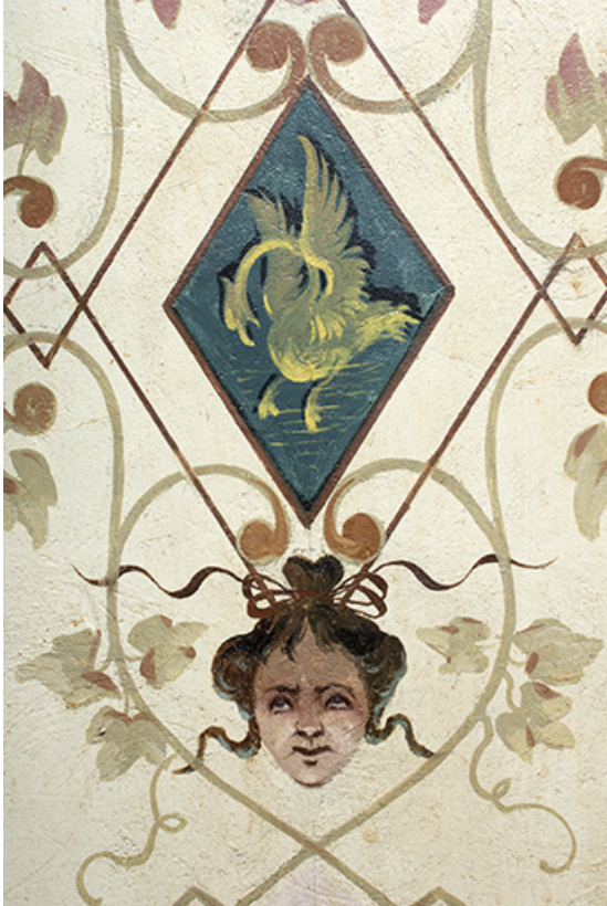
Décor du plafond de la 3e volée : détail du motif central et d'une tête. 25, Morteau, 8 rue Gonsalve Pertusier