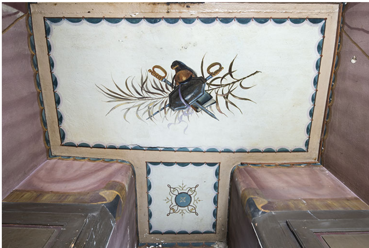
Plafond du repos entre le 1er et le 2e palier : trophée d'armes.