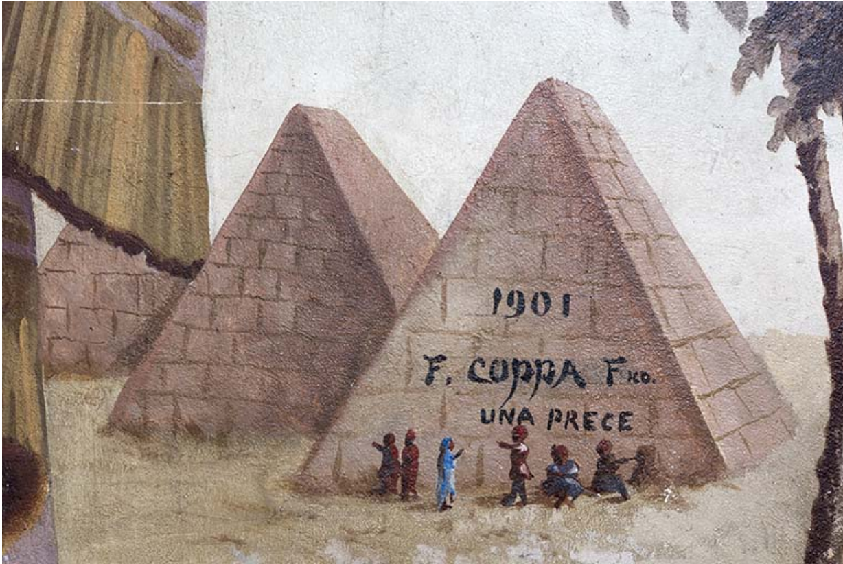
3e palier (à droite) : pyramides (avec détail de la signature et de la date). 25, Morteau, 8 rue Gonsalve Pertusier