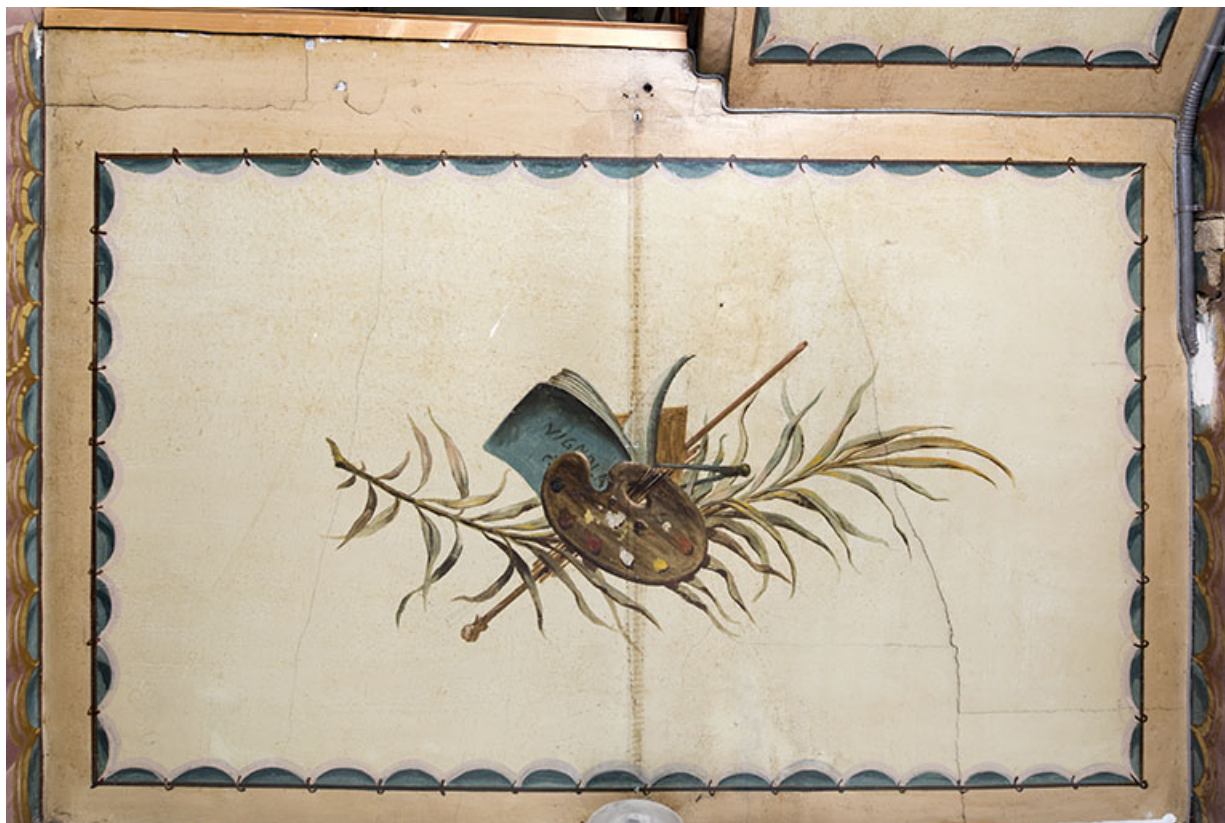
Plafond du 3e palier : trophée des arts (avec évocation de Vignole). 25, Morteau, 8 rue Gonsalve Pertusier