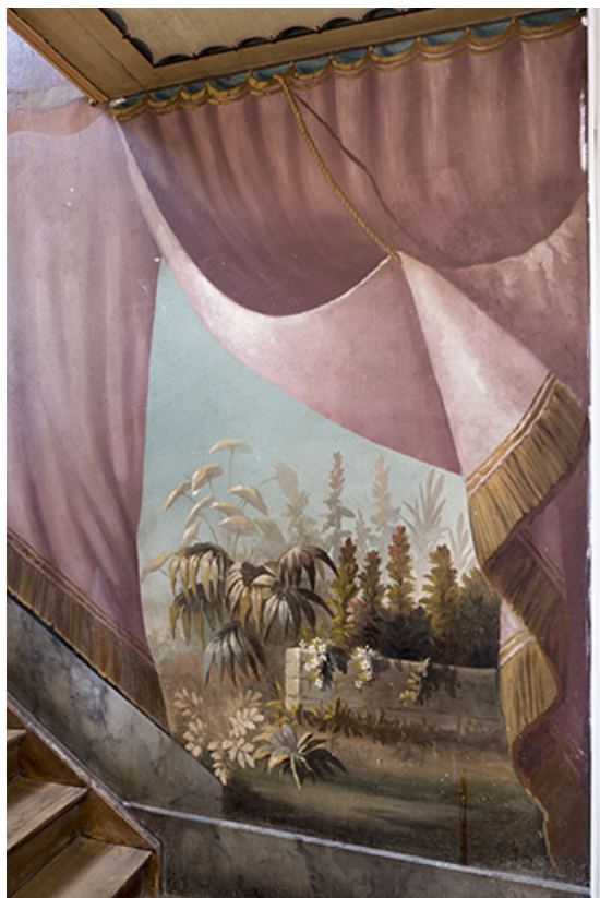
3e palier (à gauche) : mur et végétation.