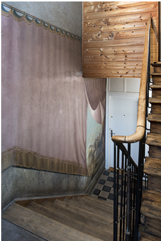
Cage d'escalier depuis le repos entre le 3e et le 4e palier (6e volée). 25, Morteau, 8 rue Gonsalve Pertusier