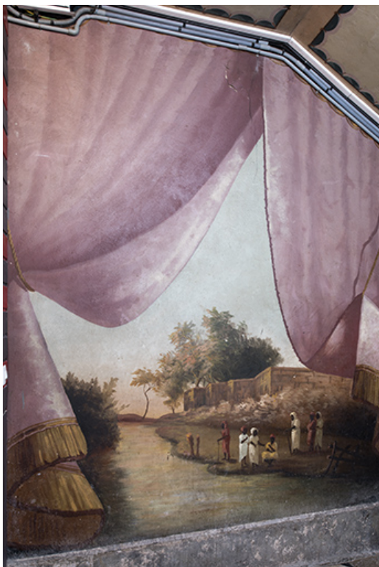
1er palier (à droite) : personnages entre rivière et murailles, en Afrique. 25, Morteau, 8 rue Gonsalve Pertusier