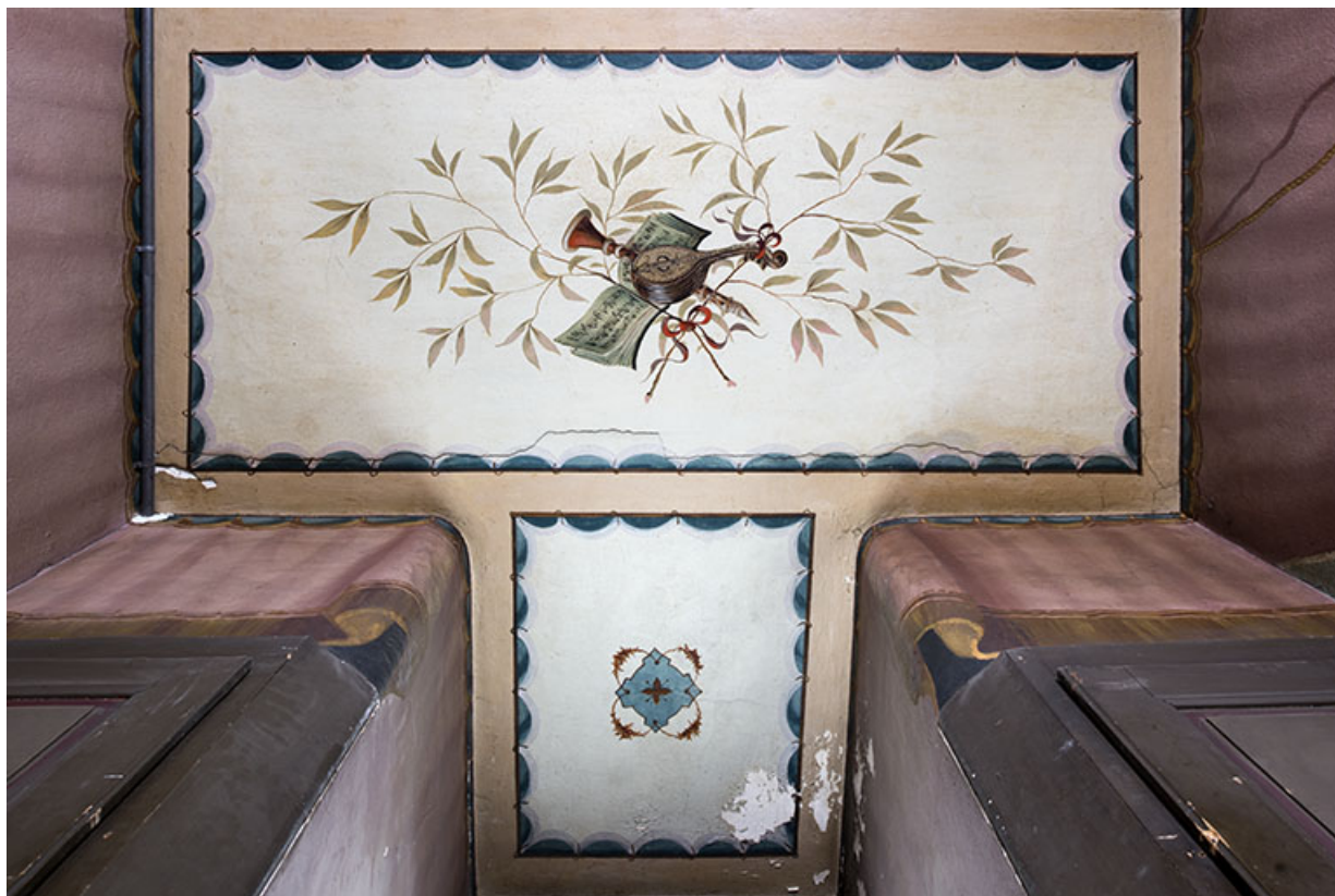
Plafond du repos entre le 2e et le 3e palier : trophée de musique.