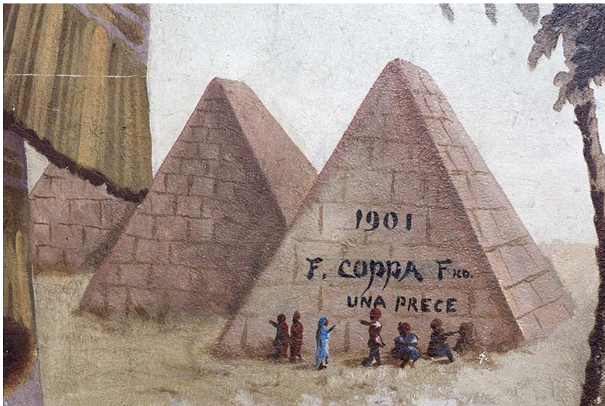
3e palier (à droite) : pyramides (avec détail de la signature et de la date). 25, Morteau, 8 rue Gonsalve Pertusier