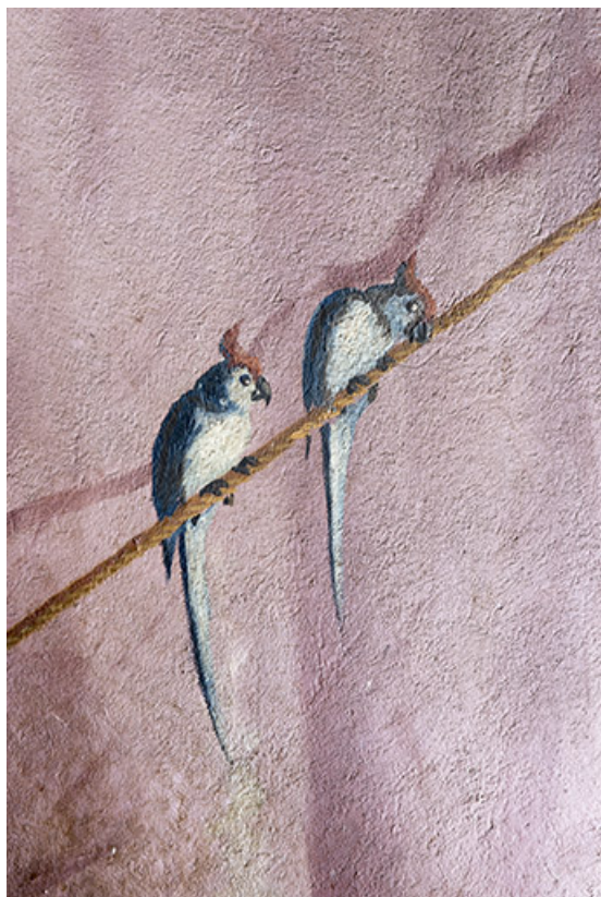
Décor de la 1ère volée : deux perroquets.