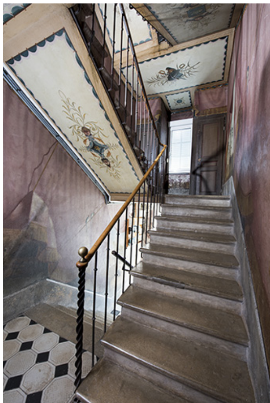
Cage d'escalier décorée. 25, Morteau