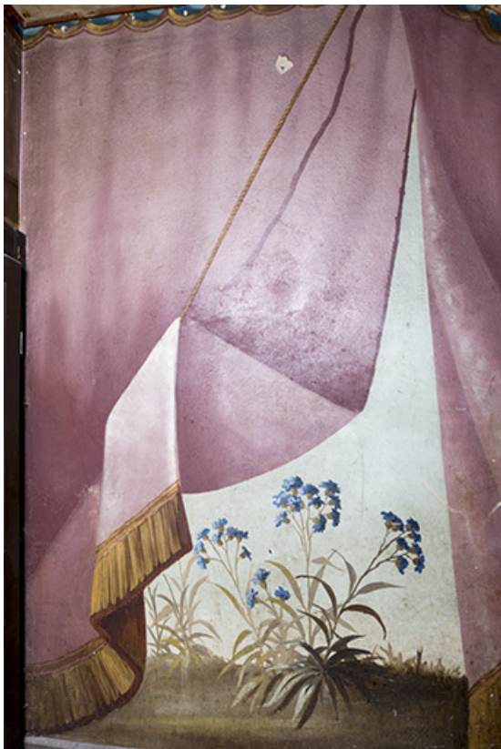
Repos entre le 1er et le 2e palier (à droite) : fleurs.