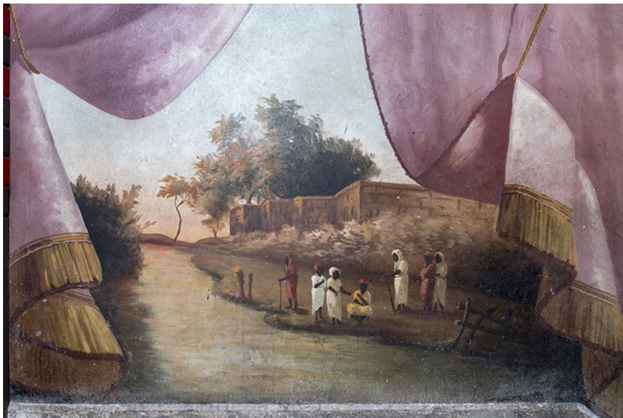
1er palier (à droite) : personnage entre rivière et murailles, en Afrique (détail). 25, Morteau, 8 rue Gonsalve Pertusier