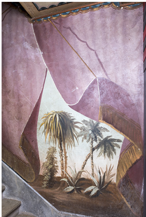
1er palier (à gauche) : palmiers.