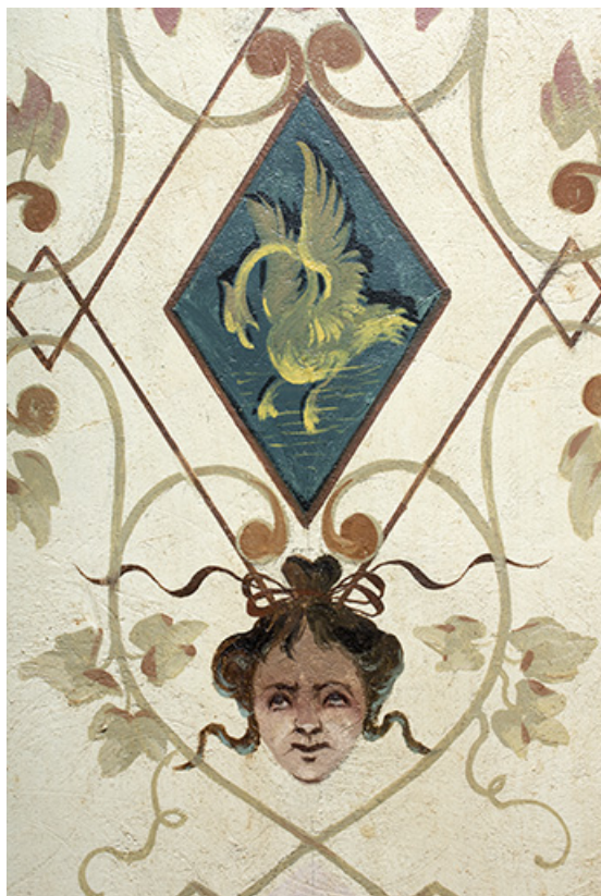
Décor du plafond de la 3e volée : détail du motif central et d'une tête. 25, Morteau, 8 rue Gonsalve Pertusier