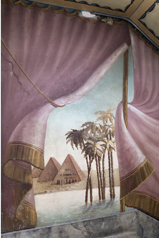
3e palier (à droite) : pyramides et palmiers. 25, Morteau, 8 rue Gonsalve Pertusier