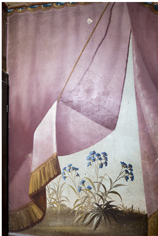
Repos entre le 1er et le 2e palier (à droite) : fleurs.