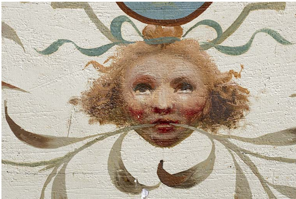
Plafond de la 4e volée : détail d'une tête.