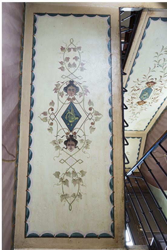
Plafond de la 3e volée.