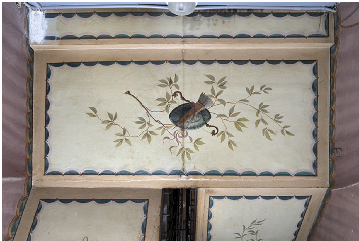
Plafond du 2e palier : trophée d'armes avec carquois.