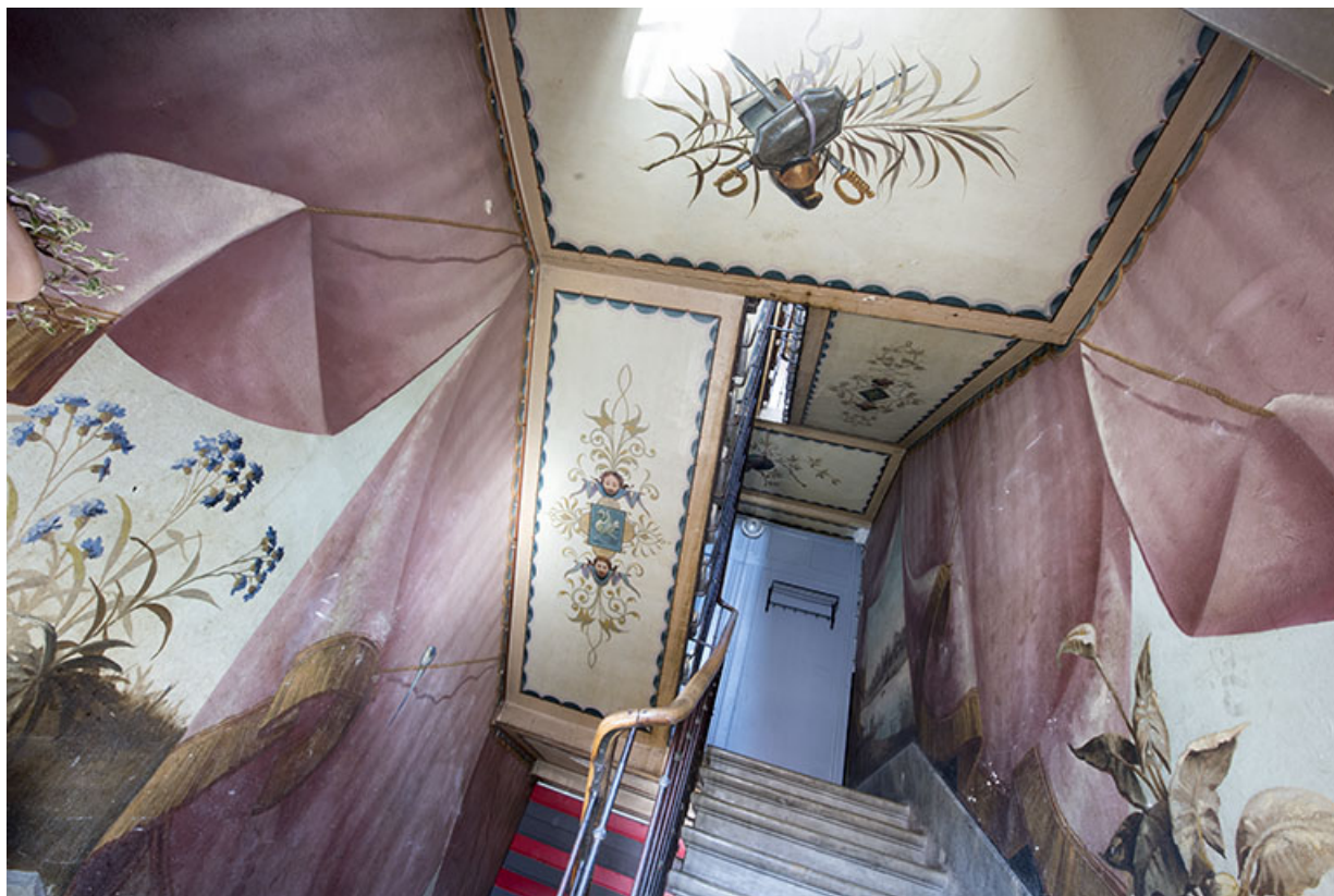
Cage d'escalier au niveau de la 3e volée.