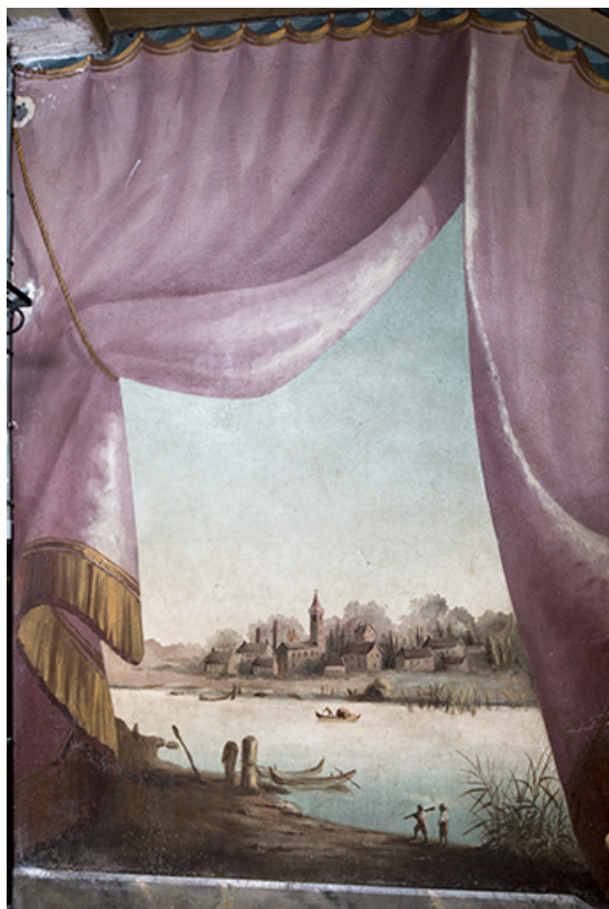
Décor du 2e palier (à droite) : ville et rivière. 25, Morteau