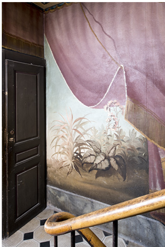
Repos entre le 2e et le 3e palier (à droite) : végétation avec fleurs. 25, Morteau, 8 rue Gonsalve Pertusier