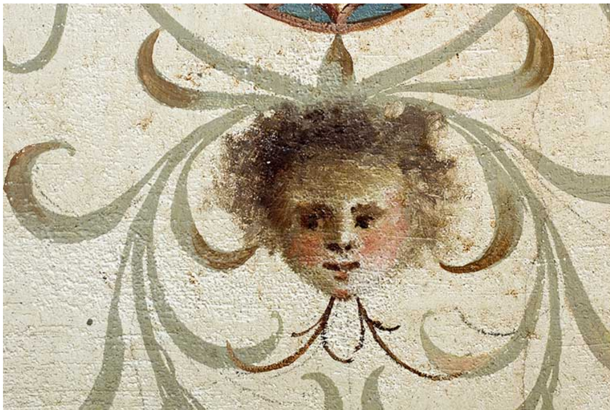
Plafond de la 5e volée : détail d'une tête.