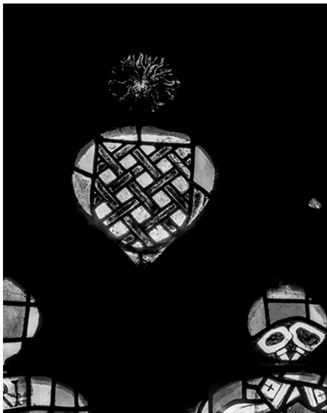
Détail : écu armorié placé au centre du tympan. 25, Abbans-Dessous