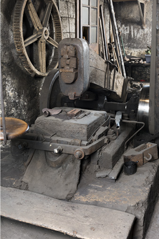
Enclume sur sa chabotte et marteau.

25, Grand'Combe-Châteleu, 5-9 Pré Rondot