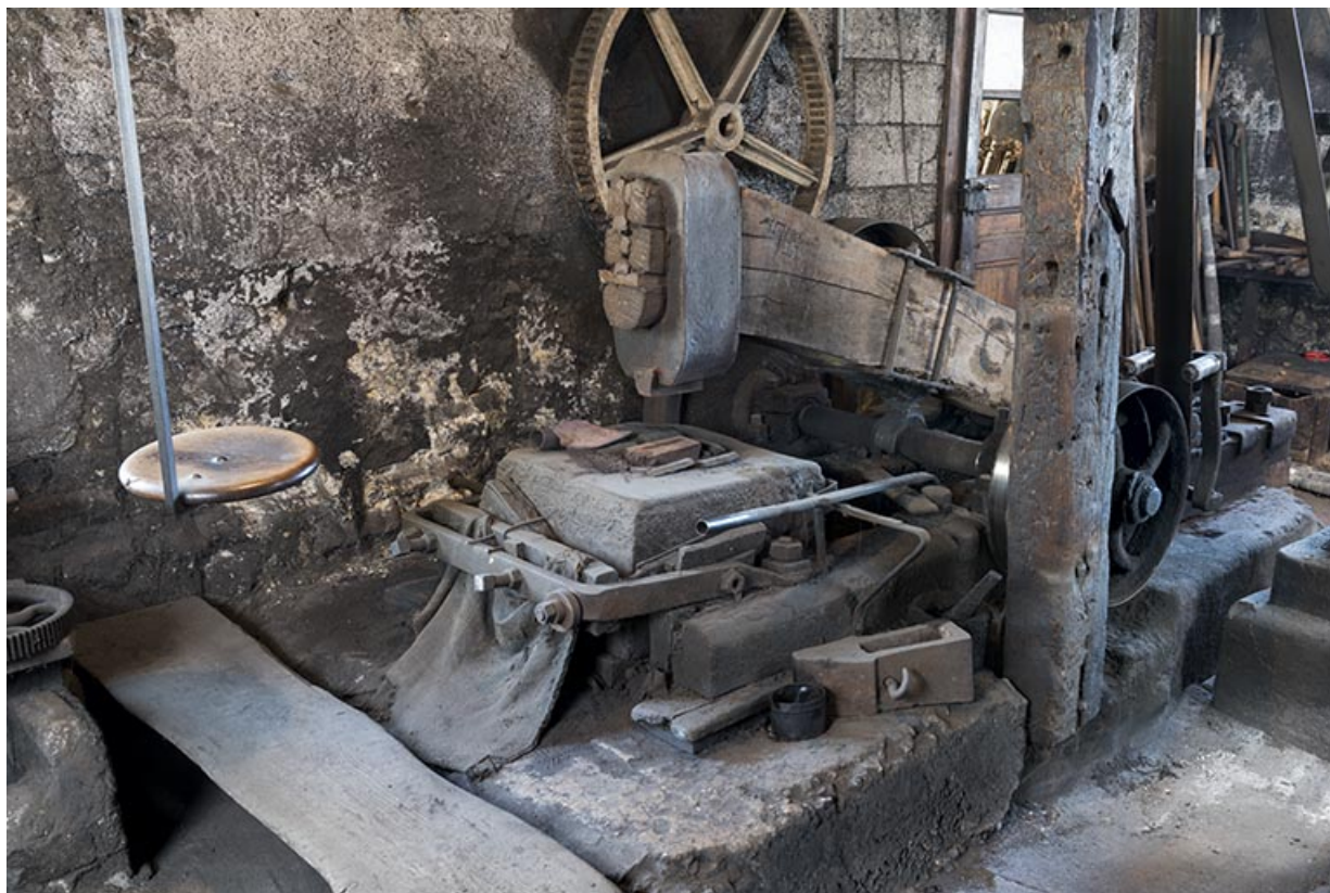
Tête du martinet et poste de travail.