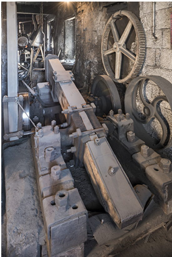
Vue d'ensemble, depuis l'extrémité du manche.

25, Grand'Combe-Châteleu, 5-9 Pré Rondot