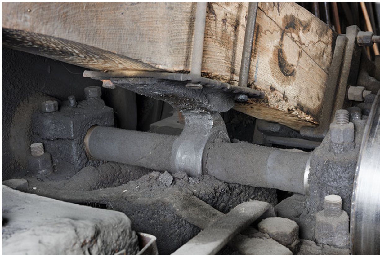
Came en appui contre la plaque de renfort du manche.

25, Grand'Combe-Châteleu, 5-9 Pré Rondot