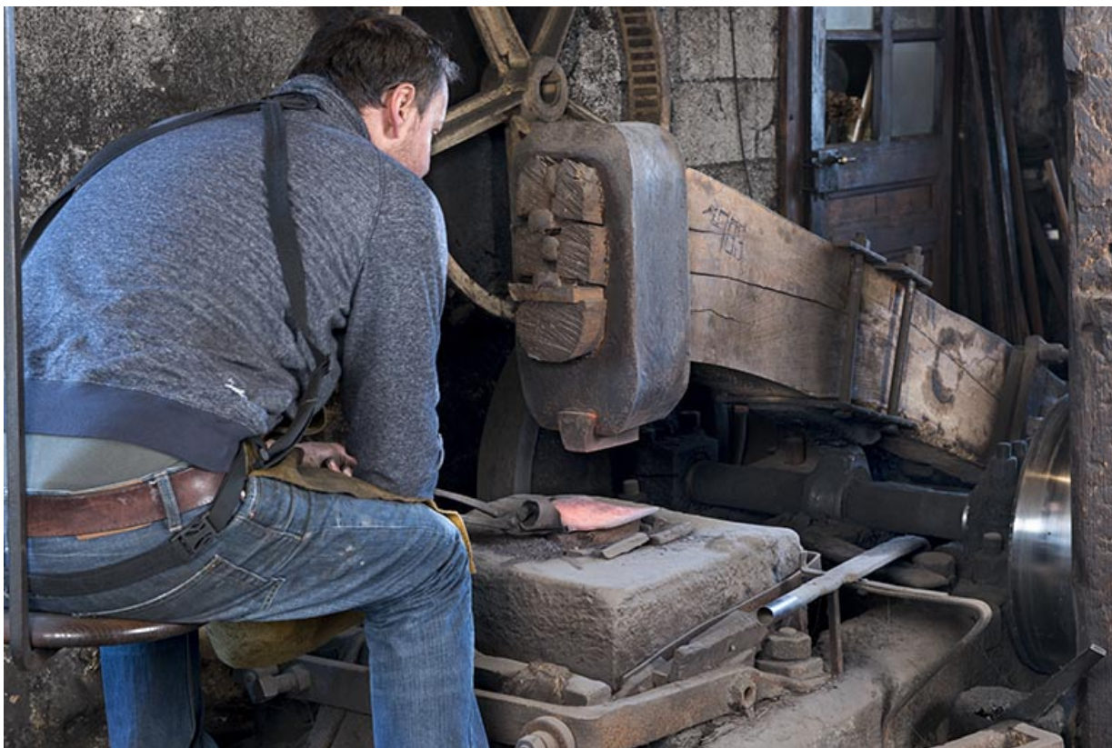
Martinet de l'atelier de taillanderie Vuillemin, à Grand'Combe-Châteleu.