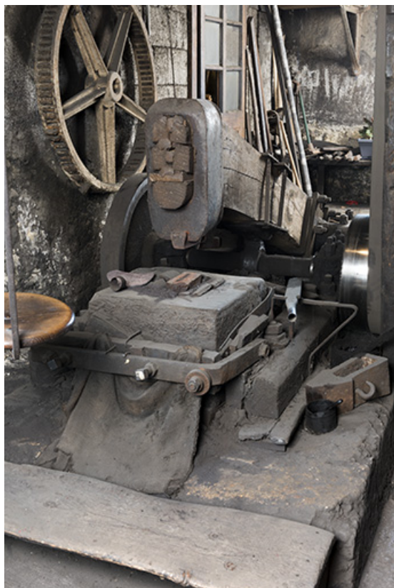
Enclume sur sa chabotte et marteau.

25, Grand'Combe-Châteleu, 5-9 Pré Rondot