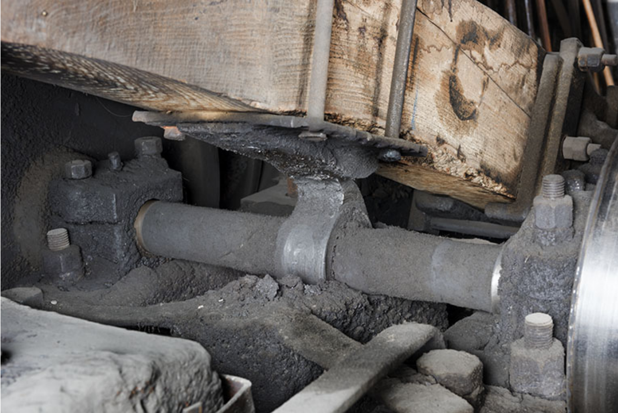
Came en appui contre la plaque de renfort du manche.

25, Grand'Combe-Châteleu, 5-9 Pré Rondot