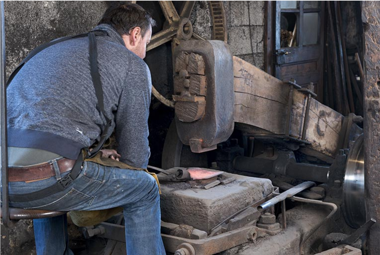
Martinet de l'atelier de taillanderie Vuillemin, à Grand'Combe-Château.