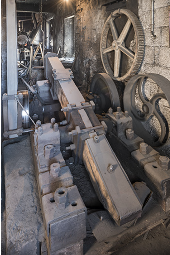
Vue d'ensemble, depuis l'extrémité du manche.