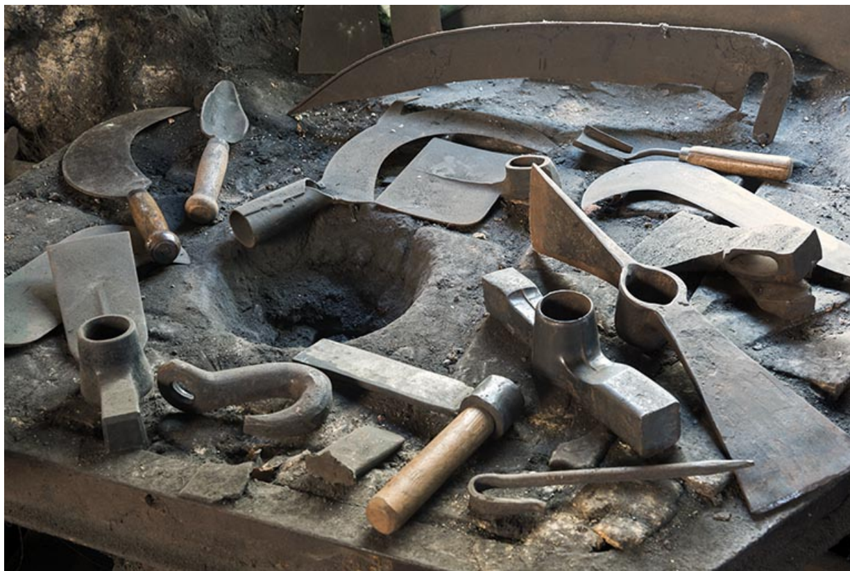
Exemple d'outils fabriqués par l'entreprise (placés sur un ancien foyer de fournaise).