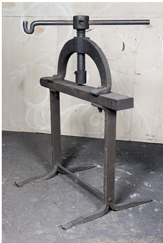
Presse à vis de fabrication artisanale.

25, Grand'Combe-Châteleu, 5-9 Pré Rondot