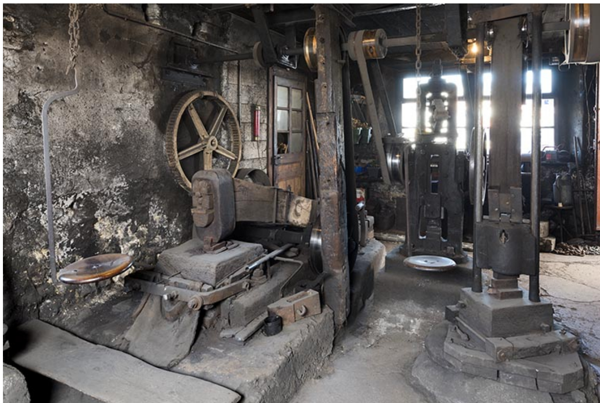
Forge : intérieur de l'atelier de travail à chaud (martinets et mouton).