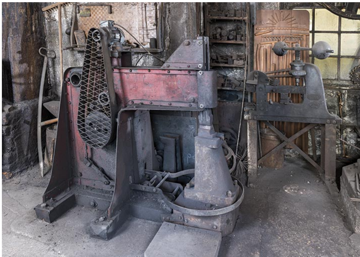
Vue de profil (avec la presse à balancier Groperrin à droite).

25, Grand'Combe-Châteleu, 5-9 Pré Rondot