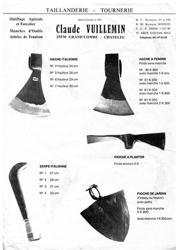
Taillanderie - tournerie Claude Vuillemin [production p. 1 : haches, pioches et serpe], 4e quart 20e siècle. 25, Grand'Combe-Châteleu, 5-9 Pré Rondot