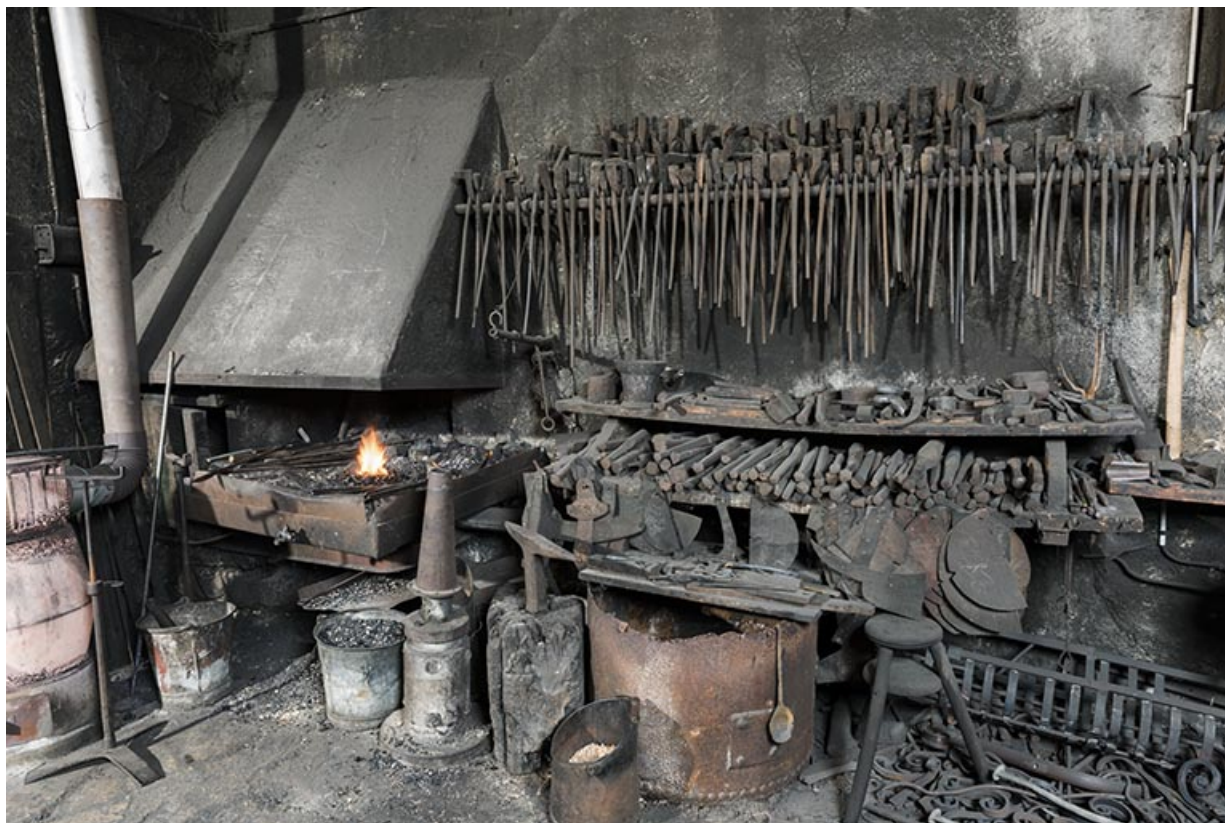
Forge : intérieur de l'atelier de travail à chaud (fournaise et outils de forgeron).