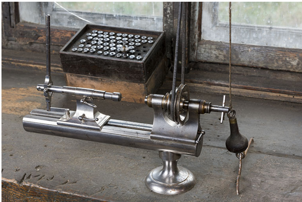
Vue d'ensemble, de trois quarts droite. 25, Les Gras