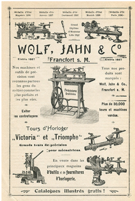
Publicité pour la société Wolf, Jahn & Co, 1er quart 20e siècle. 25, Les Gras