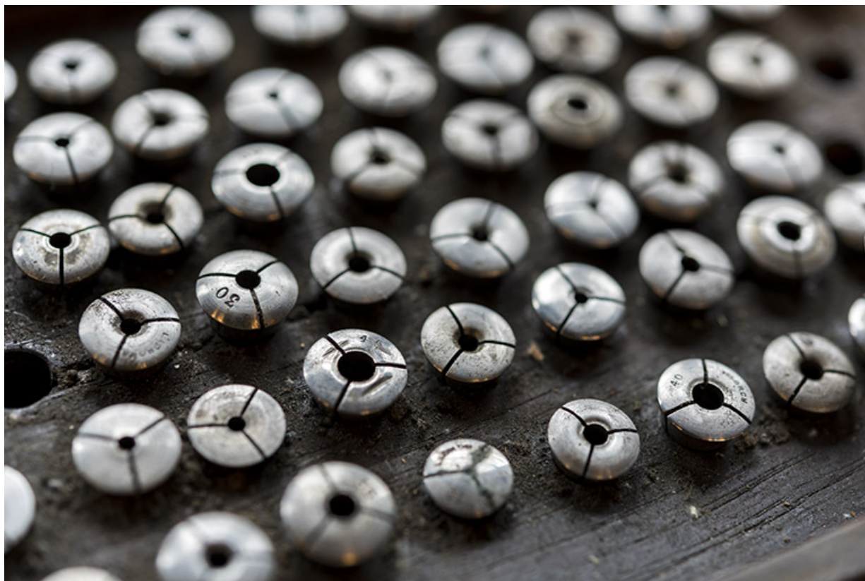
Pinces "américaines" dans la boîte d'accessoires. 25, Les Gras