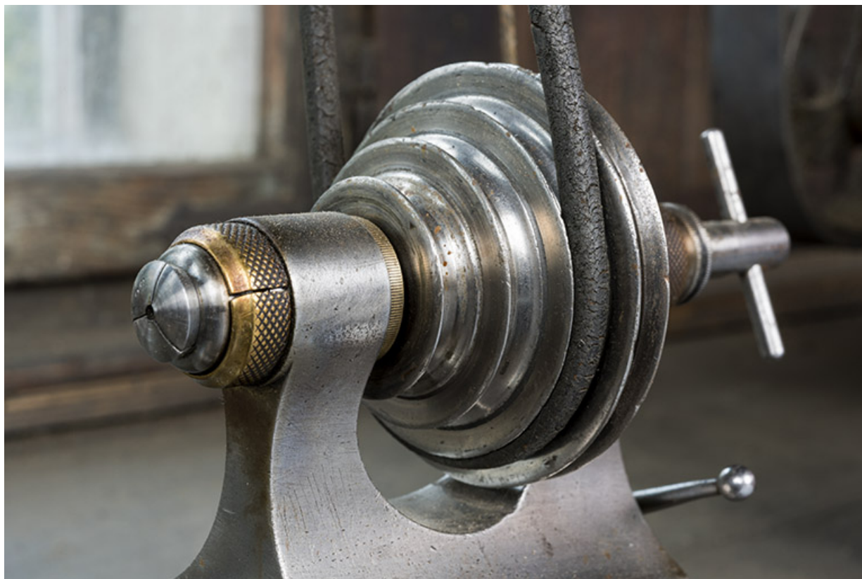
Lunette double avec l'arbre moteur, sa poulie et la pince (à gauche). 25, Les Gras