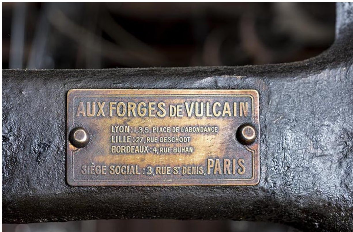
Plaque des Forges de Vulcain.