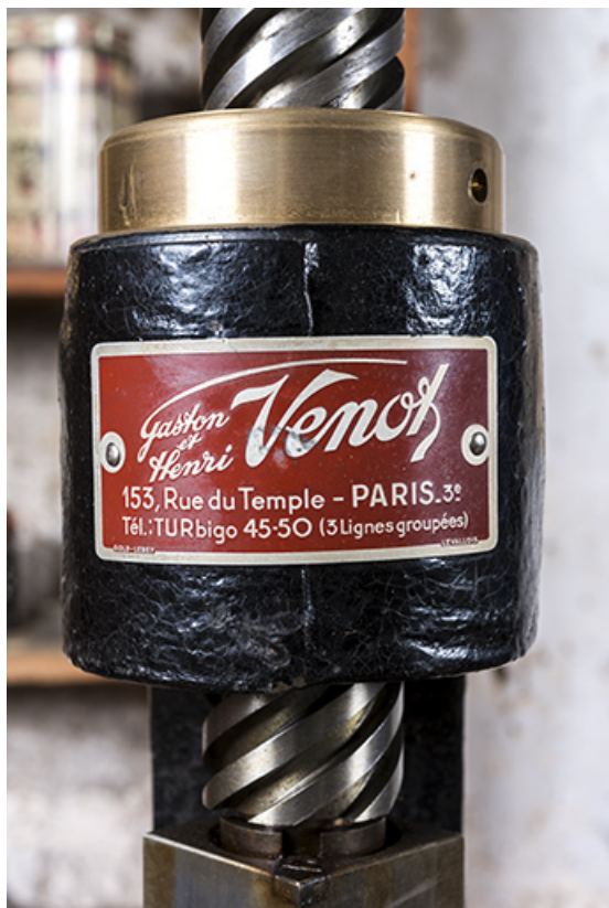
Plaque du constructeur. 25, Les Gras