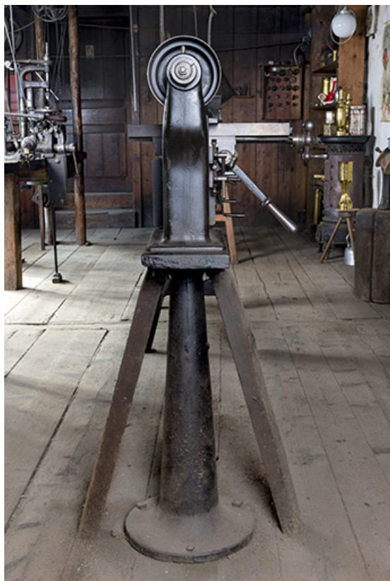
Vue de profil, montrant le socle.