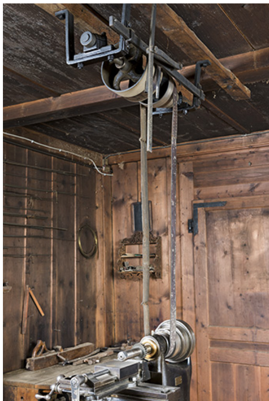
Vue de trois quarts, montrant la transmission. 25, Les Gras