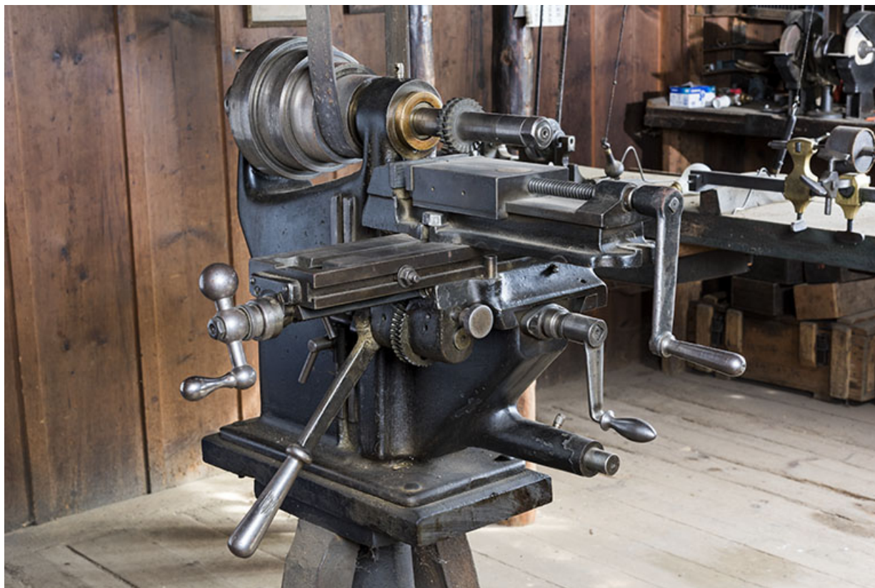
Vue d'ensemble, de trois quarts gauche. 25, Les Gras