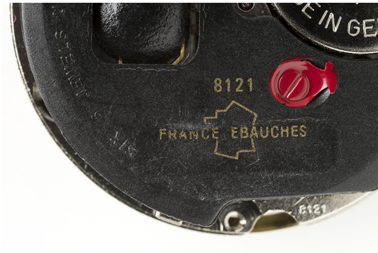
Mouvement France Ebauches FE 8121 : logotype et numéro de modèle. 25, Villers-le-Lac