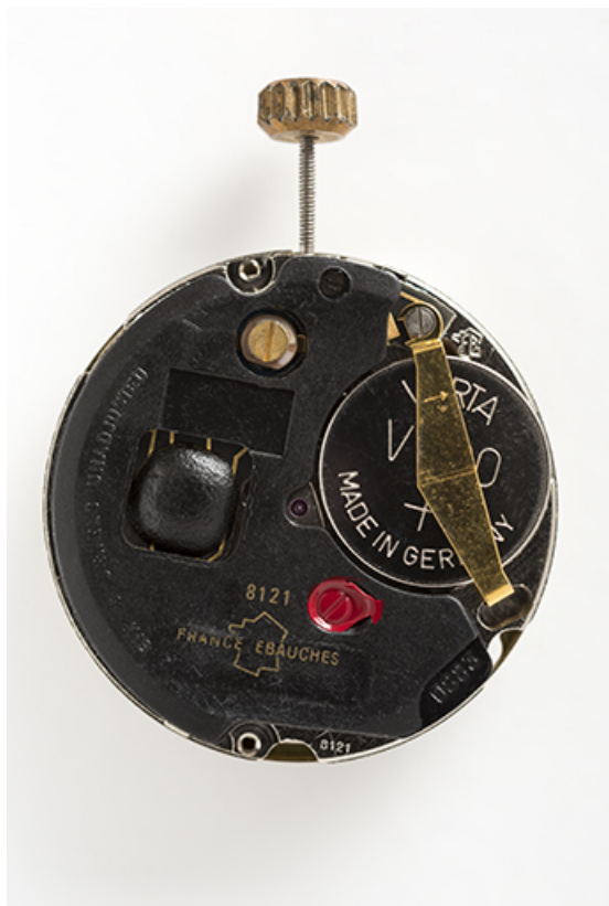
Module de montre à quartz France Ebauches FE 8121. 25, Villers-le-Lac