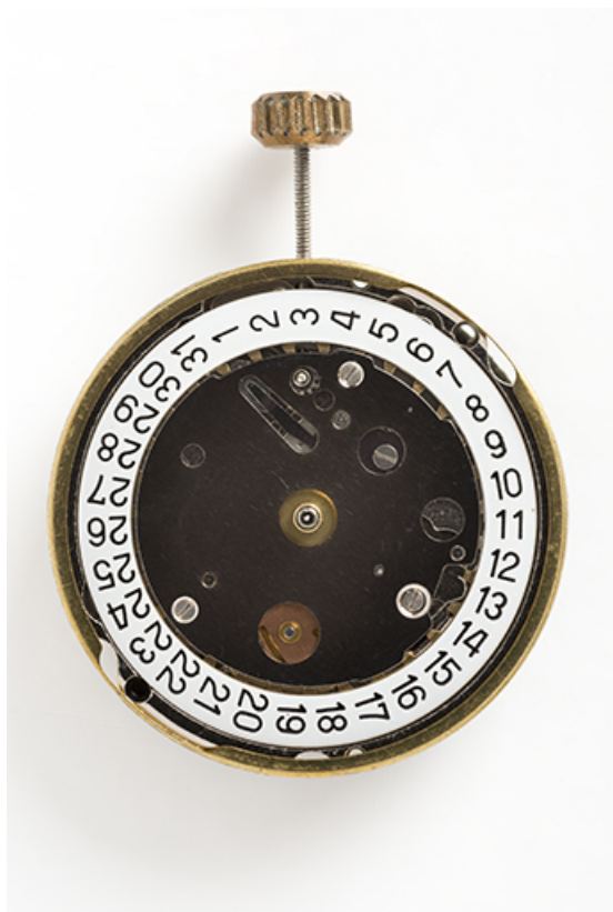
Mouvement France Ebauches FE 8121 : face côté cadran.