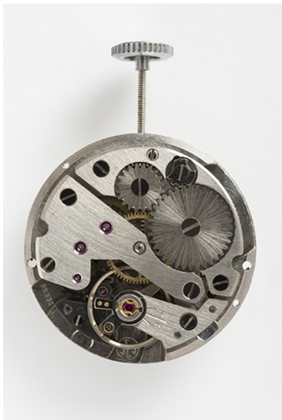
Mouvement Jeambrun PS 33 C : face côté ponts. 25, Villers-le-Lac