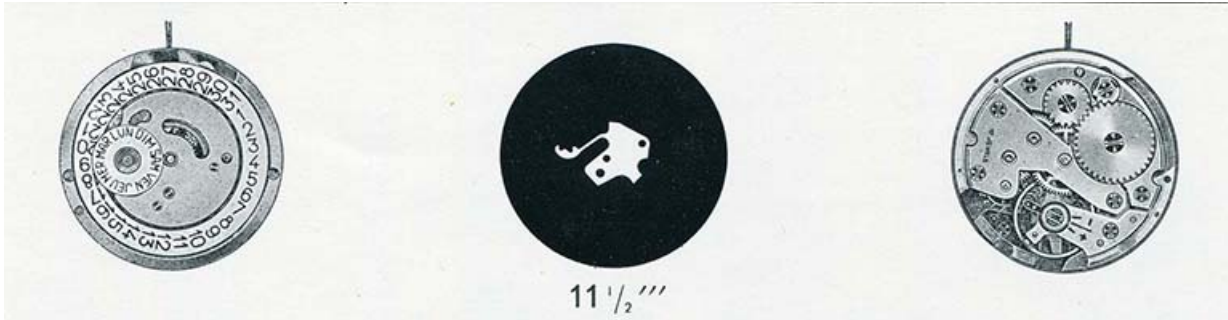
[Dessin du mouvement France Ebauches PS 33 C], 1973. 25, Villers-le-Lac