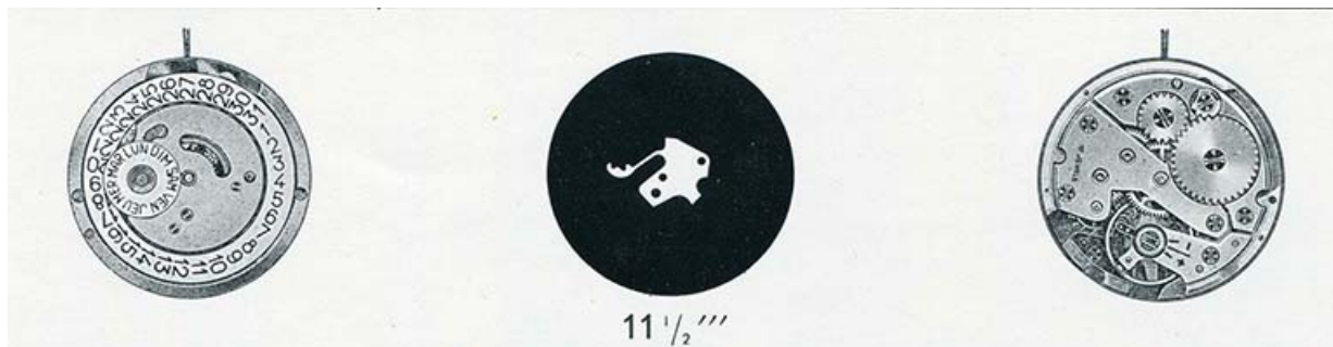
[Dessin du mouvement France Ebauches PS 33 C], 1973.