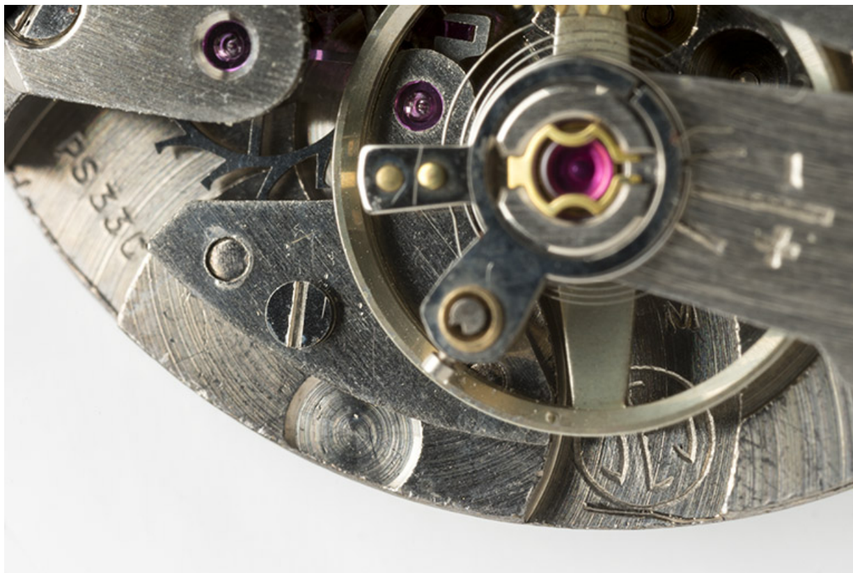
Logotype Jeambrun et numéro de modèle. 25, Villers-le-Lac