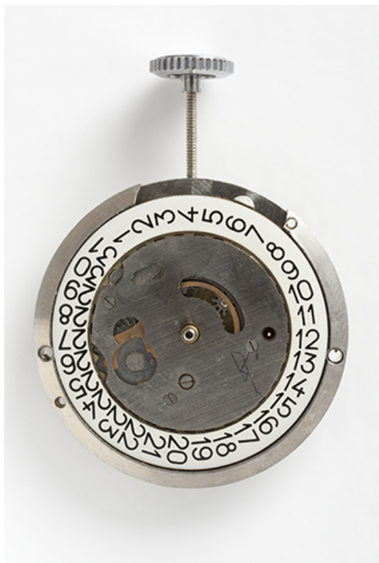
Mouvement Jeambrun PS 33 C : face côté cadran. 25, Villers-le-Lac