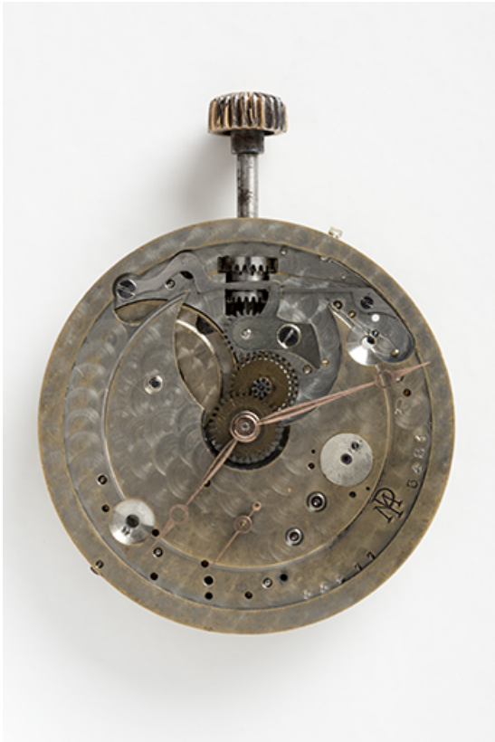
Mouvement Parrenin-Marguet : face côté cadran. 25, Villers-le-Lac