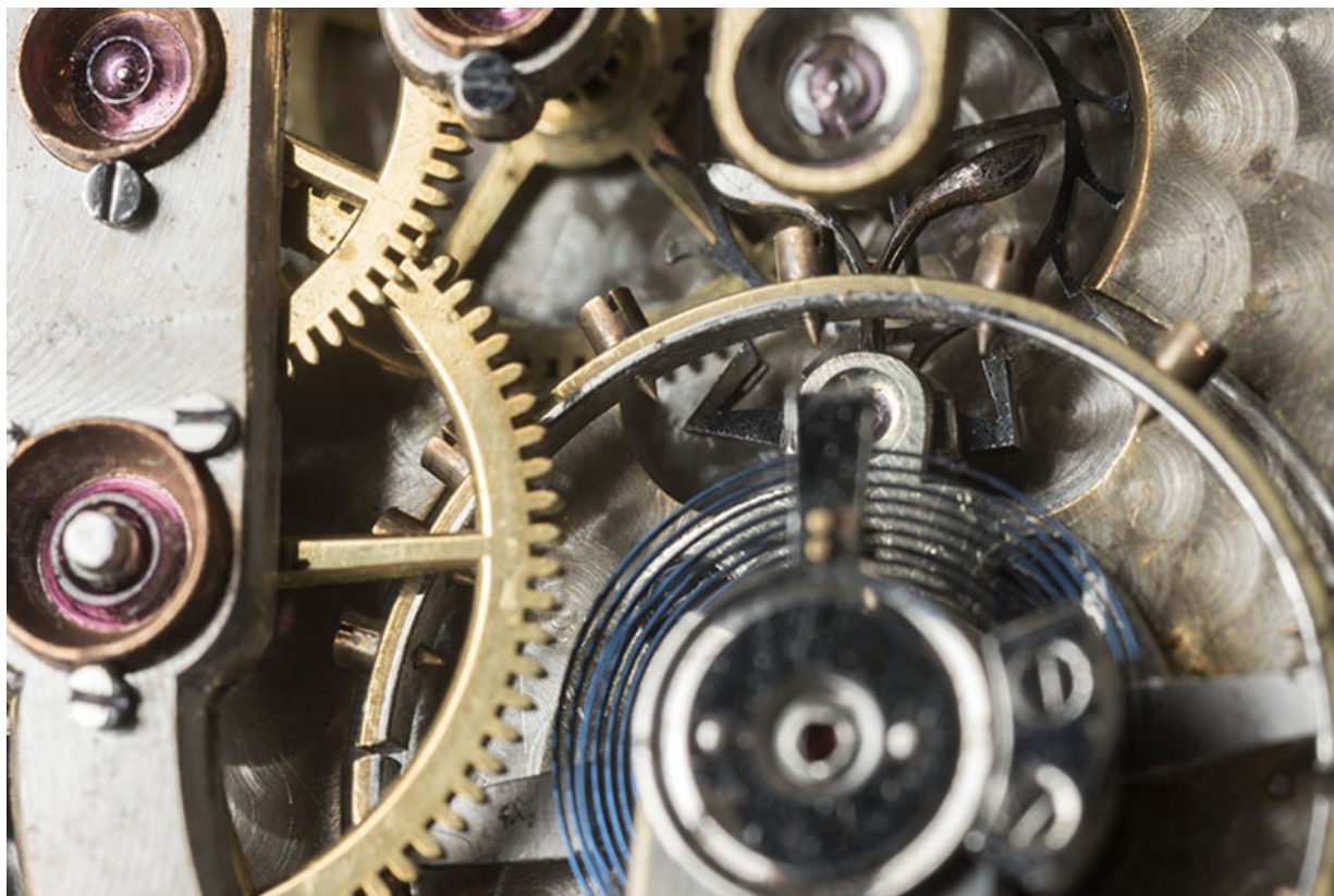
Détail de la roue d'ancre, de l'ancre et de son contrepoids. 25, Villers-le-Lac