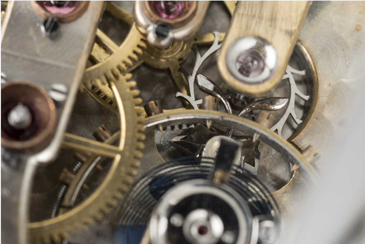
Détail de la roue d'ancre, de l'ancre et de son contrepoids.