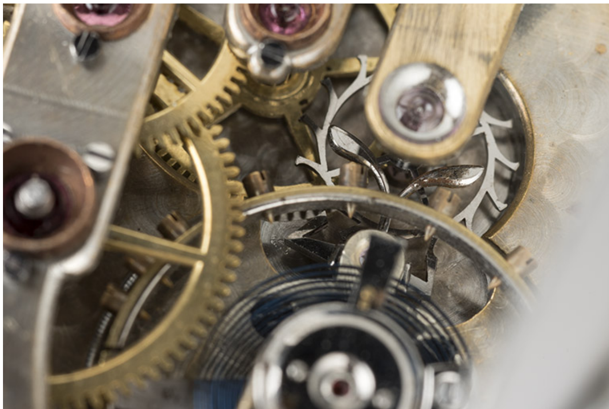
Détail de la roue d'ancre, de l'ancre et de son contrepoids. 25, Villers-le-Lac