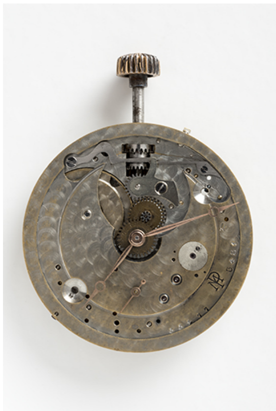
Mouvement Parrenin-Marguet : face côté cadran. 25, Villers-le-Lac