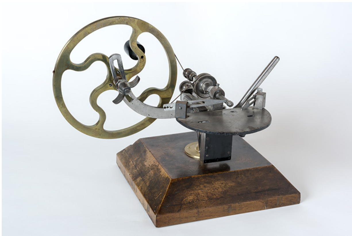
Machine à fraiser Baverel (1899). Réalisée dans la ferme et l'atelier de mécanique de précision de Francis Baverel, aux Pargots, au 13 rue des Vieux Pargots.