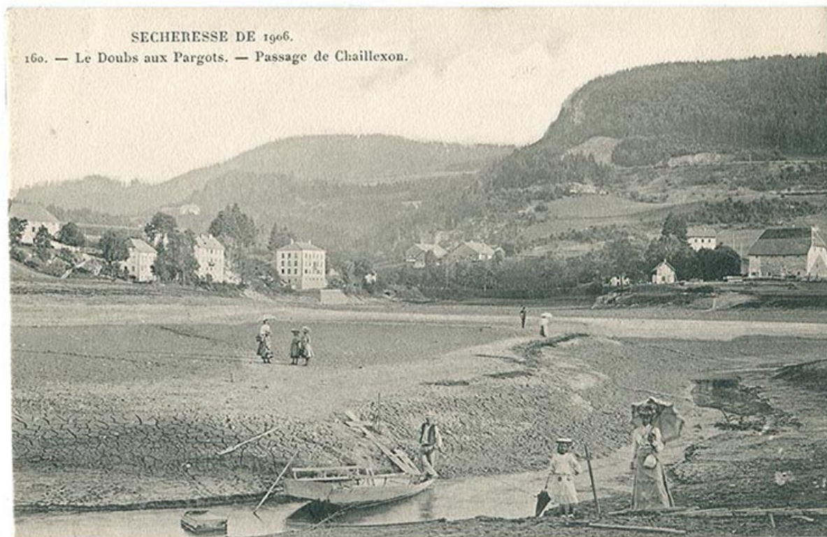
Sécheresse de 1906. 160. - Le Doubs aux Pargots. - Passage de Chaillexon. La barque est du même modèle que la maquette. 25, Villers-le-Lac, 16 rue de l' Ile, lieudit : les Bassots