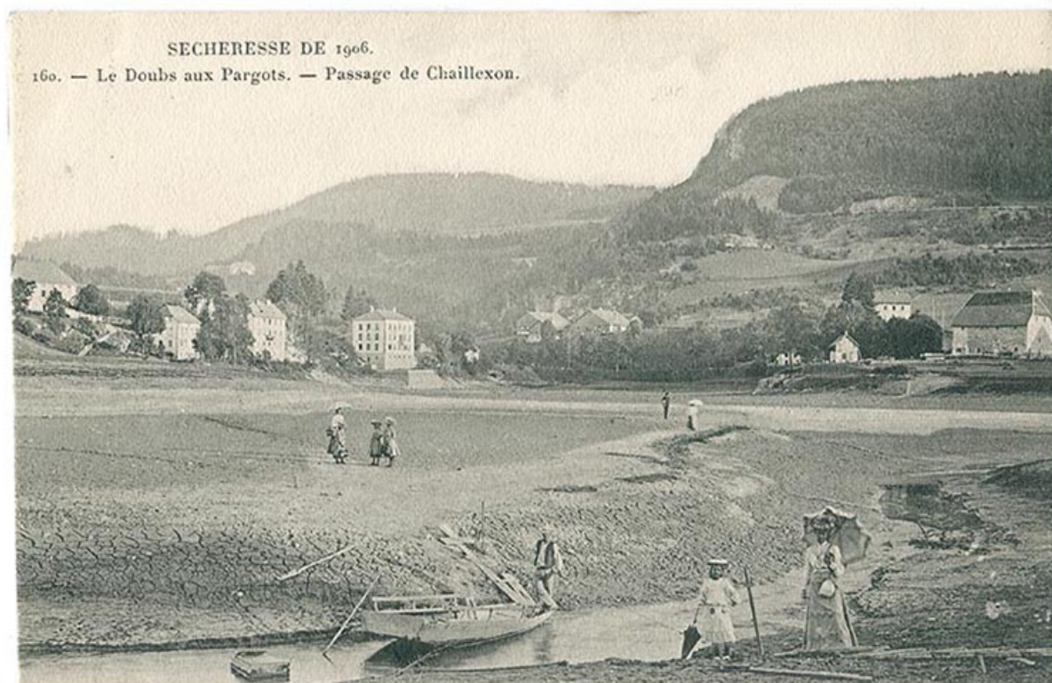
Sécheresse de 1906. 160. - Le Doubs aux Pargots. - Passage de Chaillexon. La barque est du même modèle que la maquette. 25, Villers-le-Lac, 16 rue de l' Ile, lieudit : les Bassots

Sécheresse de 1906. 160. - Le Doubs aux Pargots. - Passage de Chaillexon, carte postale, s.n., Farine Frères éd. au Locle et à Morteau