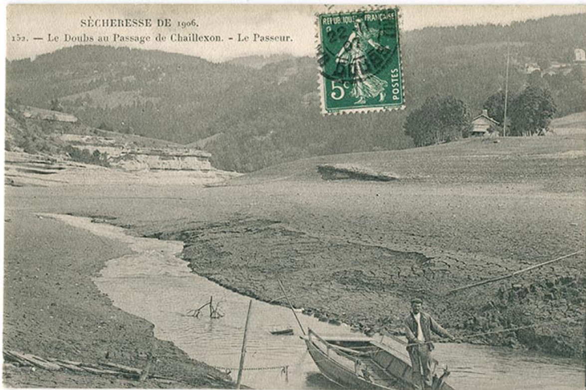
Sécheresse de 1906. 152. - Le Doubs au Passage de Chaillexon. - Le Passeur. 25, Villers-le-Lac, 16 rue de l' Ile, lieudit : les Bassots