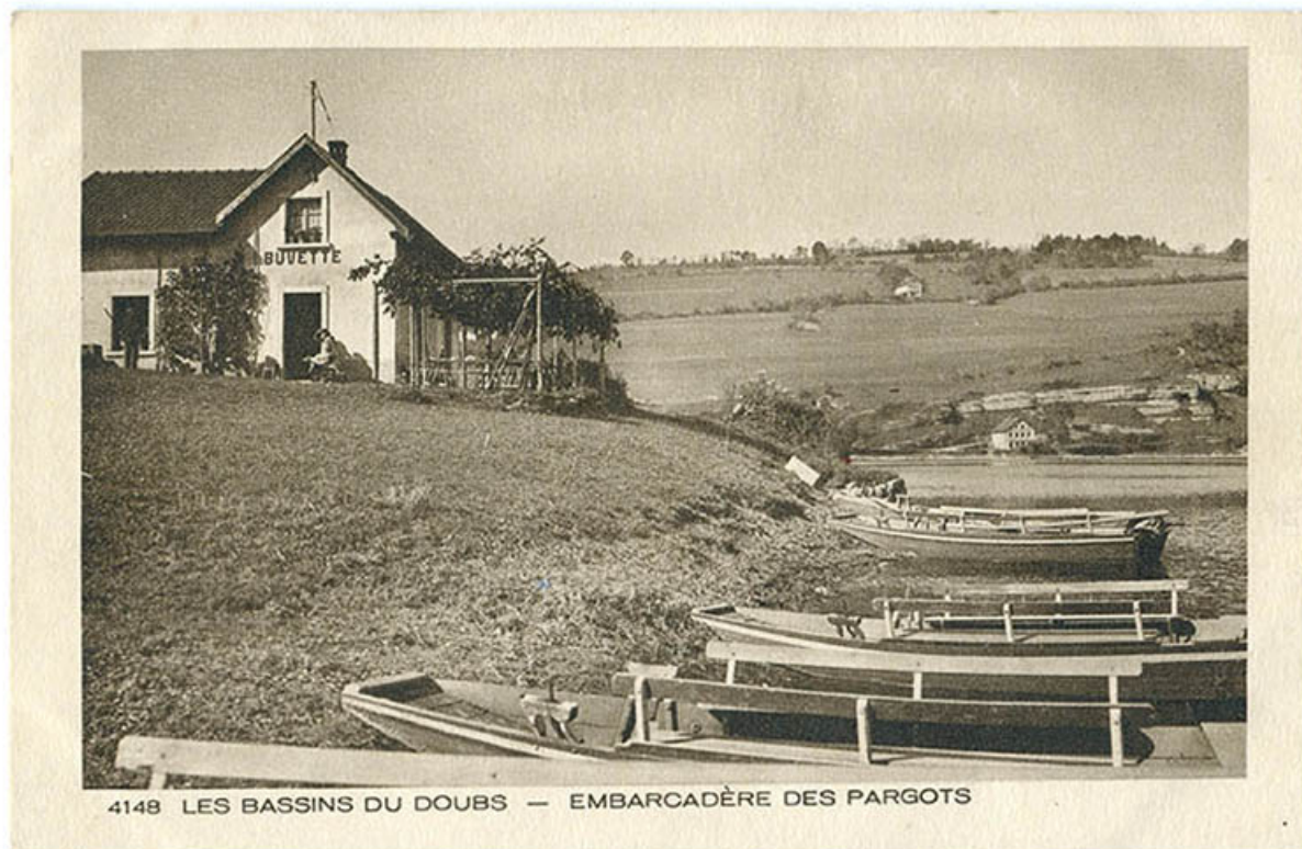
4148 Les bassins du Doubs.- Embarcadère des Pargots [actuel hôtel-restaurant Les Cygnes], 1ère moitié 20e siècle. 25, Villers-le-Lac, 16 rue de l' Ile, lieudit : les Bassots