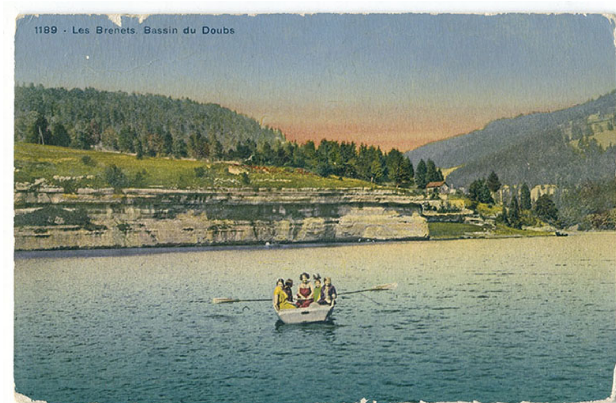
1189 - Les Brenets. Bassin du Doubs, 2e quart 20e siècle.

25, Villers-le-Lac, 16 rue de l' Ile, lieudit : les Bassots