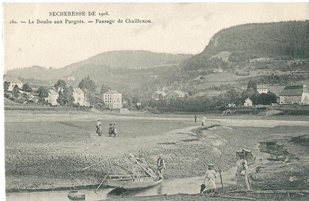
Sécheresse de 1906. 160. - Le Doubs aux Pargots. - Passage de Chaillexon. La barque est du même modèle que la maquette. 25, Villers-le-Lac, 16 rue de l' Ile, lieudit : les Bassots