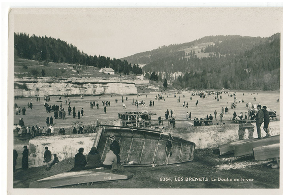
8364. Les Brenets, le Doubs en hiver, 2e quart 20e siècle [avant 1932]. La barque couchée sur le flanc est du modèle de la maquette.

25, Villers-le-Lac, 16 rue de l' Ile, lieudit : les Bassots