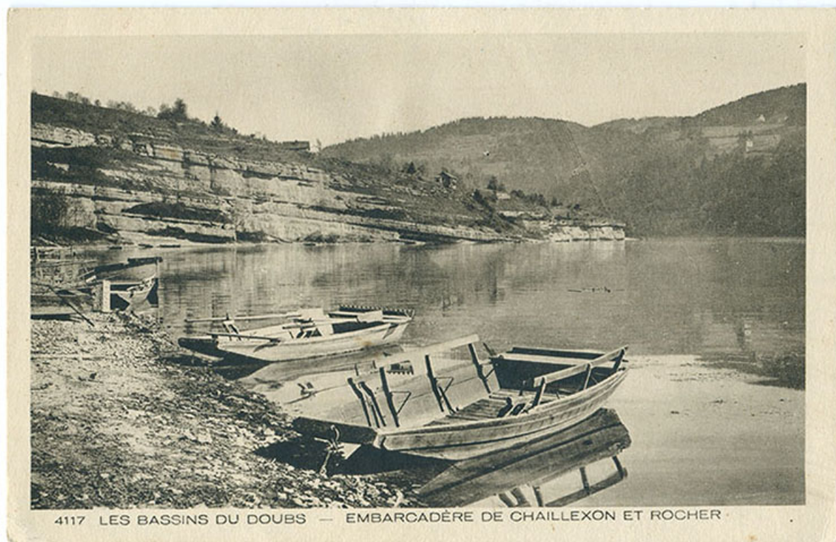
4117 Les bassins du Doubs- Embarcadère de Chaillexon et rocher, 1ère moitié 20e siècle. 25, Villers-le-Lac, 16 rue de l' Ile, lieudit : les Bassots