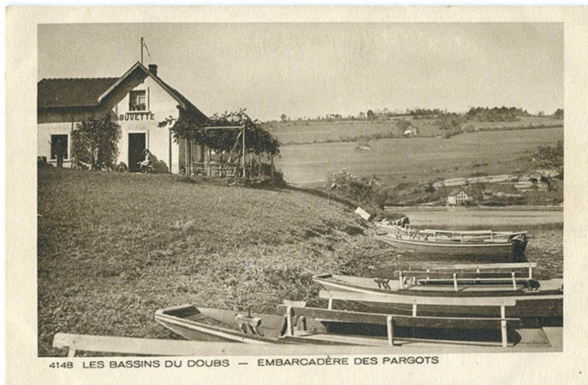
4148 Les bassins du Doubs.- Embarcadère des Pargots [actuel hôtel-restaurant Les Cygnes], 1ère moitié 20e siècle. 25, Villers-le-Lac, 16 rue de l' Ile, lieudit : les Bassots

4148 Les bassins du Doubs.- Embarcadère des Pargots [actuel hôtel-restaurant Les Cygnes], carte postale, s.n., s.d. [1ère moitié 20e siècle], Braun et Cie impr.-éd. à Mulhouse-Dornach.