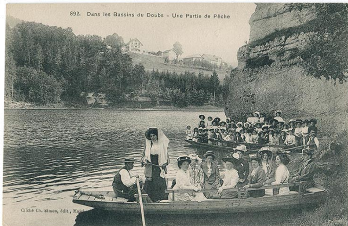
892. Dans les bassins du Doubs - Une partie de pêche, 1er quart 20e siècle.

25, Villers-le-Lac, 16 rue de l' Ile, lieudit : les Bassots