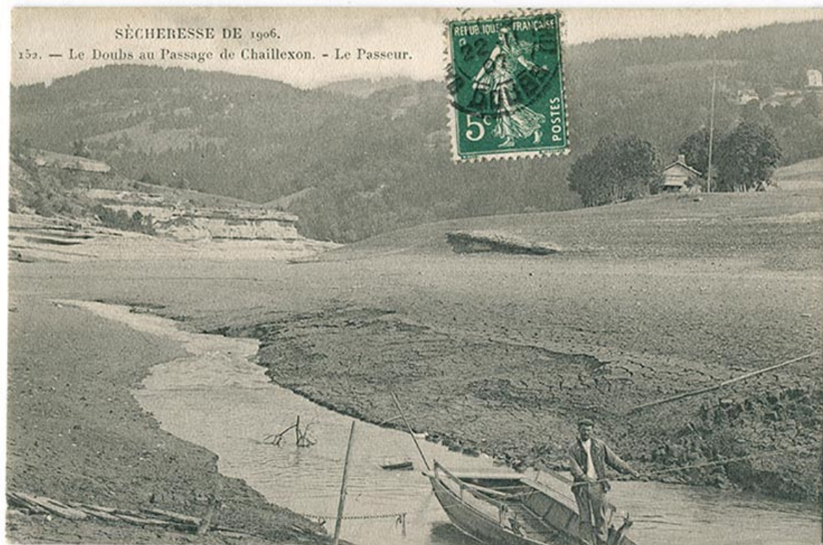
Sécheresse de 1906. 152. - Le Doubs au Passage de Chaillexon. - Le Passeur.

25, Villers-le-Lac, 16 rue de l' Ile, lieudit : les Bassots