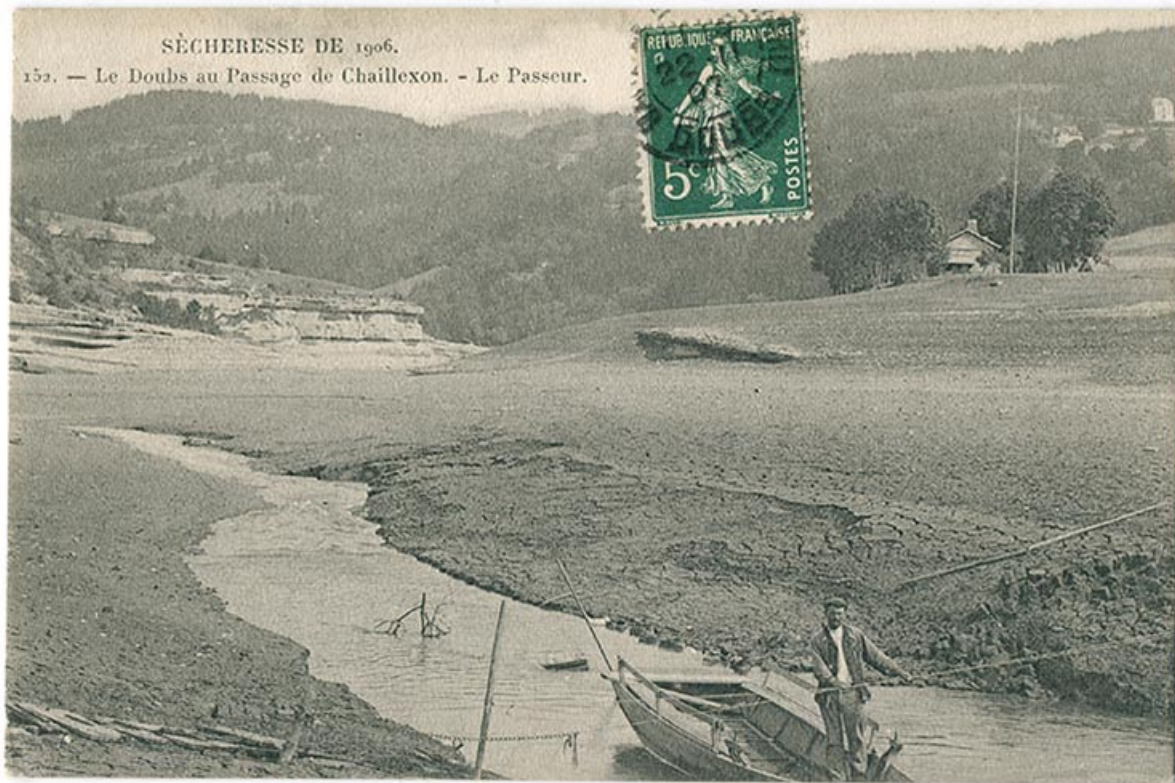
Sécheresse de 1906. 152. - Le Doubs au Passage de Chaillexon. - Le Passeur. 25, Villers-le-Lac, 16 rue de l' Ile, lieudit : les Bassots