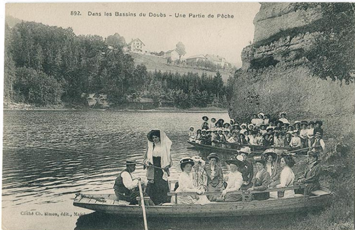
892. Dans les bassins du Doubs - Une partie de pêche, 1er quart 20e siècle.

25, Villers-le-Lac, 16 rue de l' Ile, lieudit : les Bassots