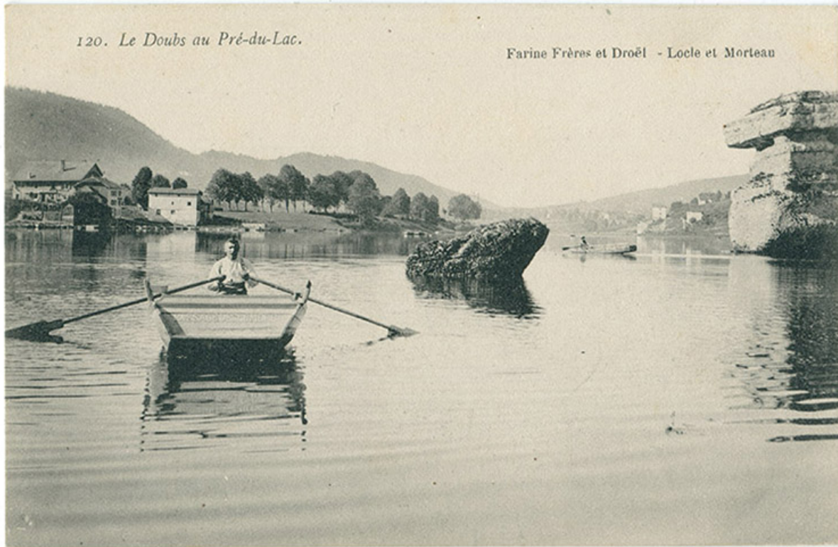
120. Le Doubs au Pré-du-Lac, 1ère moitié 20e siècle. 25, Villers-le-Lac, 16 rue de l' Ile, lieudit : les Bassots