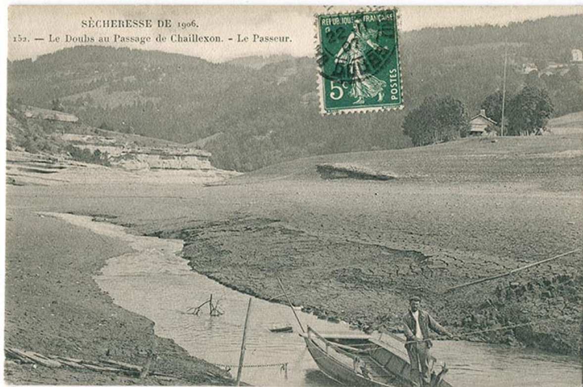
Sécheresse de 1906. 152. - Le Doubs au Passage de Chaillexon. - Le Passeur.

25, Villers-le-Lac, 16 rue de l' Ile, lieudit : les Bassots