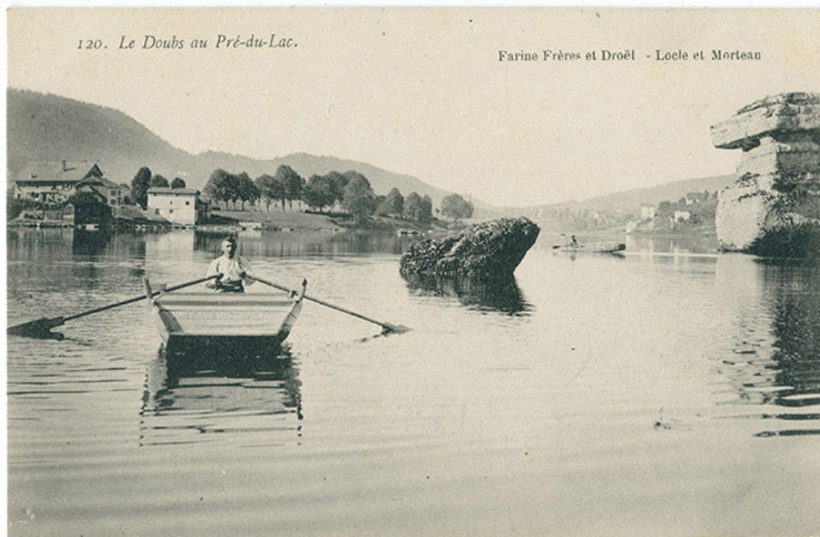
120. Le Doubs au Pré-du-Lac, 1ère moitié 20e siècle.

25, Villers-le-Lac, 16 rue de l' Ile, lieudit : les Bassots