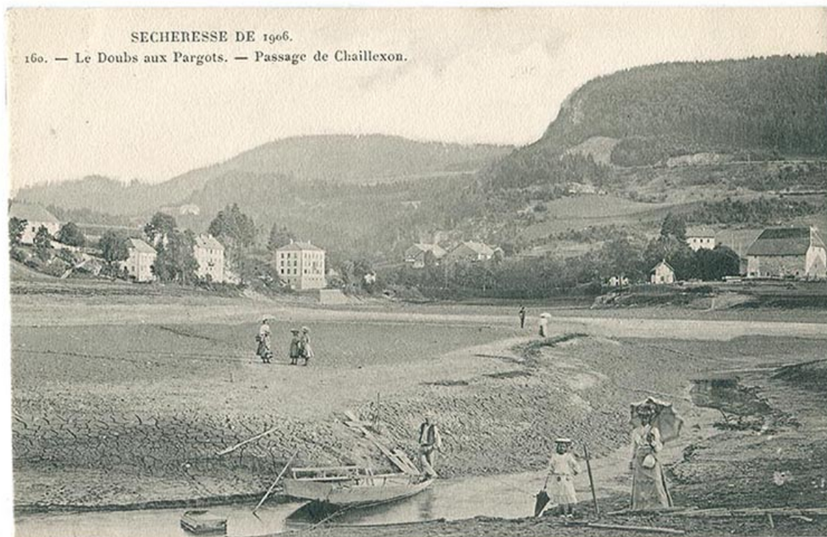
Sécheresse de 1906. 160. - Le Doubs aux Pargots. - Passage de Chaillexon. La barque est du même modèle que la maquette. 25, Villers-le-Lac, 16 rue de l' Ile, lieudit : les Bassots