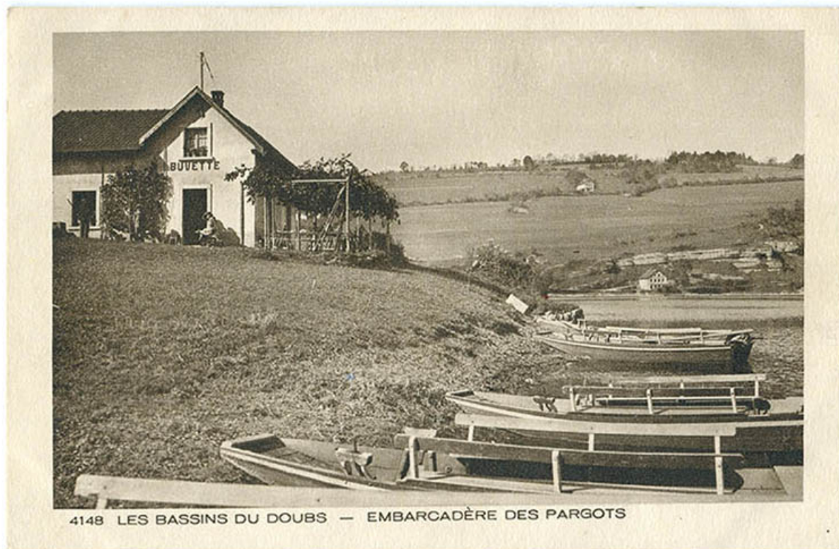
4148 Les bassins du Doubs.- Embarcadère des Pargots [actuel hôtel-restaurant Les Cygnes], 1ère moitié 20e siècle. 25, Villers-le-Lac, 16 rue de l' Ile, lieudit : les Bassots