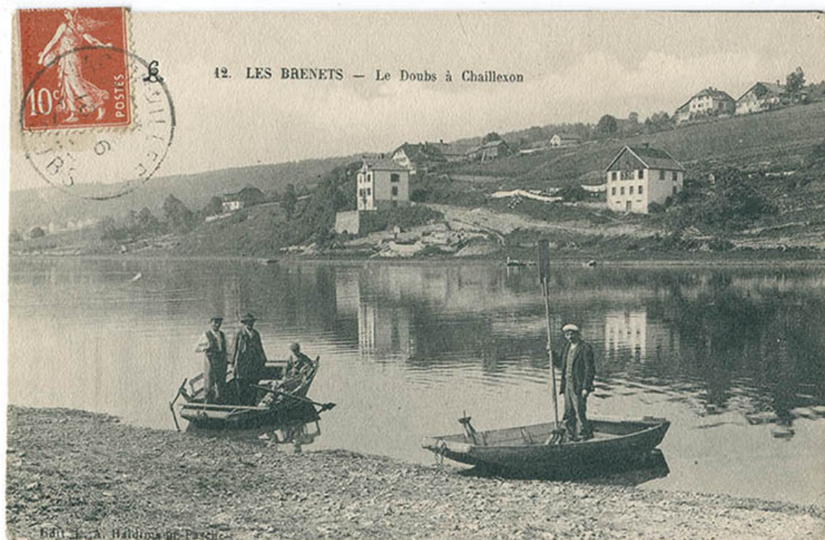
12. Les Brenets - Le Doubs à Chaillexon, 1er quart 20e siècle [entre 1908 et 1913].

25, Villers-le-Lac, 16 rue de l' Ile, lieudit : les Bassots