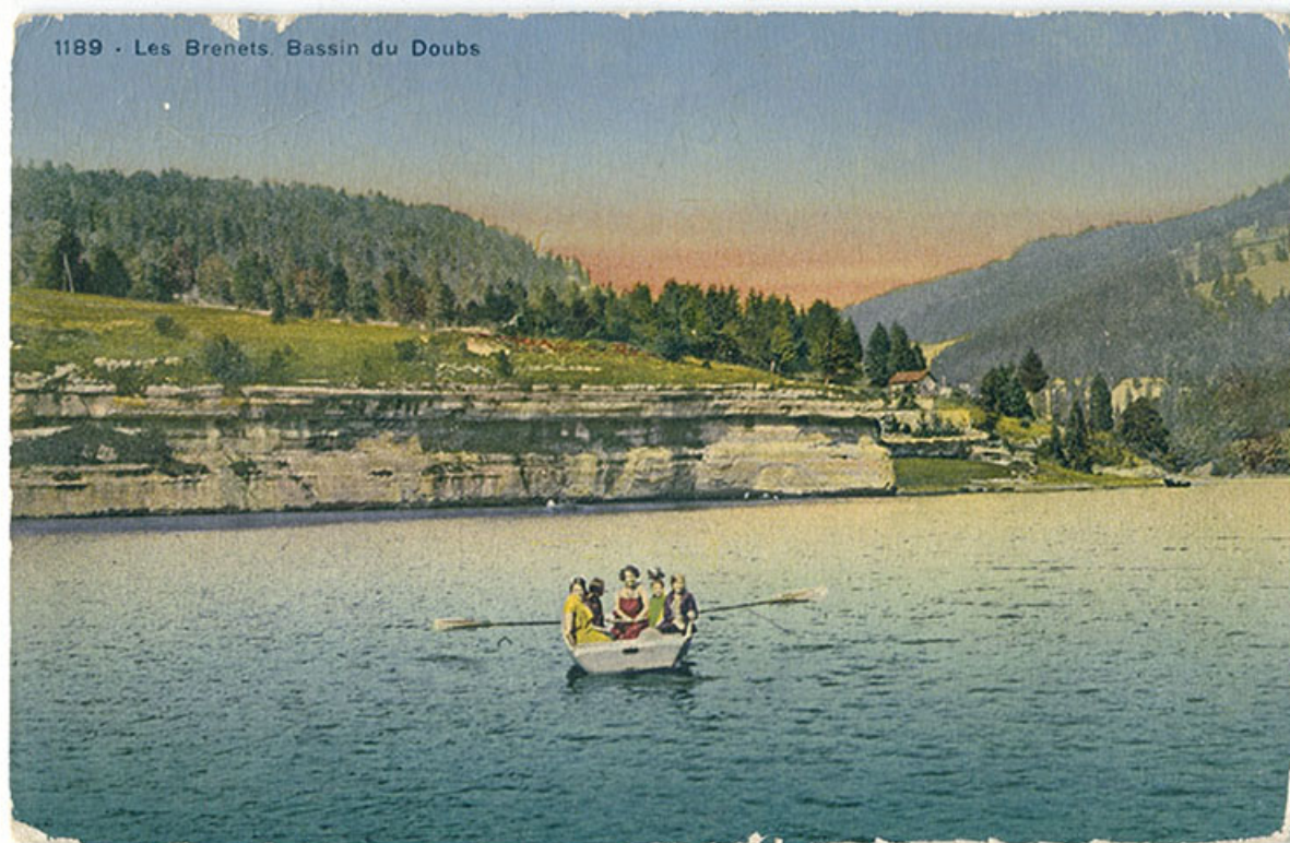
1189 - Les Brenets. Bassin du Doubs, 2e quart 20e siècle.

25, Villers-le-Lac, 16 rue de l' Ile, lieudit : les Bassots