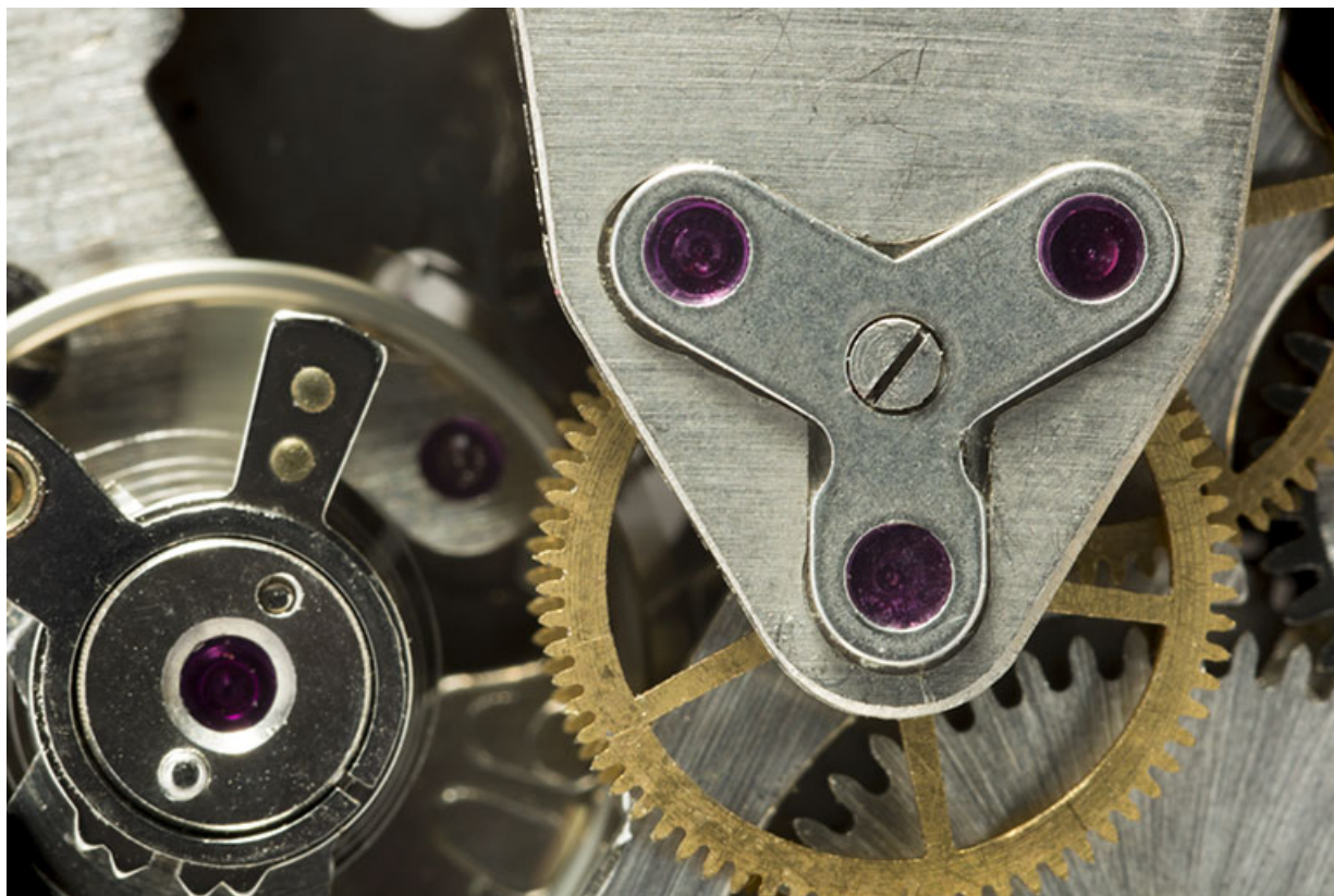
Mouvement Parrenin HP 90 : détail. 25, Villers-le-Lac