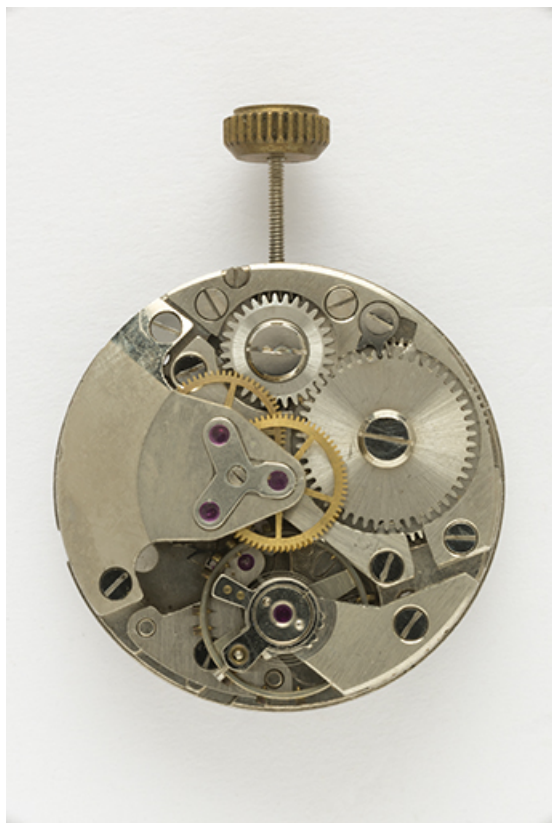
Mouvement Parrenin HP 90 : face côté ponts. 25, Villers-le-Lac