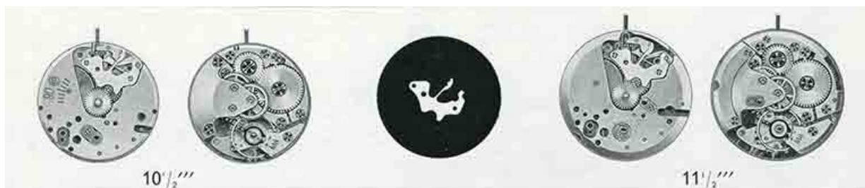
[Dessin des mouvements Parrenin HP 90 et HP 901], 1973.