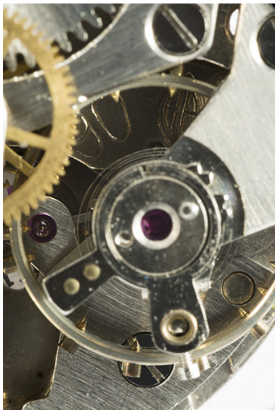
Logotype Parrenin et numéro de modèle. 25, Villers-le-Lac