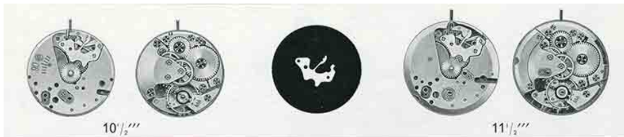
[Dessin des mouvements Parrenin HP 90 et HP 901], 1973.