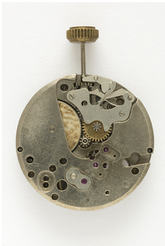
Mouvement Parrenin HP 90 : face côté cadran. 25, Villers-le-Lac