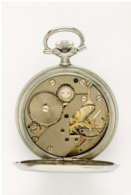
2e montre : mouvement Parrenin HP 40. 25, Villers-le-Lac