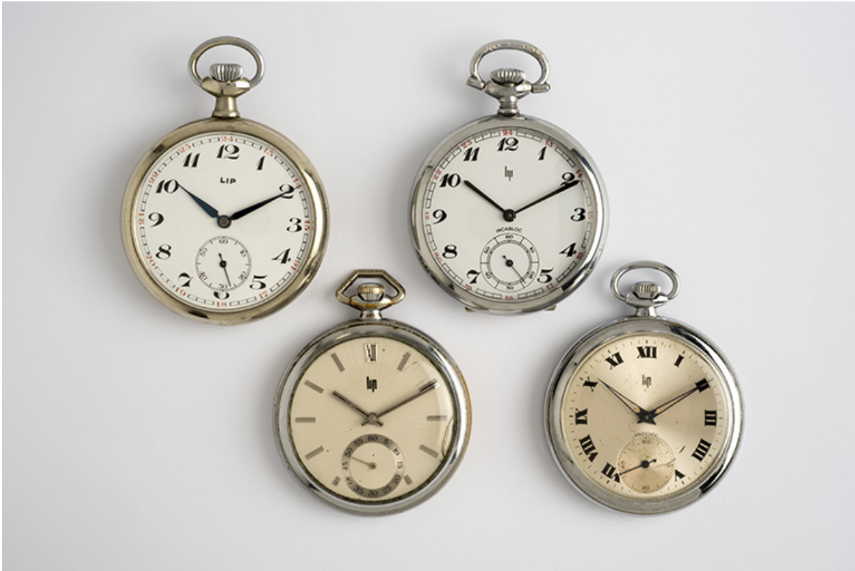
Montres de gousset mécaniques Lip.