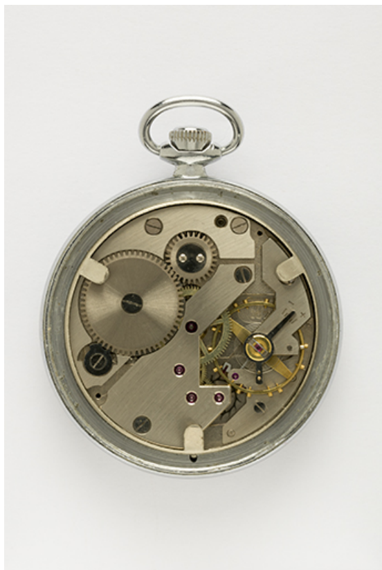
4e montre : mouvement Parrenin HP 40. 25, Villers-le-Lac