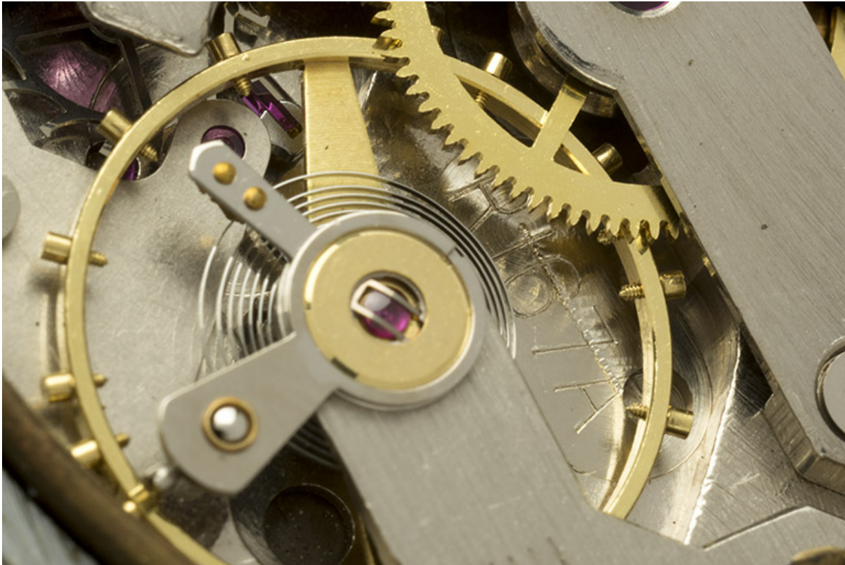
3e montre, mouvement Parrenin HP 40 : numéro de modèle Lip (R 167 A) gravé près du pont de balancier. 25, Villers-le-Lac