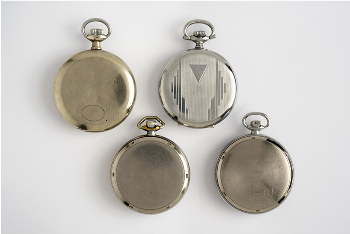
Vue d'ensemble des quatres montres : faces inférieures.