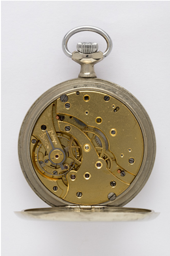
1ère montre : mouvement Lip 43 AC.