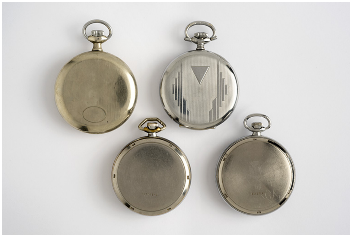
Vue d'ensemble des quatres montres : faces inférieures.