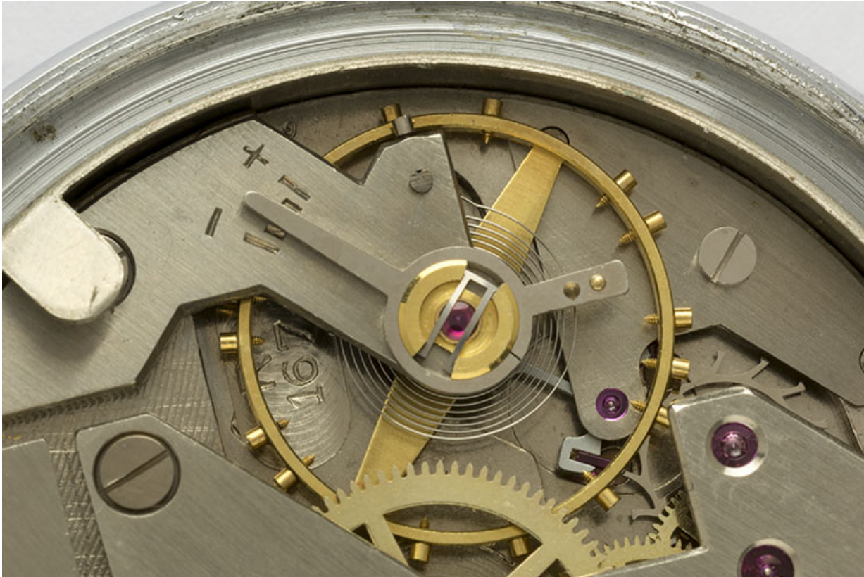
4e montre, mouvement Parrenin HP 40 : numéro de modèle Lip (R 167) gravé près du pont de balancier. Mal effacée, la pointe supérieure du logotype Parrenin est visible à gauche, près d'une vis du balancier.