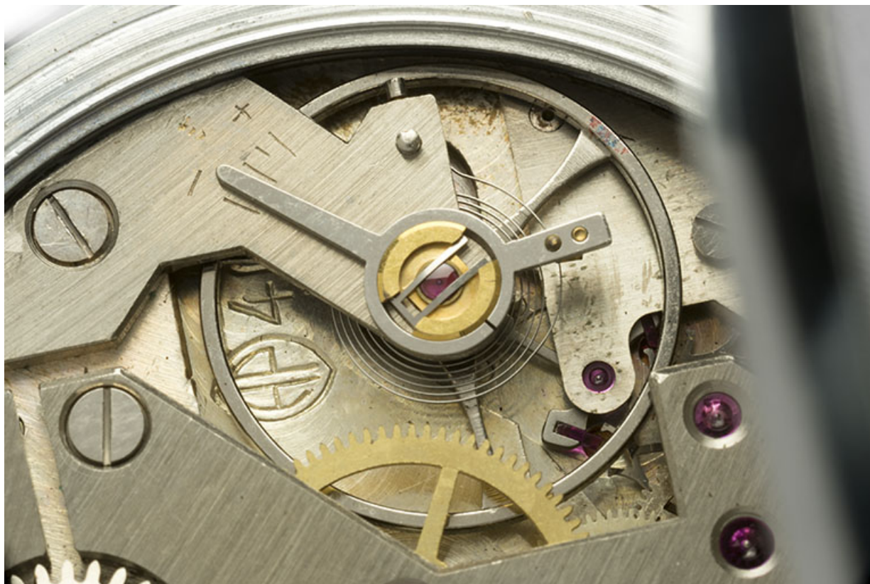
2e montre, mouvement Parrenin HP 40 : logotype et numéro de modèle gravés près du pont de balancier. 25, Villers-le-Lac