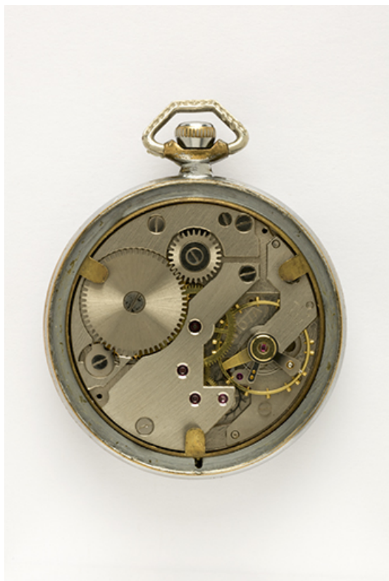
3e montre : mouvement Parrenin HP 40. 25, Villers-le-Lac