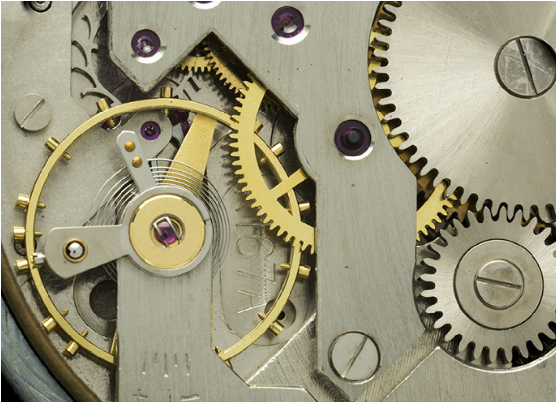
3e montre : détail du mouvement Parrenin HP 40. 25, Villers-le-Lac