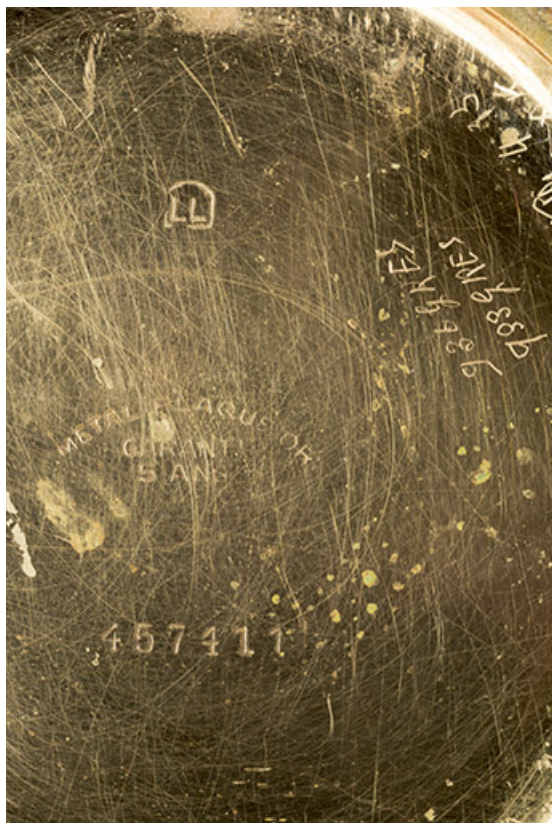
Inscriptions (manuscrites ou non) gravées dans le fond.