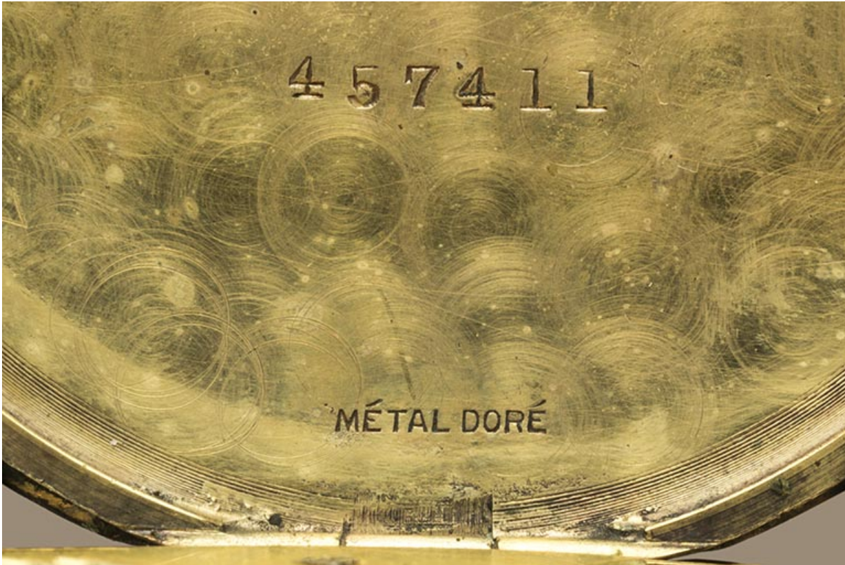
Inscriptions liées au boîtier, gravées dans la cuvette.