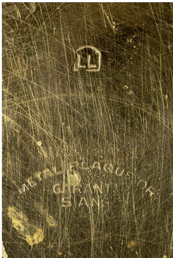
Inscriptions liées au boîtier, gravées dans le fond.