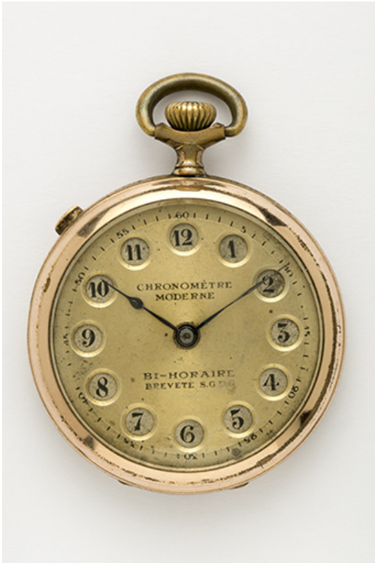
Face supérieure, avec affichage des heures de 1 à 12 (par défaut). 25, Villers-le-Lac