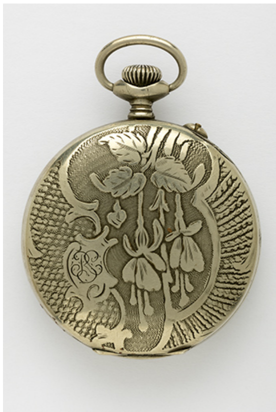
Face côté fond. 25, Villers-le-Lac