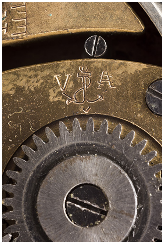
Logotype de la société Victor Anguenot. 25, Villers-le-Lac