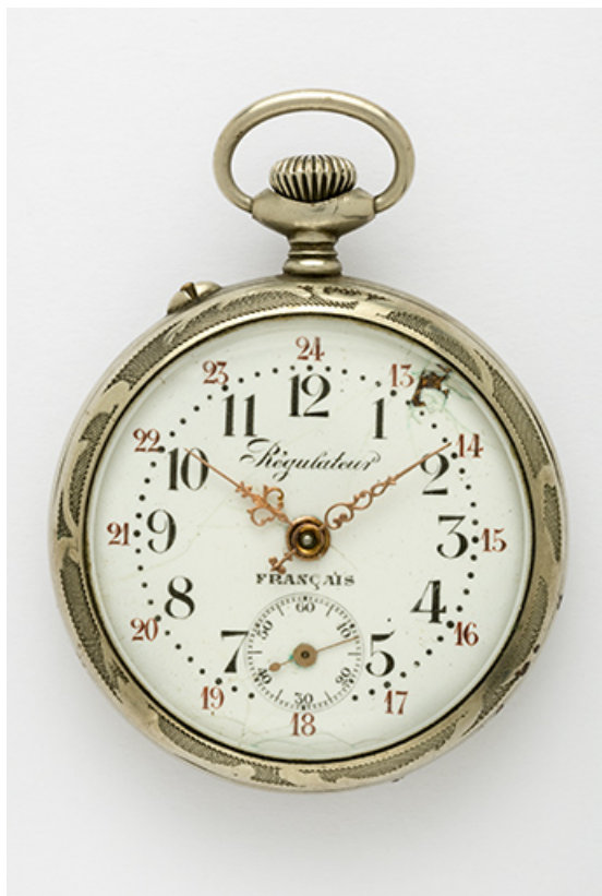
Montre de gousset mécanique de la marque Régulateur français (entre 1922 et 1928), de la société Victor Anguenot et Cie (au 7 rue du Lac et au 2 rue de la Perrière).