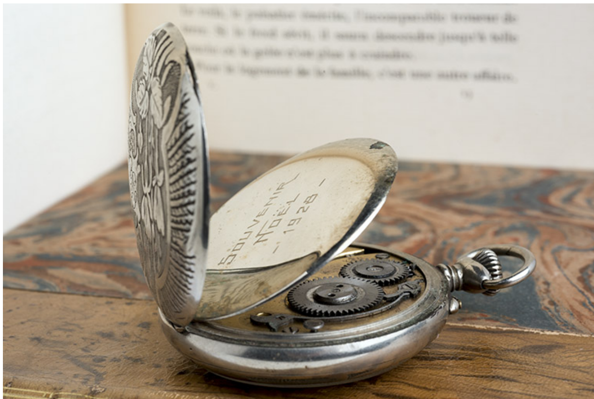
Montre de gousset mécanique de la marque Régulateur français, à Villers-le-Lac.