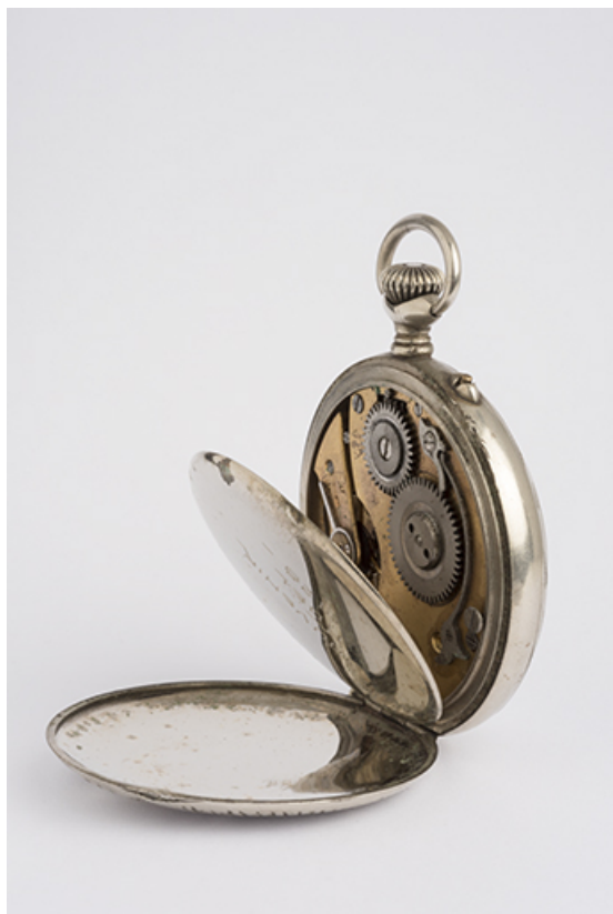
Vue de trois quarts, fond et cuvette ouverts. 25, Villers-le-Lac