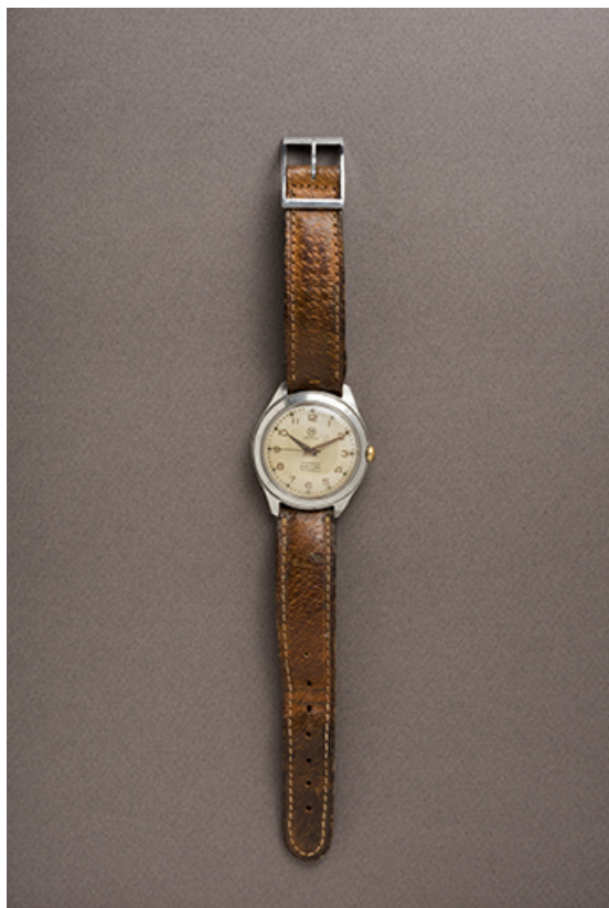
Montre-bracelet mécanique Manufrance. 25, Villers-le-Lac