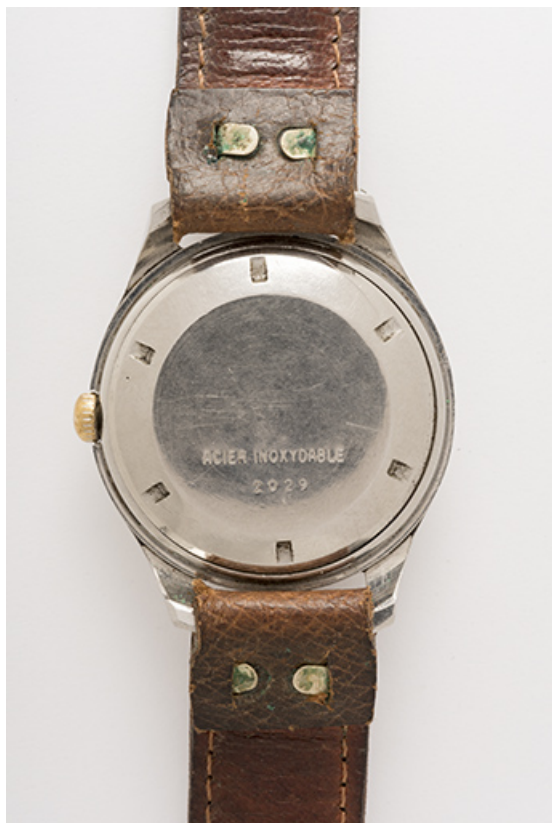
Face inférieure. 25, Villers-le-Lac