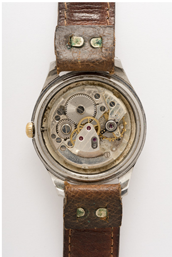
Montre-bracelet mécanique Manufrance : mouvement Parrenin HP 901. 25, Villers-le-Lac