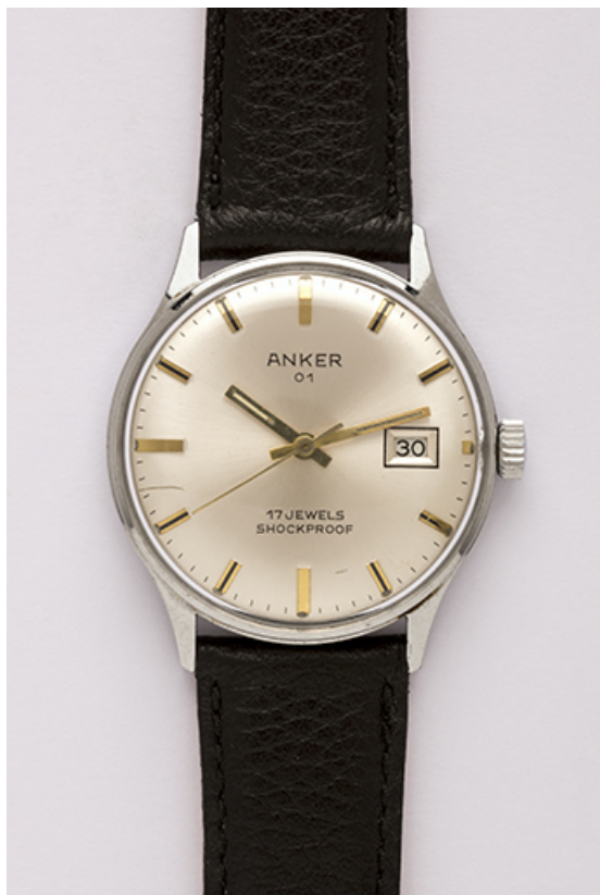
Montre-bracelet mécanique Anker 01 (années 1960-1970), par la société Uhrenfabrik Wilhelm Eppler GmbH, de Villingen-Schwenningen (Allemagne), équipée d'un calibre Parrenin HP 60 G. 25, Villers-le-Lac