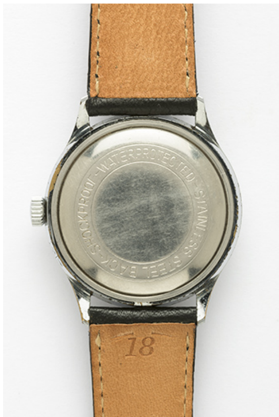
Face inférieure. 25, Villers-le-Lac