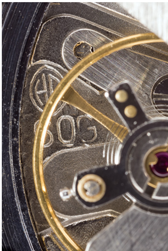
Logotype Parrenin et numéro de modèle. 25, Villers-le-Lac