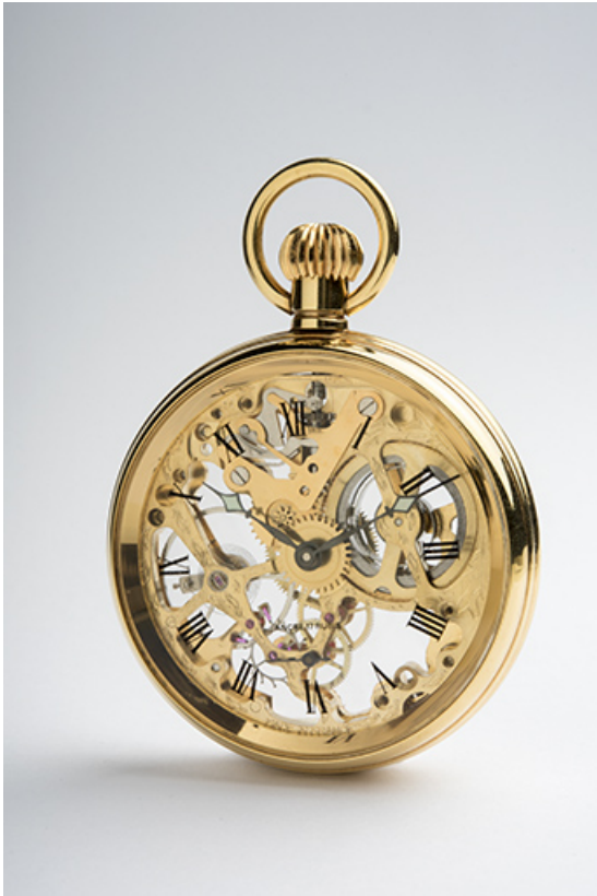
Montre-squelette de gousset mécanique Fabior-Watch (4e quart 20e siècle ou 1er quart 21e siècle), équipée d'un calibre Parrenin HP X 40.