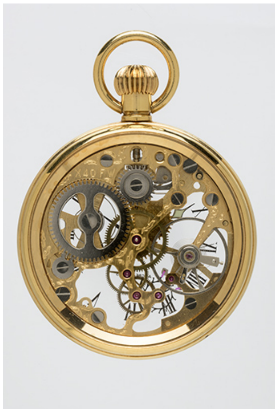
Montre Fabior-Watch utilisant un mouvement Parrenin HP X40 "squelettisé". 25, Villers-le-Lac