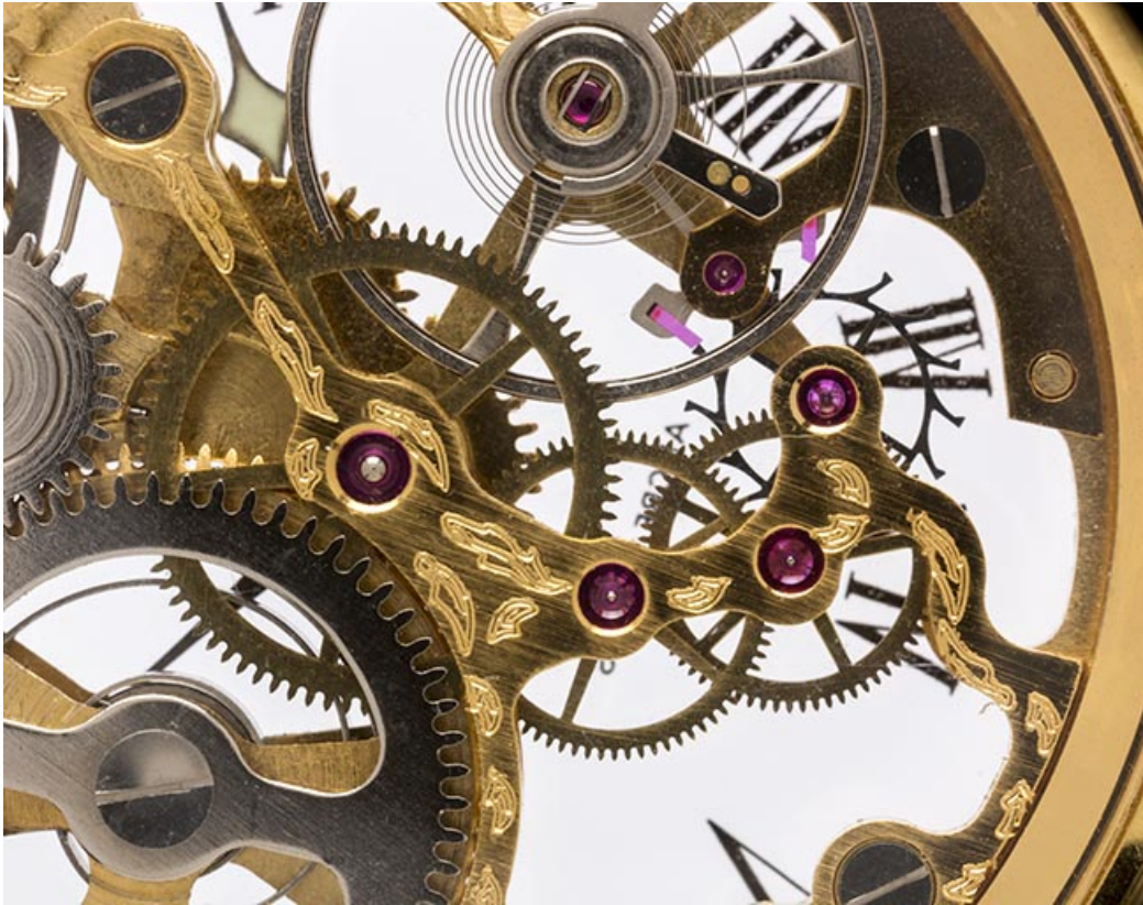
Montre de gousset mécanique (montre-squelette) Fabior-Watch, à Villers-le-Lac, décennies 1980-1990.