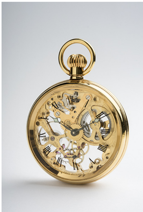
Montre-squelette de gousset mécanique Fabior-Watch (4e quart 20e siècle ou 1er quart 21e siècle), équipée d'un calibre Parrenin HP X 40.