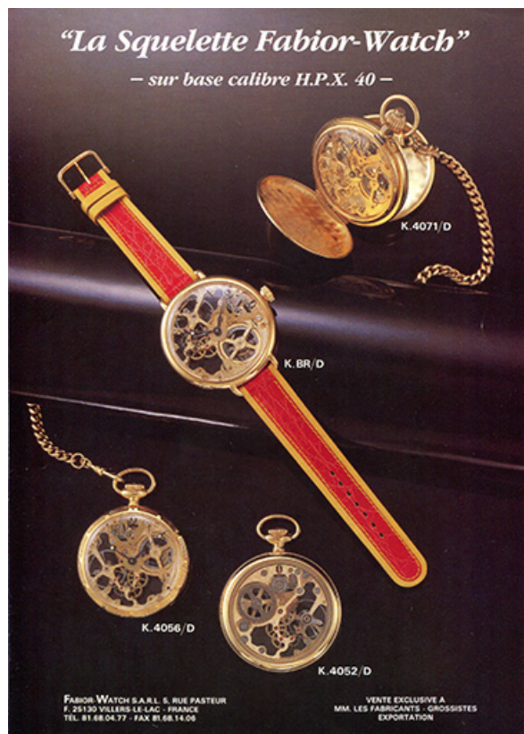
"La squelette Fabior-Watch" - sur base calibre H.P.X. 40 [publicité], [entre 1960 et 1975]. 25, Villers-le-Lac