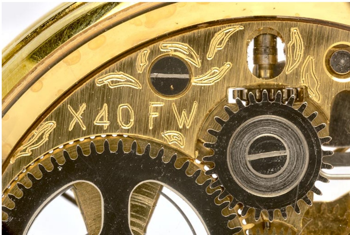
Face inférieure : numéro du calibre et initiales du fabricant. 25, Villers-le-Lac