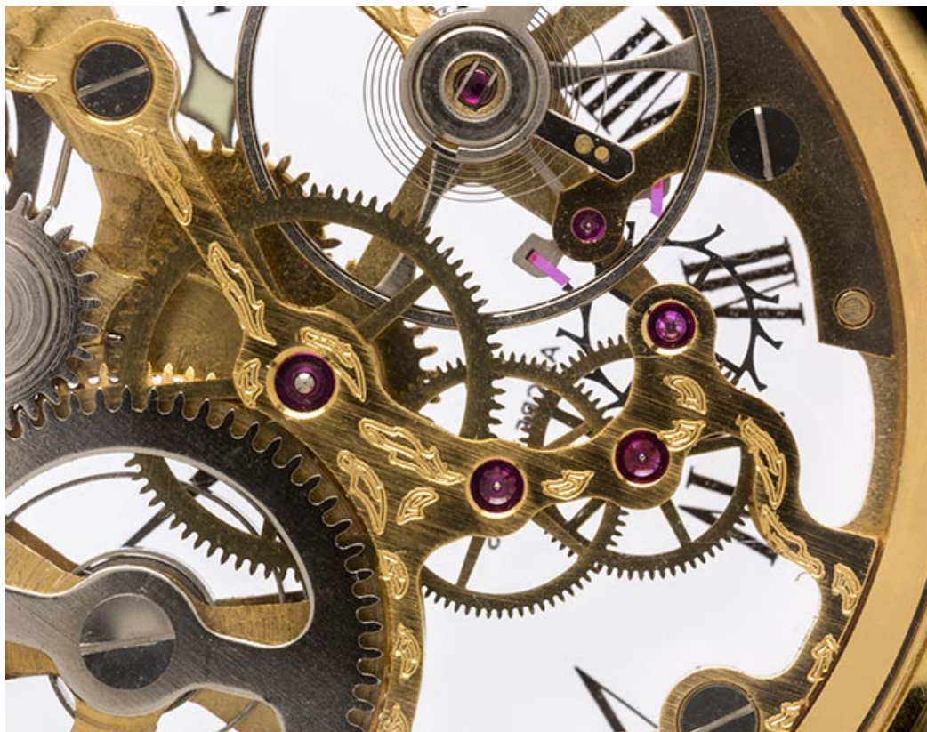
Montre de gousset mécanique (montre-squelette) Fabior-Watch, à Villers-le-Lac, décennies 1980-1990.