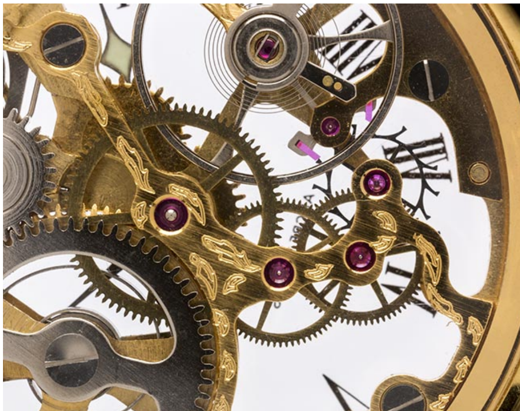
Montre de gousset mécanique (montre-squelette) Fabior-Watch, à Villers-le-Lac, décennies 1980-1990.