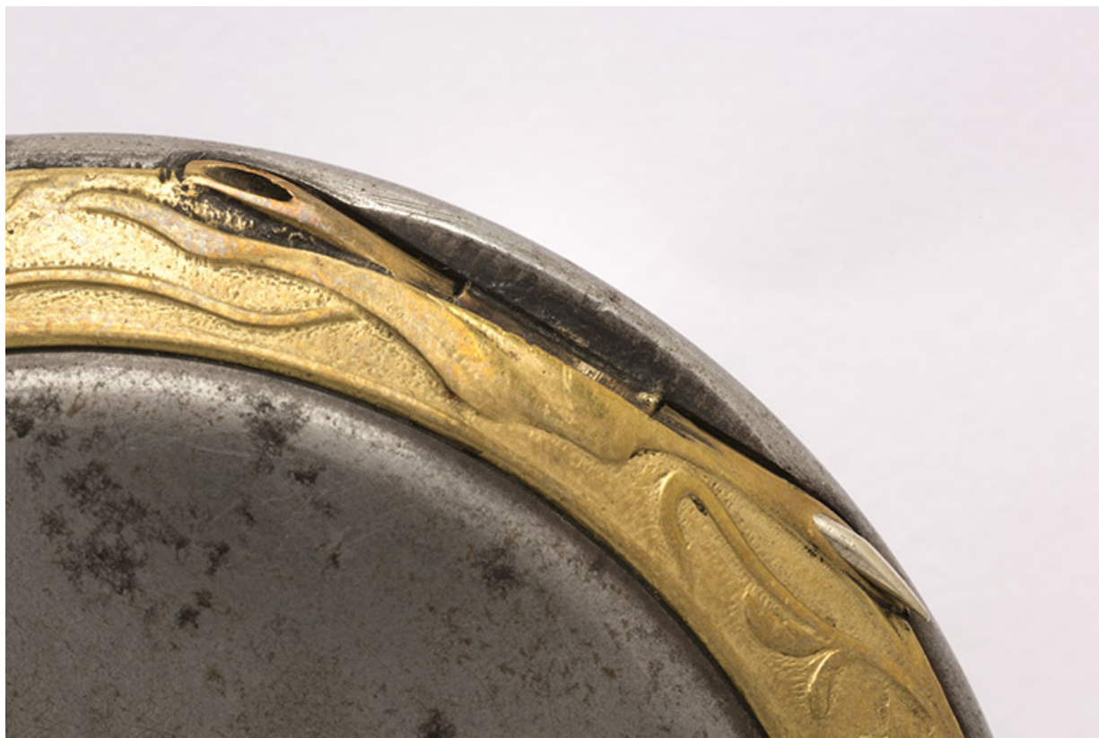
Face inférieure : décor Art nouveau et charnière du fond. 25, Villers-le-Lac