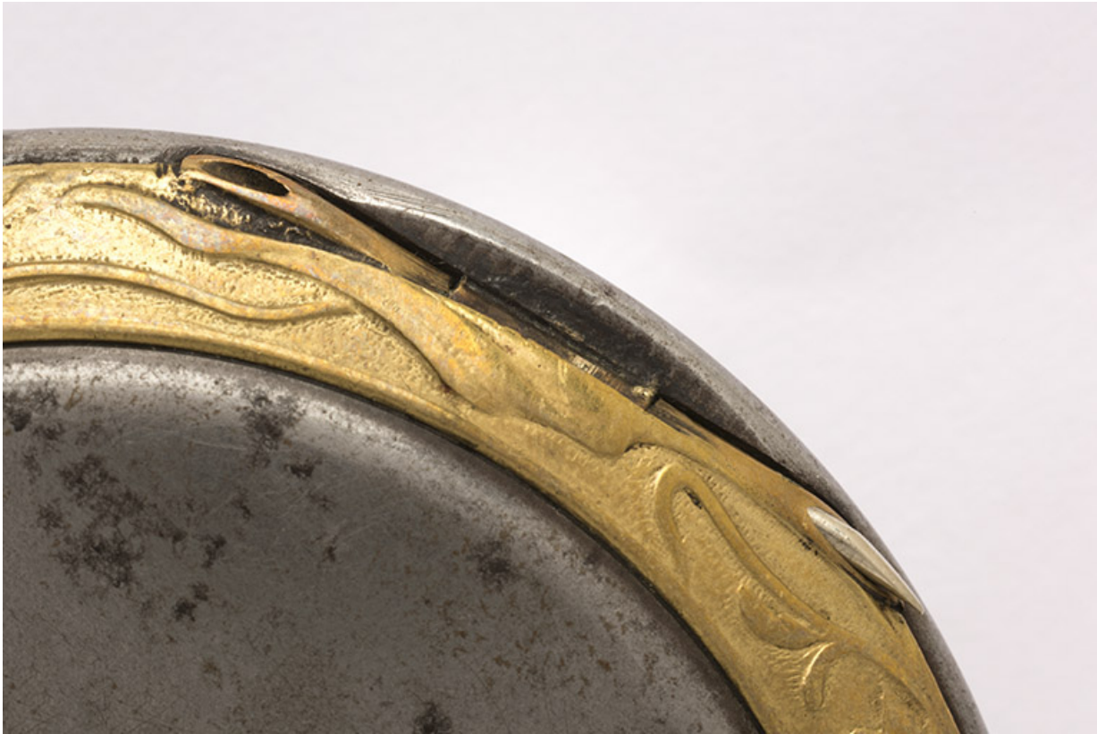
Face inférieure : décor Art nouveau et charnière du fond.