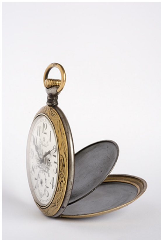
Vue de profil, fond et cuvette ouverts.