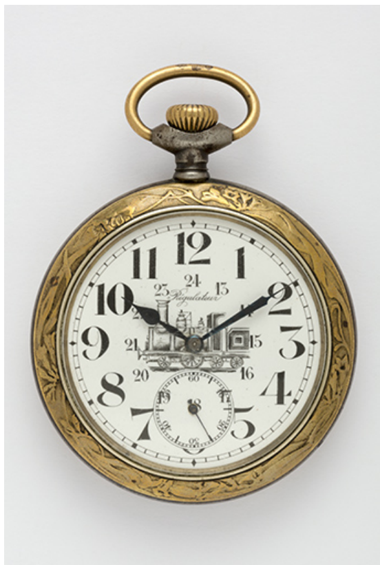
Montre de gousset mécanique dite régulateur de cheminot (calibre HP 24 lignes). 25, Villers-le-Lac