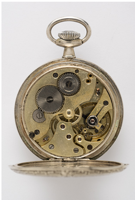
Montre de gousset mécanique des Ets Victor Mougin : mouvement Parrenin HP modèle T. (Collection particulière : Jean-Claude Vuez, Villers-le-Lac).