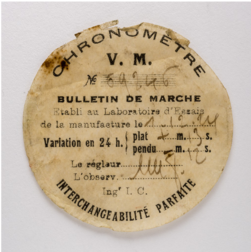
Bulletin de marche du 1er décembre 1924. 25, Villers-le-Lac