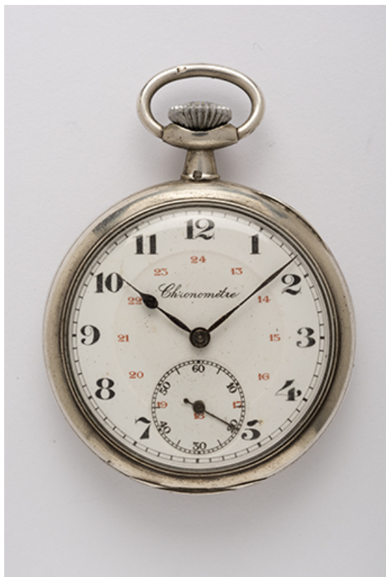
Montre de gousset mécanique des Ets Victor Mougin. (Collection particulière : Jean-Claude Vuez, Villers-le-Lac). 25, Villers-le-Lac