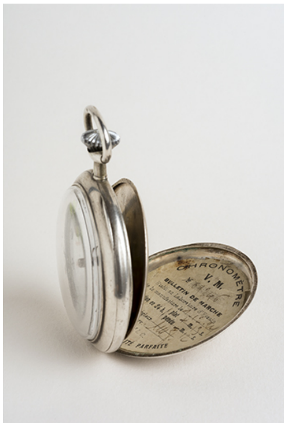
Vue de profil, fond et cuvette ouverts. Le bulletin de marche est visible dans le fond. 25, Villers-le-Lac