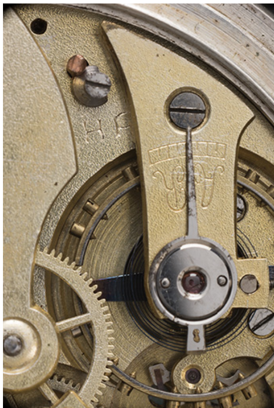
Mouvement : marque du fabricant (HP) et pont du balancier. 25, Villers-le-Lac

N° de l'illustration : 20162500348NUC4AQ