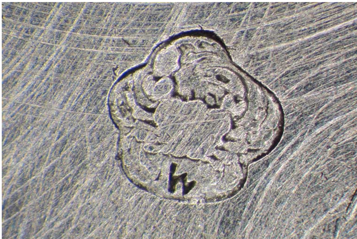
Poinçon au crabe avec le différent de Besançon entre les pattes, insculpé sur le fond. 25, Villers-le-Lac