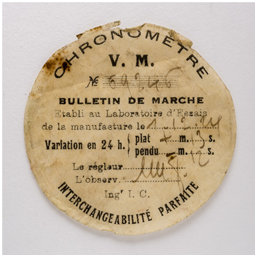
Bulletin de marche du 1er décembre 1924. 25, Villers-le-Lac