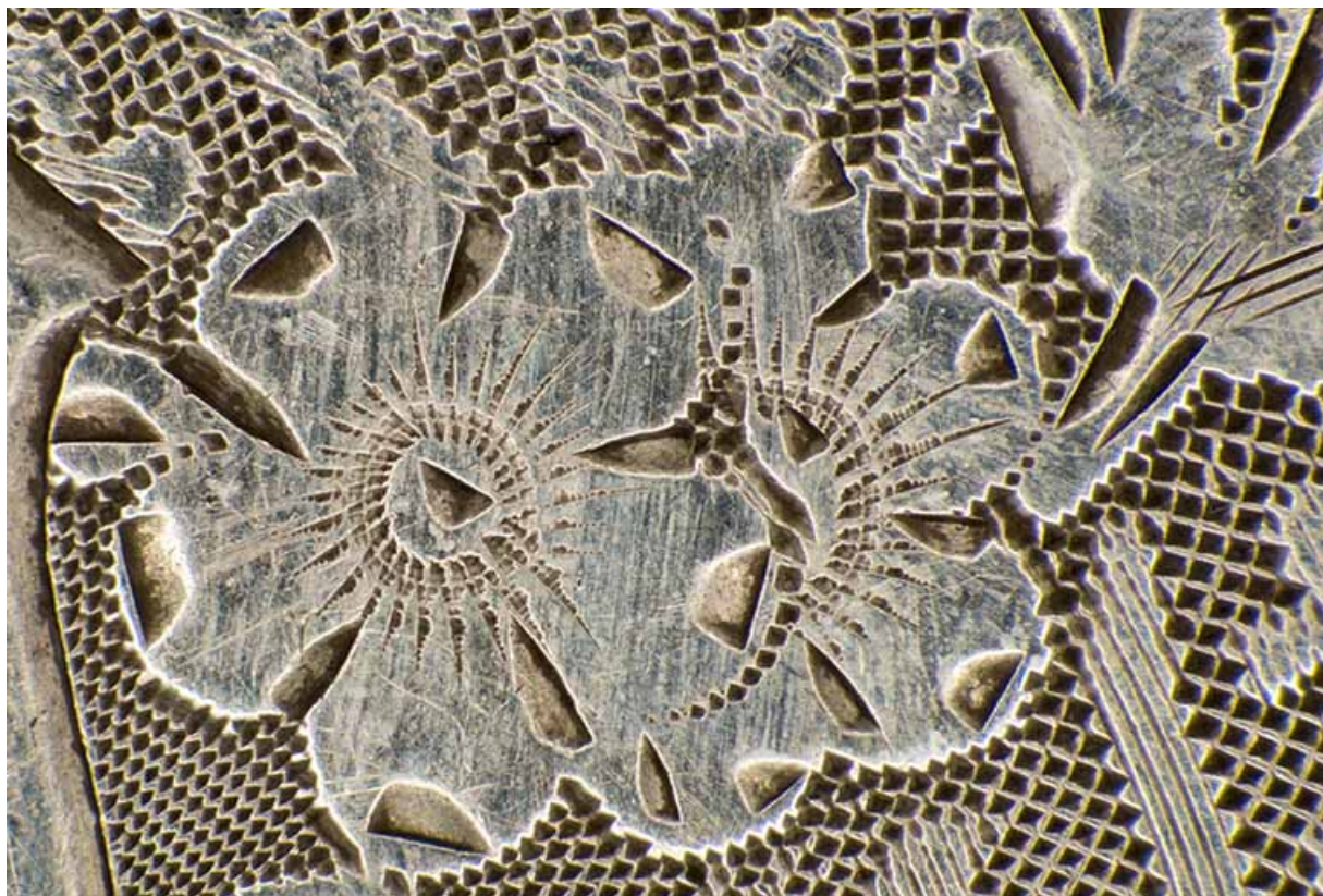
Face inférieure : détail de la gravure (fleur). 25, Villers-le-Lac