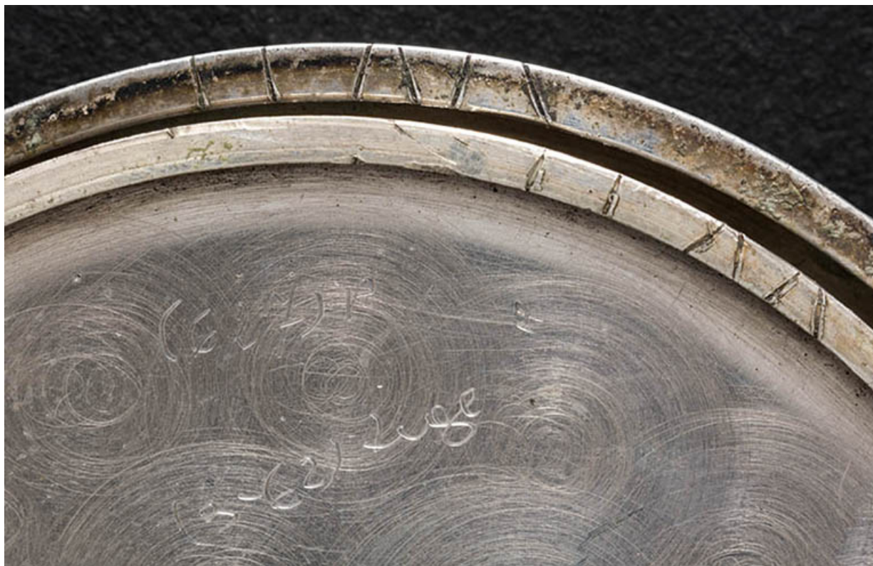
Inscriptions manuscrites à l'intérieur de la cuvette et marques d'appariement sur sa tranche et sur celle du fond. 25, Villers-le-Lac