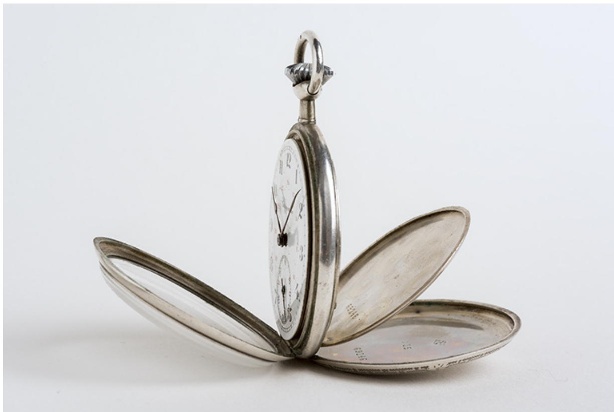
Vue de profil, lunette de glace, fond et cuvette ouverts.