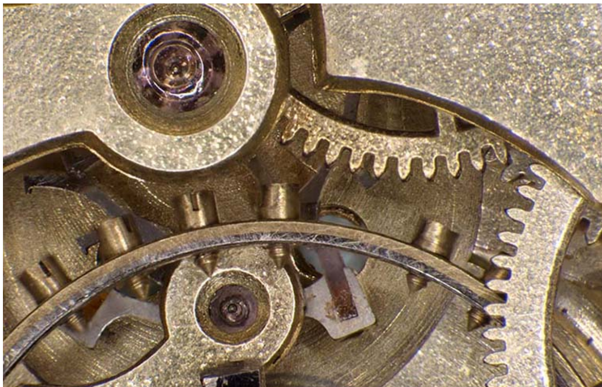
Mouvement, détails : contre-pivot en rubis, balancier à vis, ancre (avec ses palettes en rubis) et roue d'ancre. 25, Villers-le-Lac

N° de l'illustration : 20162500349NUC4AQ