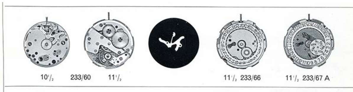
[Dessin des mouvements FE 233-60, 233-66 et 233-67A], 1973. 25, Maîche

[Dessin des mouvements FE 233-60, 233-66 et 233-67A], dessin imprimé, s.n., s.d. [1973]. Publié dans : Catalogue des fournitures des mouvements français de montres. 2e éd., 1973, fiche technique correspondante, p. 1.