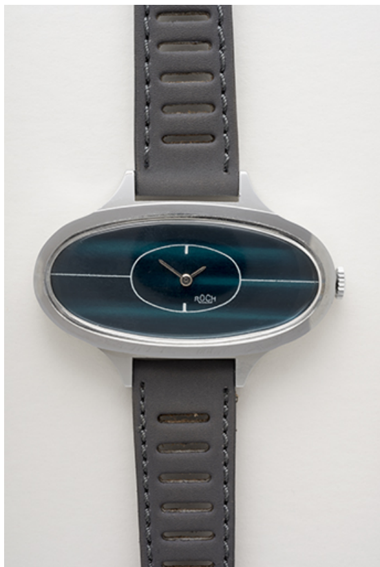
Montre-bracelet mécanique Roch.