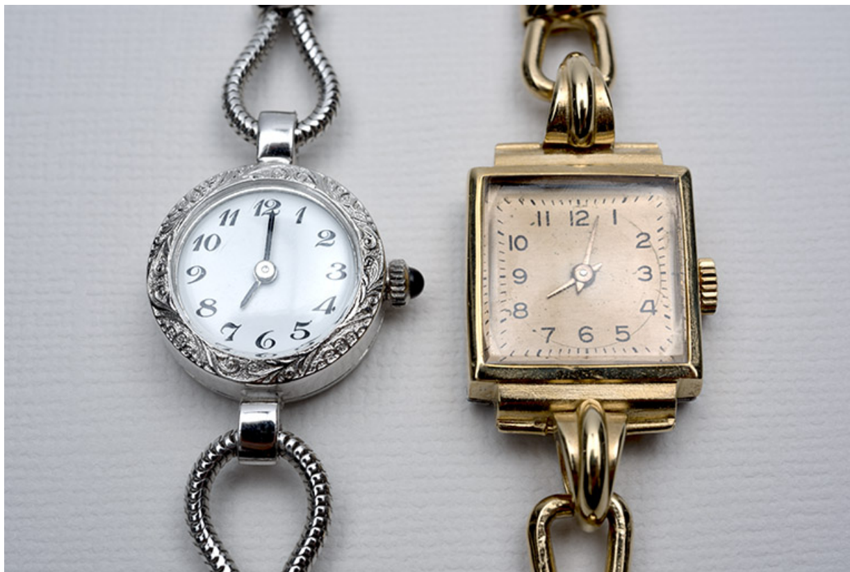
Face supérieure des deux montres, vue en plongée. 25, Maïche