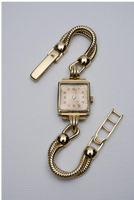
Montre plaquée or, à mouvement Cupillard 55. 25, Maïche