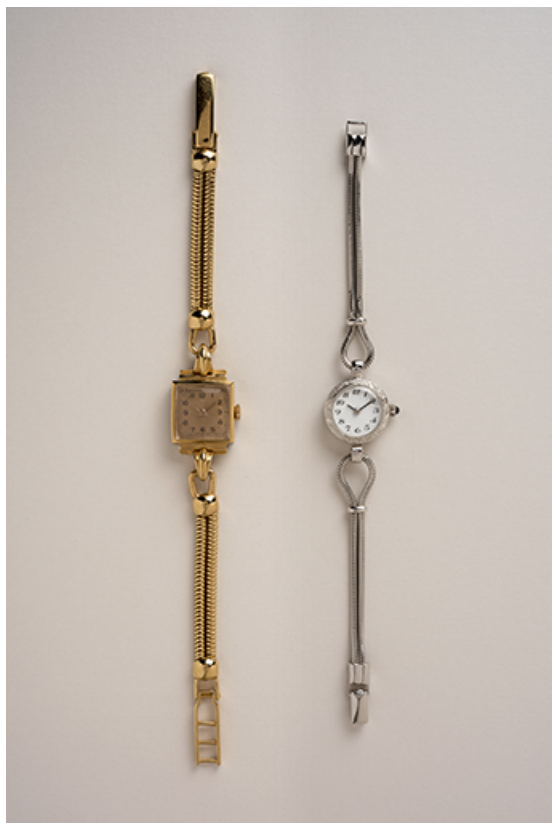
Vue d'ensemble des deux montres.