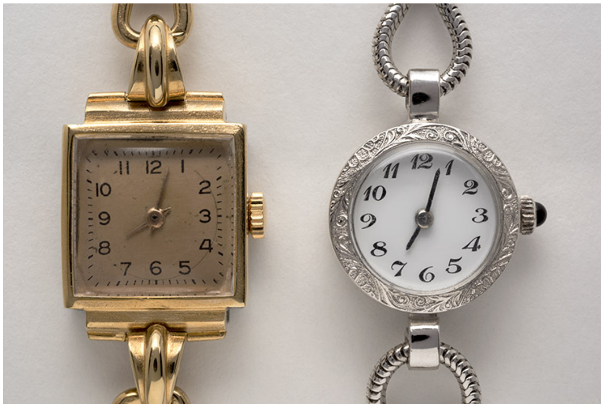
Face supérieure des deux montres. 25, Maîche