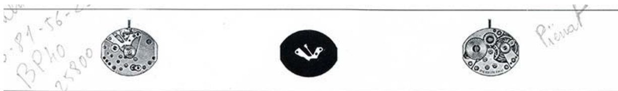
[Dessin du mouvement FE 68], 1973.