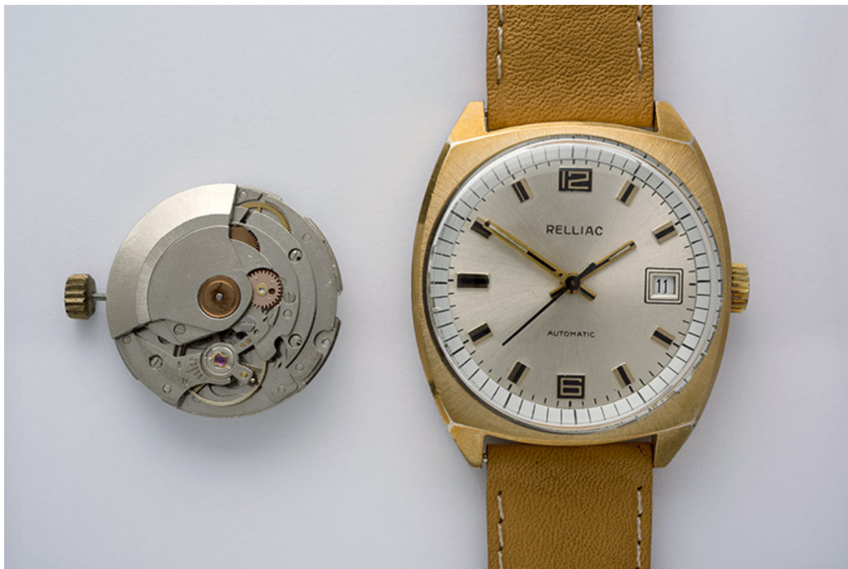
Montre-bracelet automatique Relliac (à côté d'un mouvement France Ebauches FE 4611), à Maïche, vers 1980.