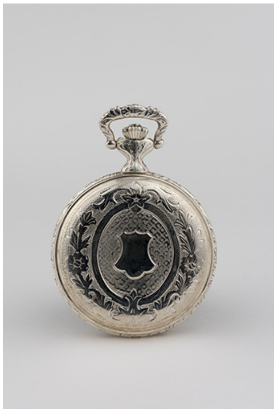
La boîte, vue côté fond. 25, Maïche