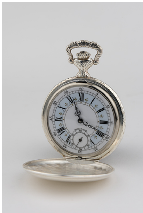
Montre de gousset mécanique Codhor. 25, Maïche