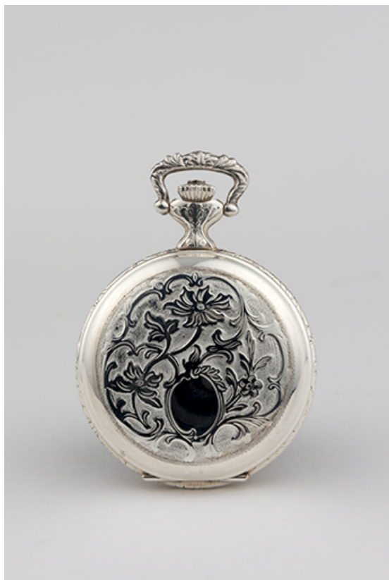
La boîte, vue côté cadran.