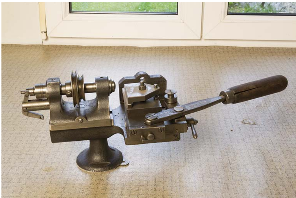
L'atelier (1912) d'un petit fabricant de machines pour les horlogers : Adelin Berçot puis Maurice Roch, au 13 rue Sous Monjoie. Machine à tamponner (insérer les tampons dans l'écorce du cylindre) des années 1910. 25, Maïche