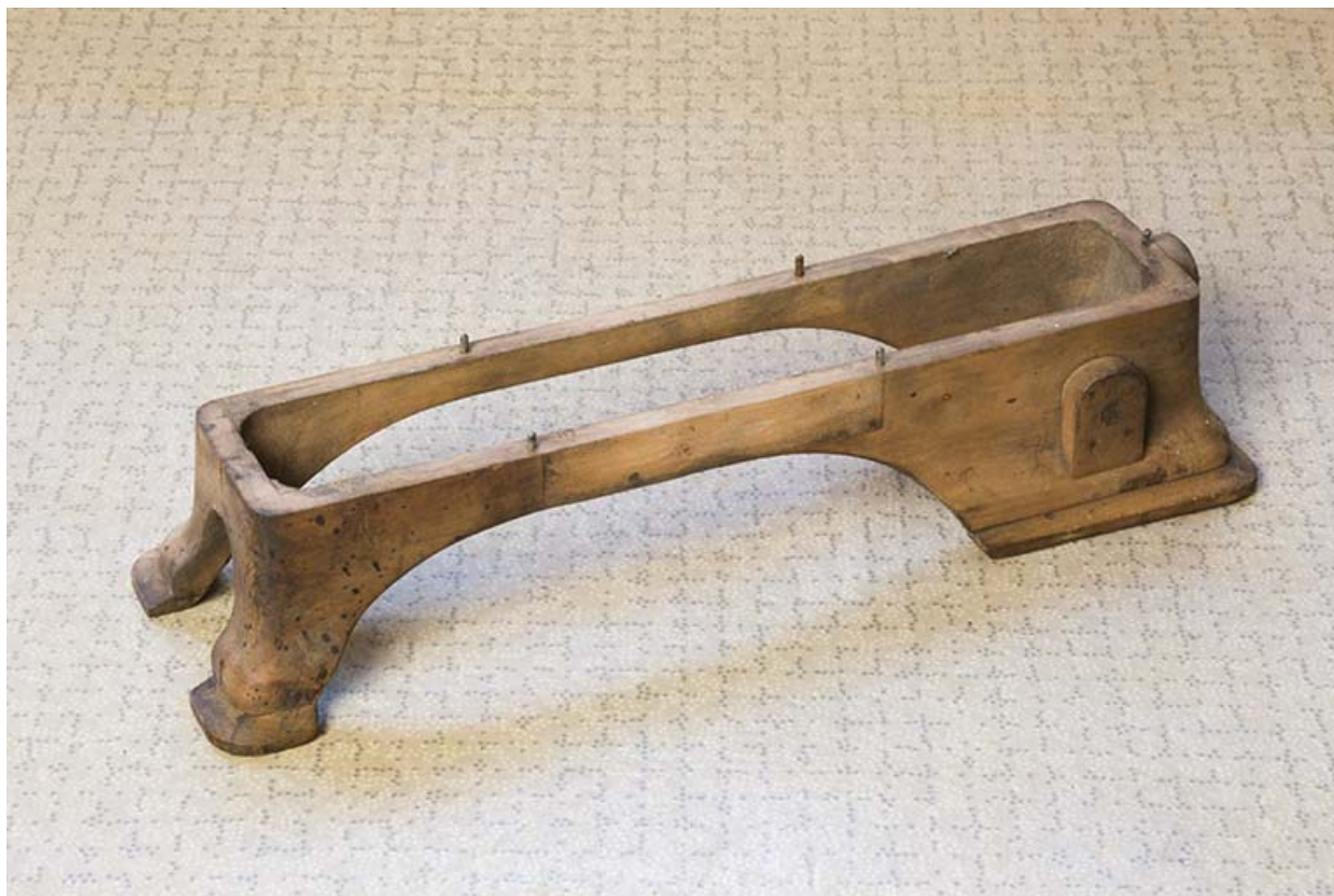
Modèle de socle de machine à décoller, table enlevée.