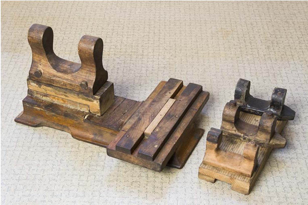
Modèle de machine à pivoter.