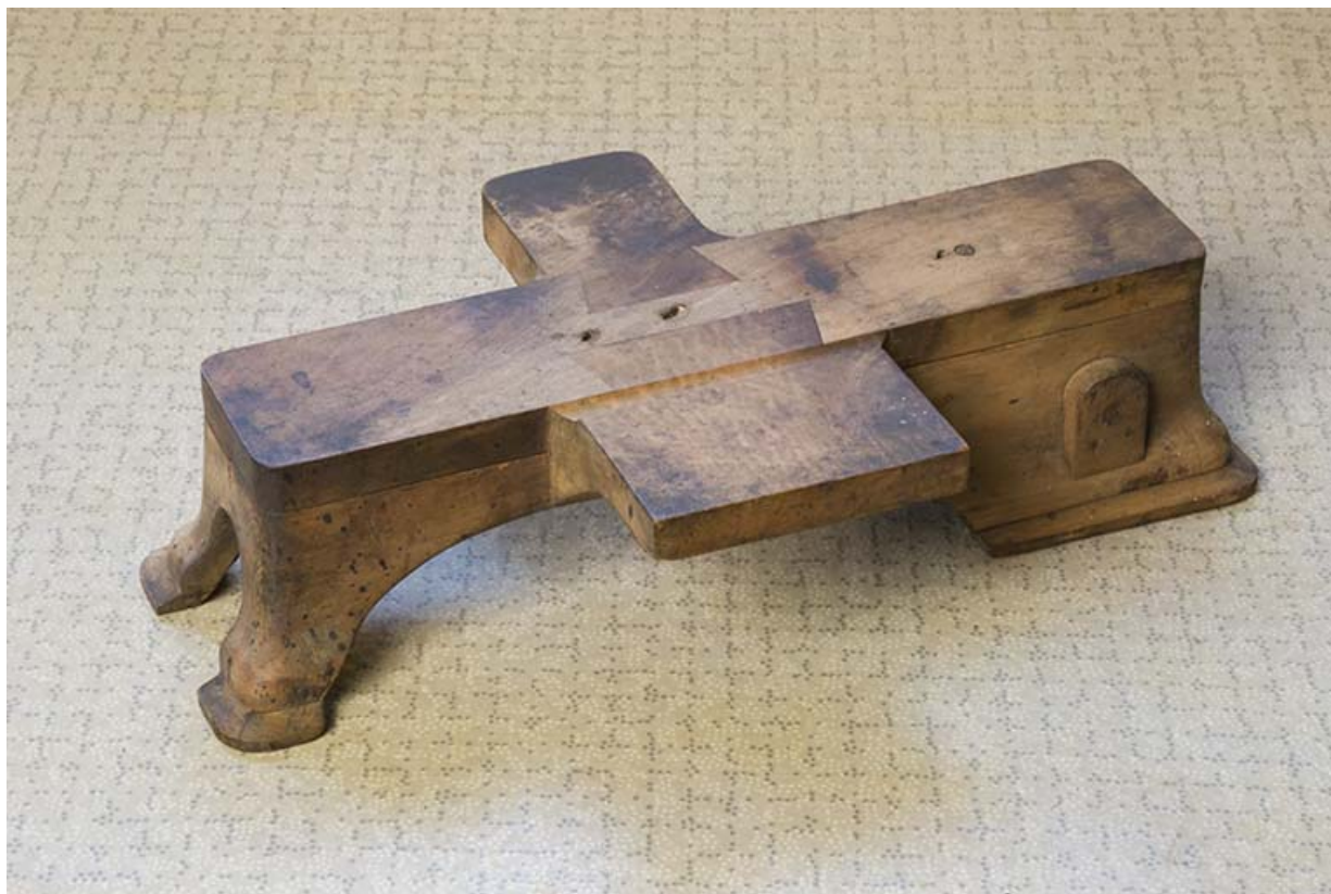
Modèle de socle de machine à décoller.