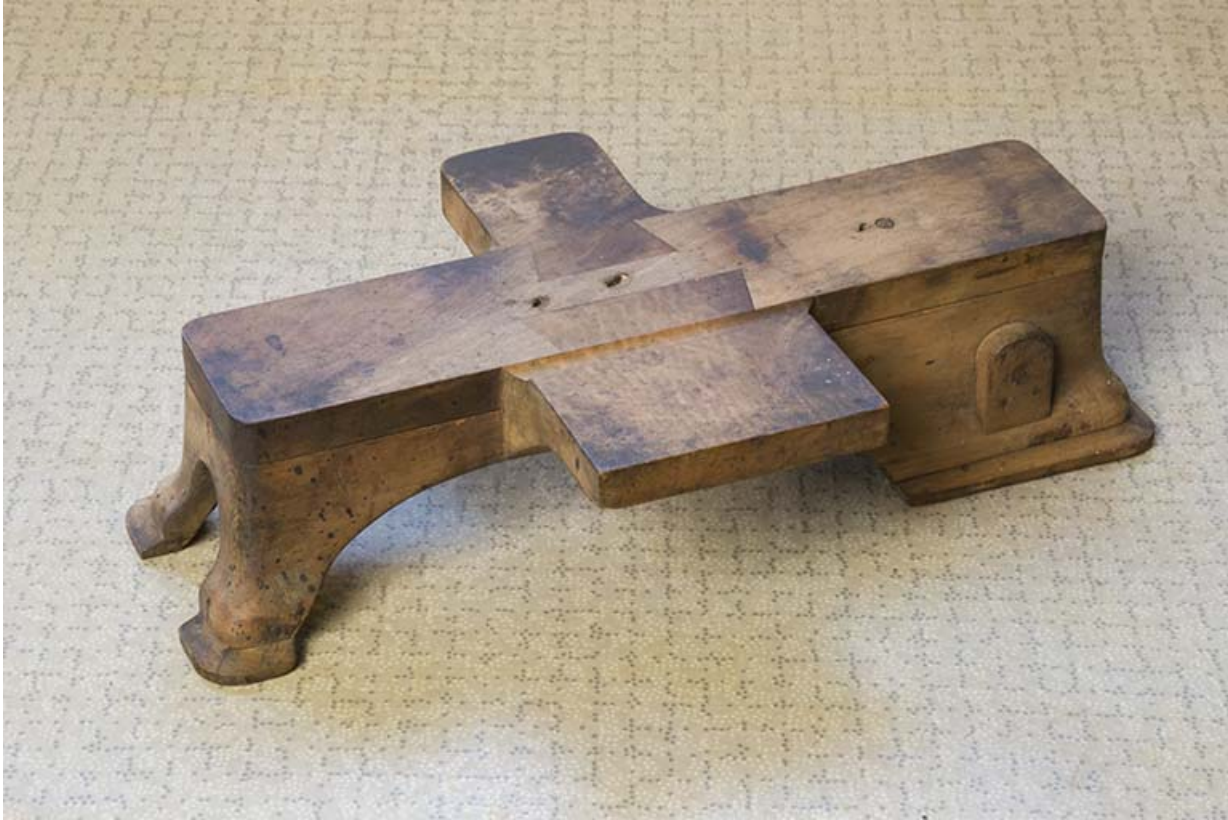
Modèle de socle de machine à décoller.