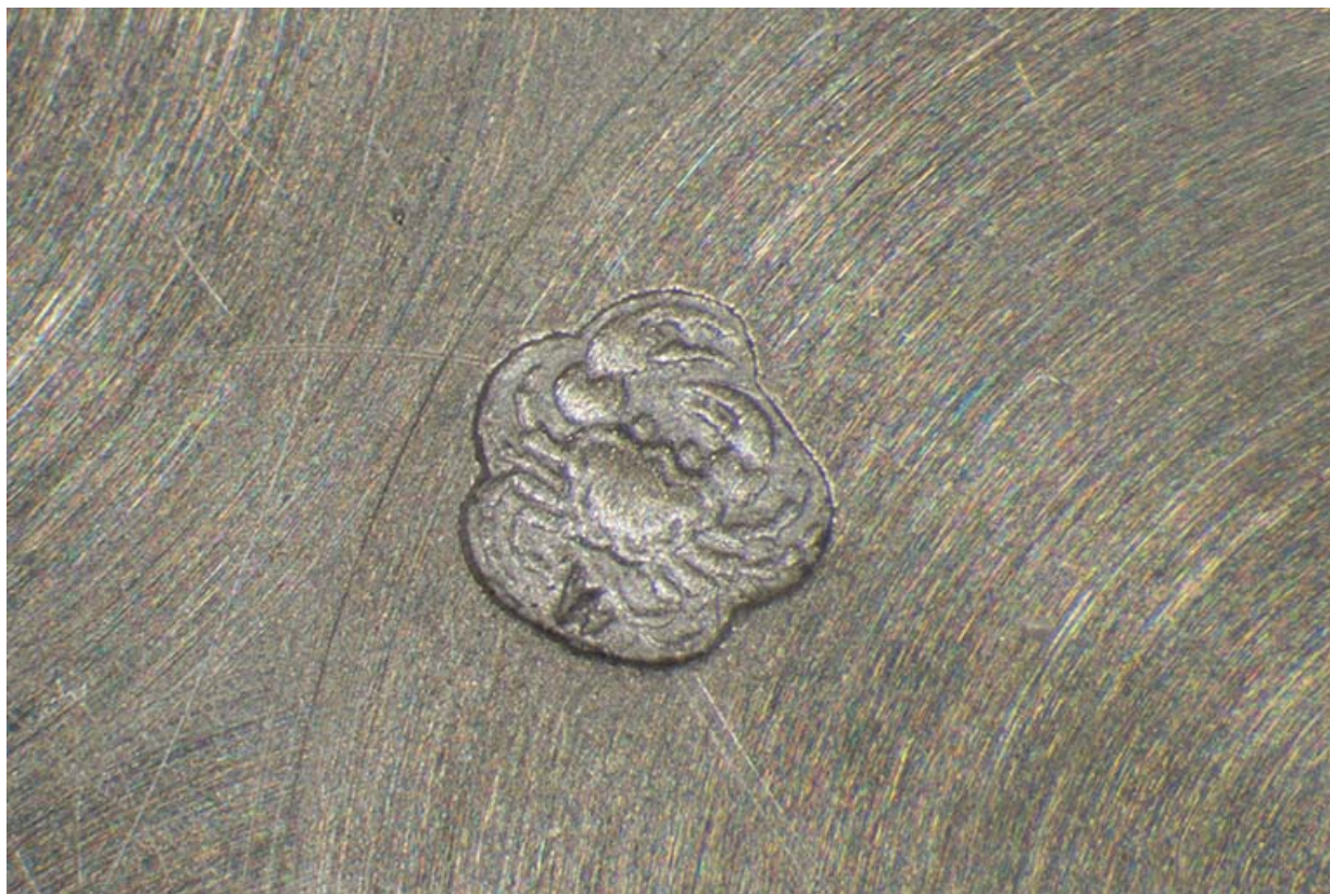
Poinçon de garantie insculpé sur un fond de boîte : un crabe (garantie menus ouvrages 2e titre départements depuis 1838), avec le différent de Besançon entre les pattes inférieures.