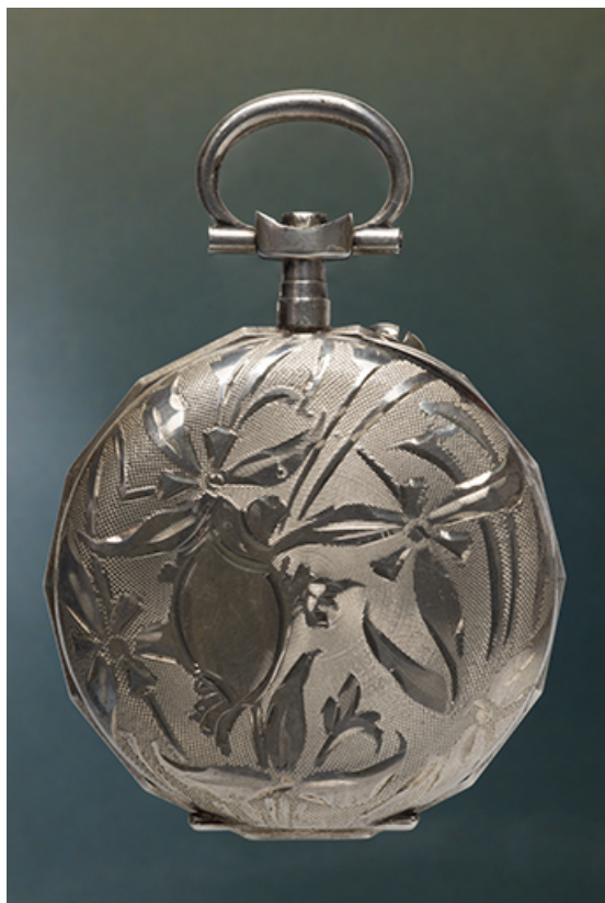
Boîte de la société Lévy Frères : vue de face côté fond. 25, Charquemont, 12 Rue Neuve