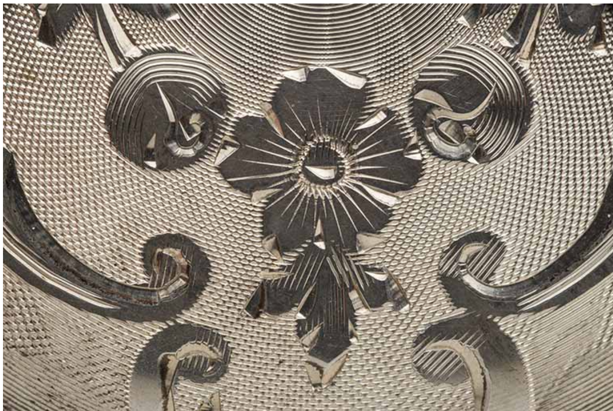
Détail de la gravure d'un fond de boîte : motif végétal.