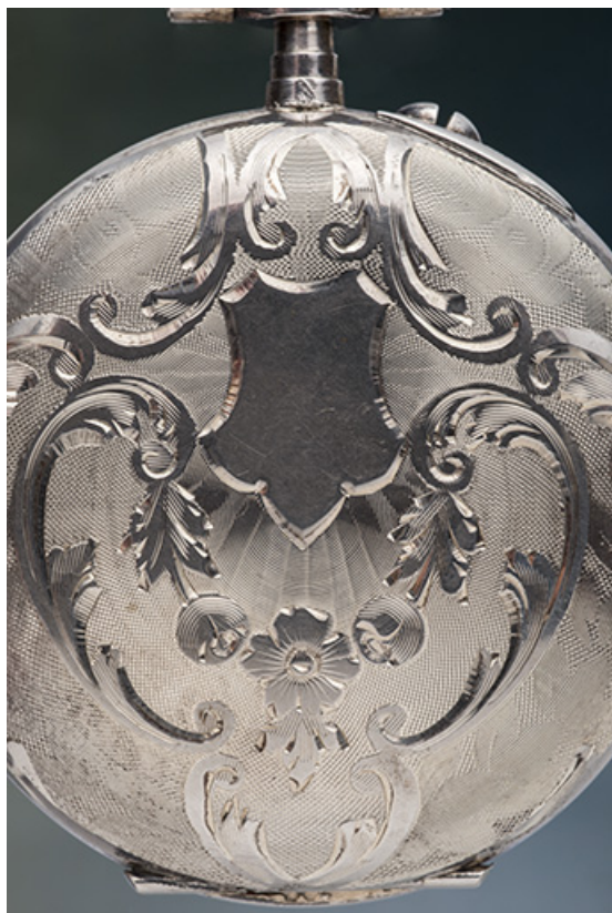
Décor d'un fond de boîte. L'écusson permet de graver les initiales du propriétaire de la montre.