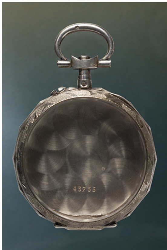
Boîte de la société Lévy Frères : vue de face côté verre. 25, Charquemont, 12 Rue Neuve