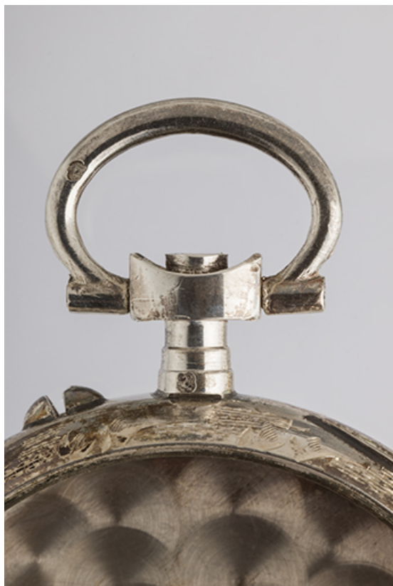
Poinçon de garantie insculpé sur la bélière et sur la tête du pendent 25, Charquemont, 12 Rue Neuve