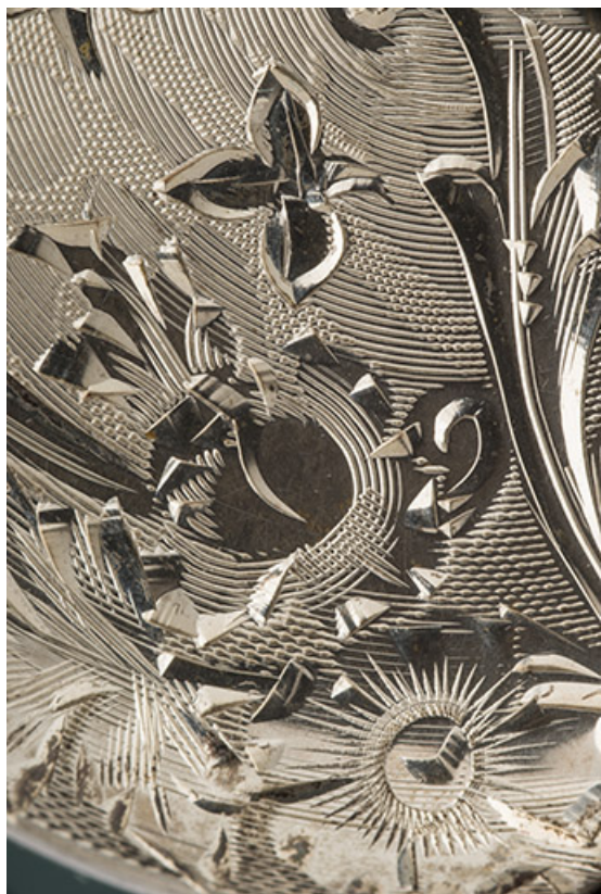
Détail de la gravure d'un fond de boîte.