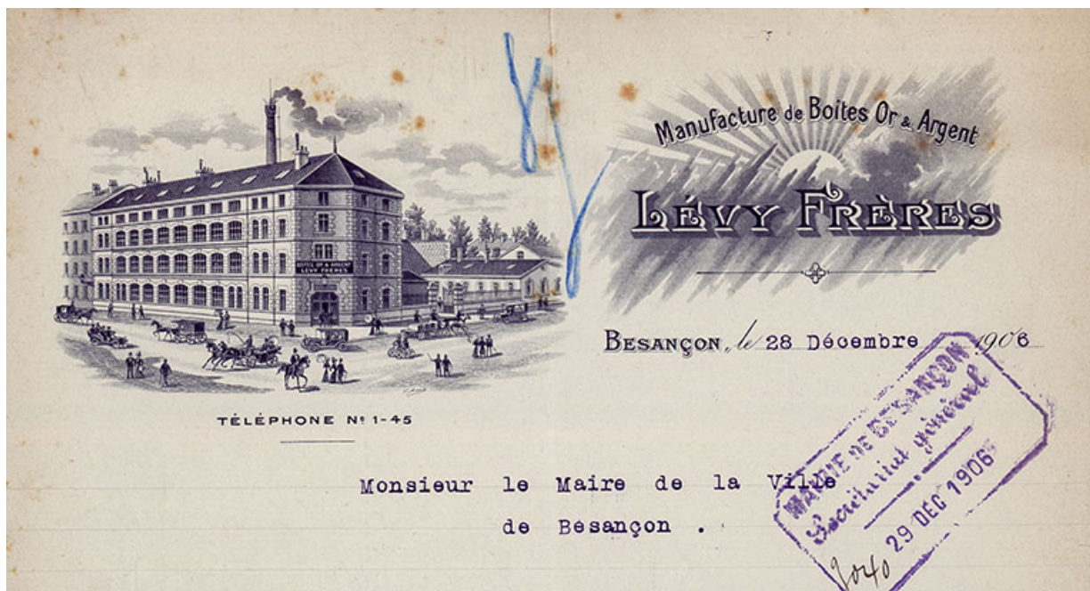
Manufacture de boîtes de montres Lévy Frères (25 rue Gambetta), Papier à en-tête, 1906. 25, Charquemont, 12 Rue Neuve