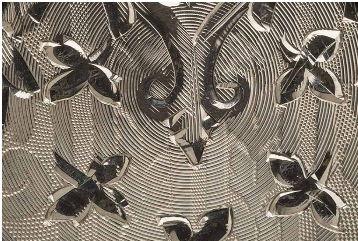
Détail de la gravure d'un fond de boîte.