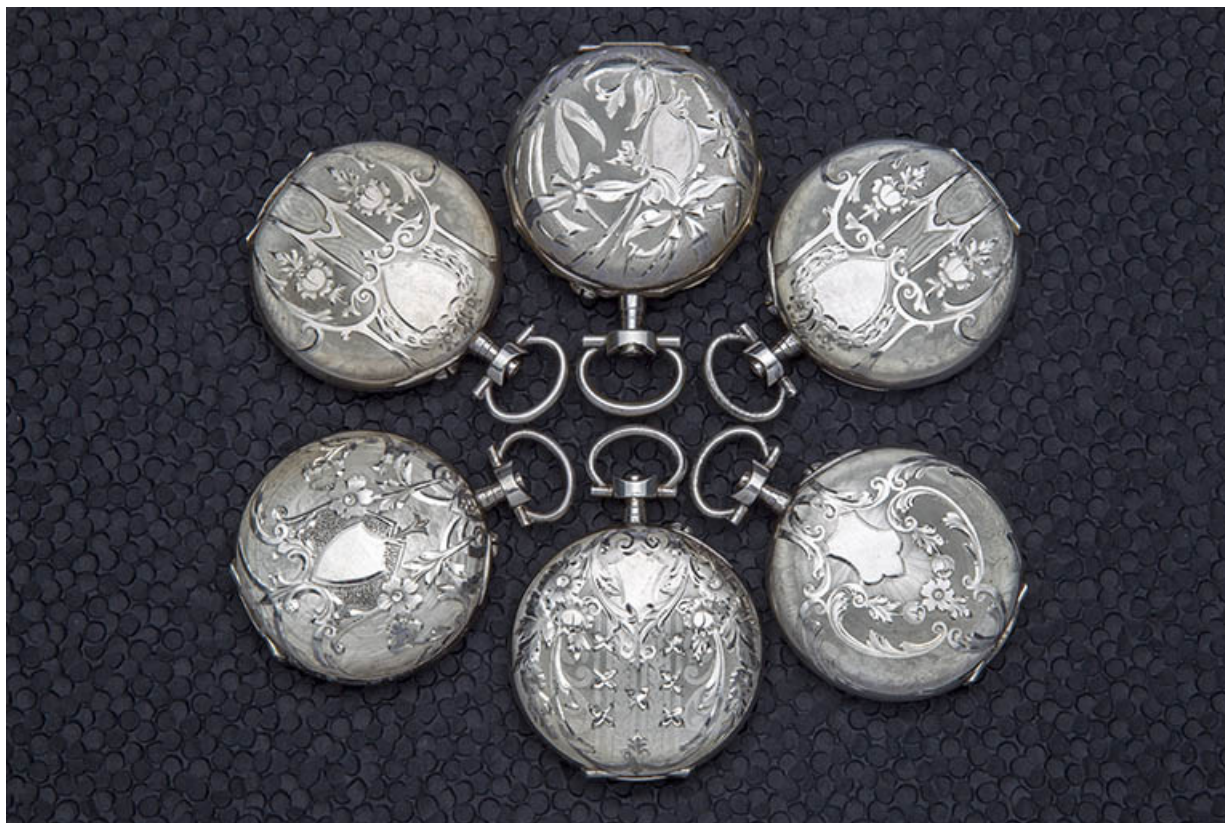
Vue d'ensemble des boîtes.