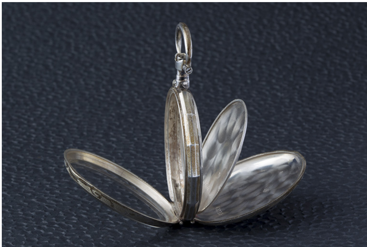
Boîte de la société Lévy Frères : vue de profil.