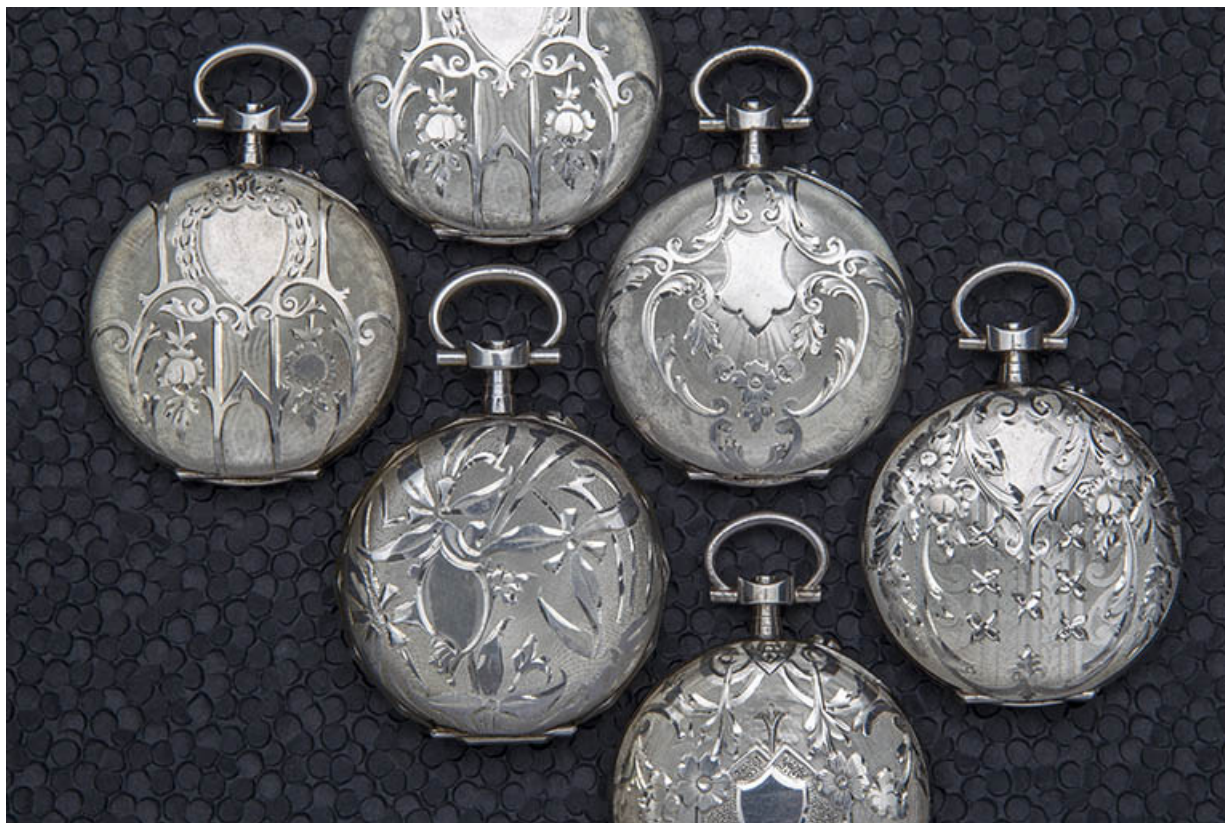
Ensemble de six boîtes de montre de gousset en argent.