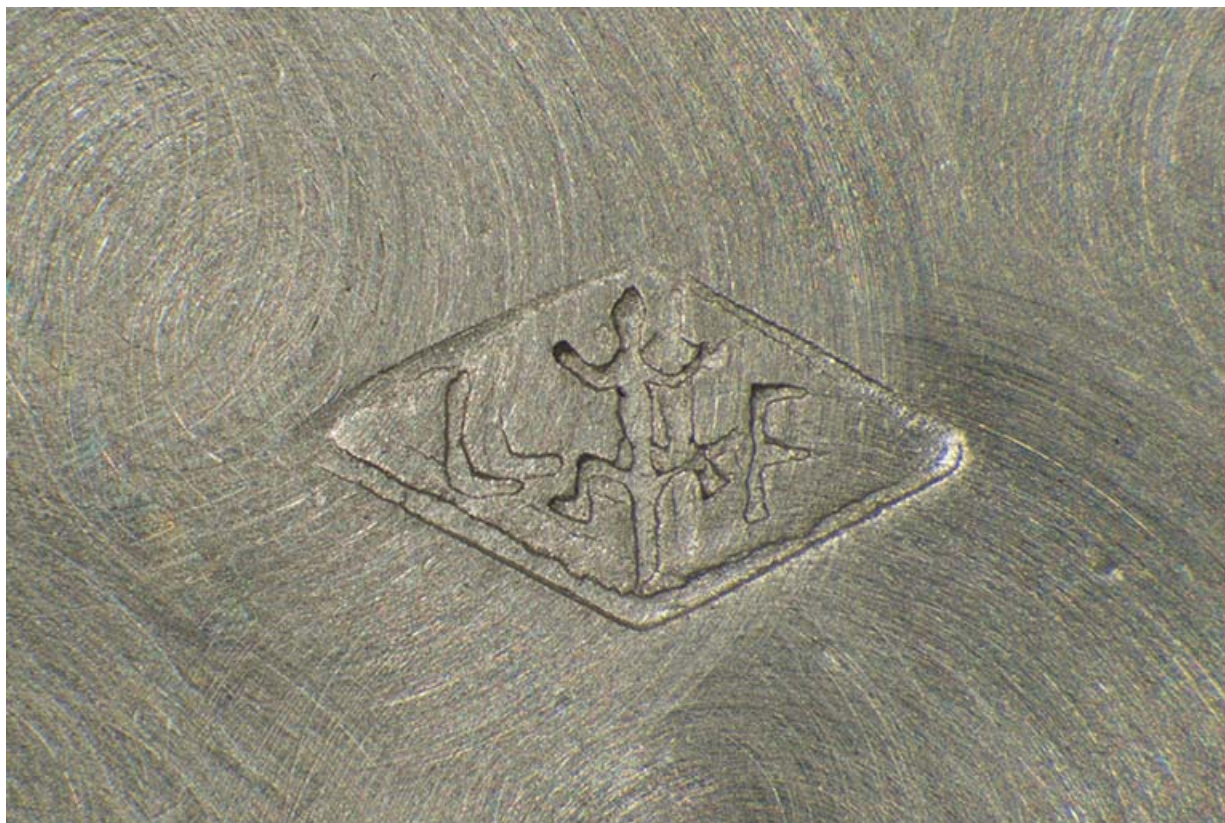
Poinçon de maître de la société Lévy Frères : un lézard entre les lettres L et F. 25, Charquemont, 12 Rue Neuve