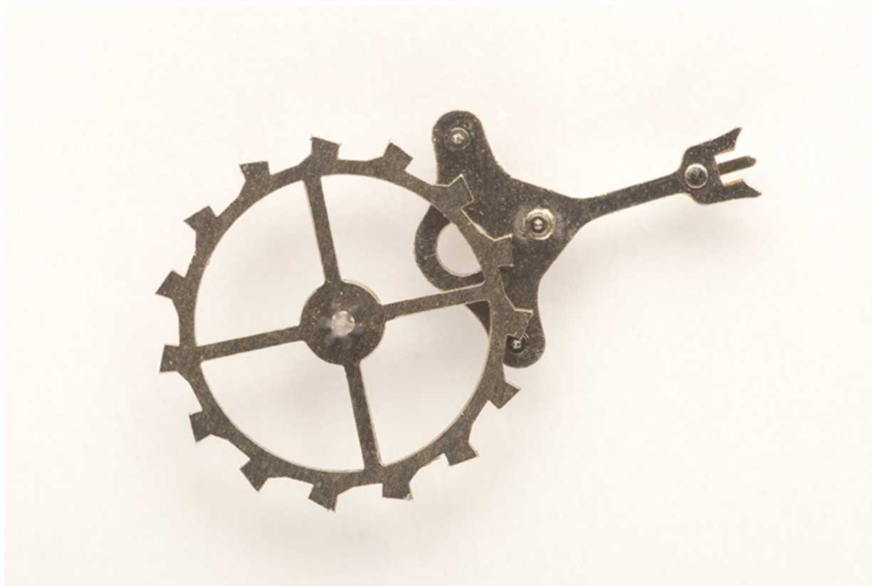
Echappement à chevilles.