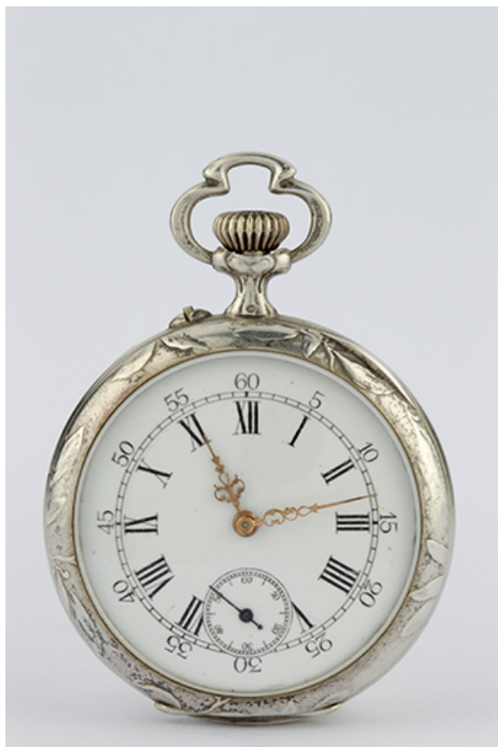
Vue d'ensemble, côté cadran.