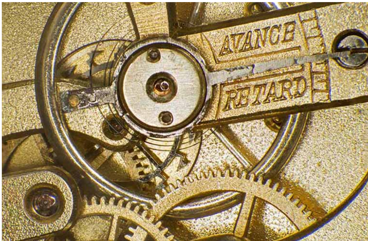
Mécanisme de réglage de la marche diurne : raquette sur le pont de balancier. 25, Charquemont, 12 Rue Neuve

N° de l'illustration : 20142501702NUC4AQ