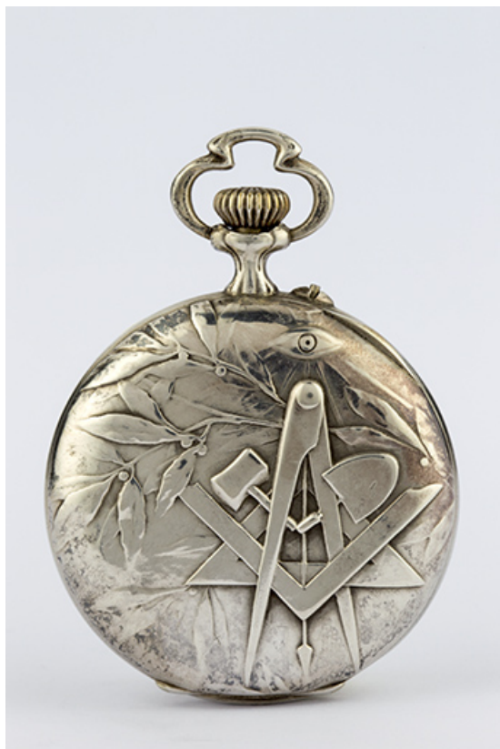
Montre de gousset mécanique (montre de franc-maçon), à Charquemont.