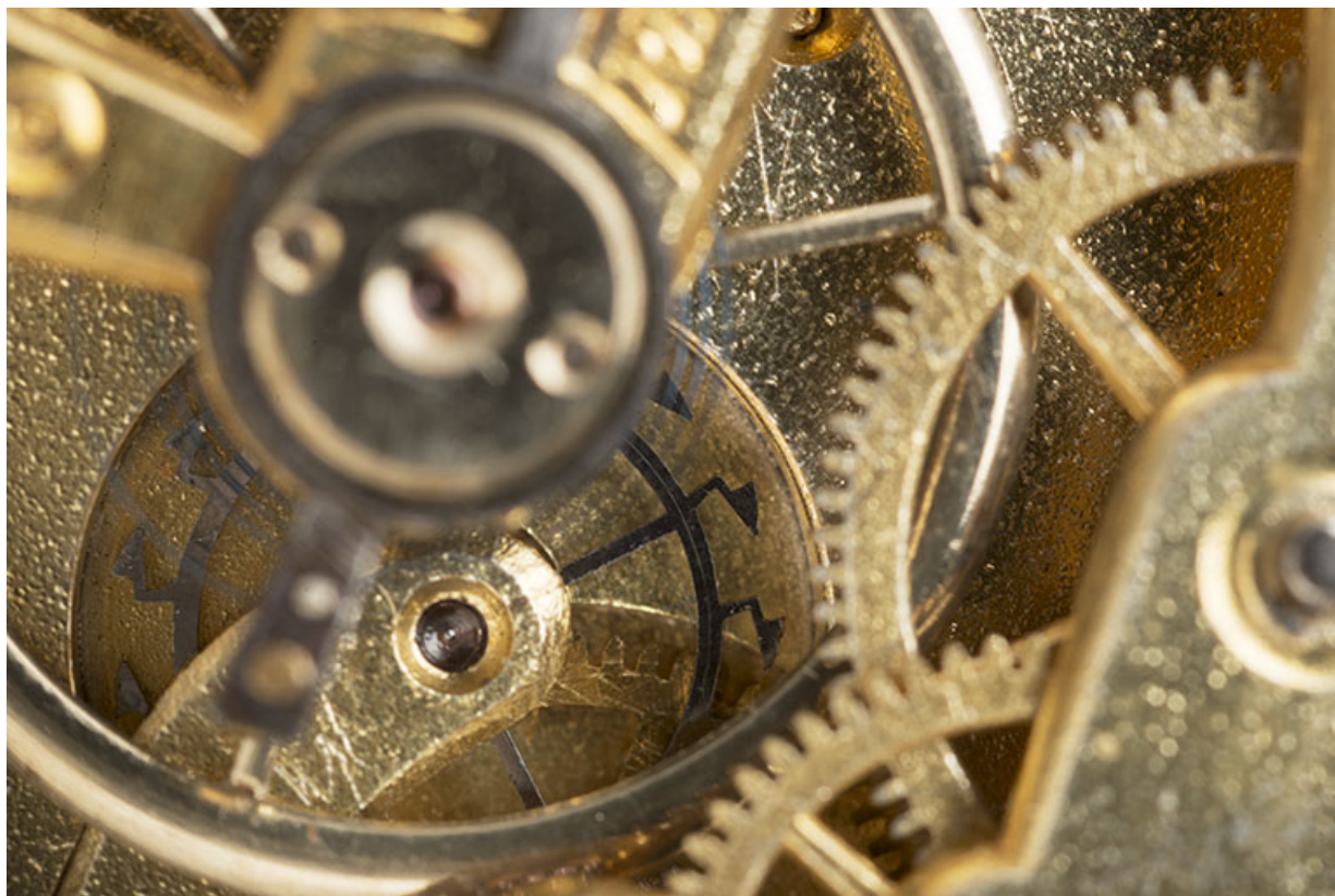
Détail du rouage : la roue de cylindre plate (sombre) est visible à l'arrière du balancier.