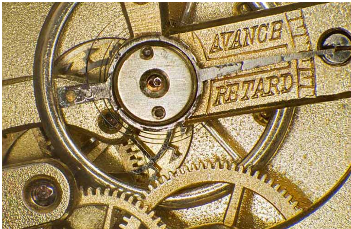
Mécanisme de réglage de la marche diurne : raquette sur le pont de balancier. 25, Charquemont, 12 Rue Neuve

N° de l'illustration : 20142501702NUC4AQ