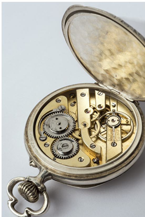
Vue d'ensemble, fond ouvert.