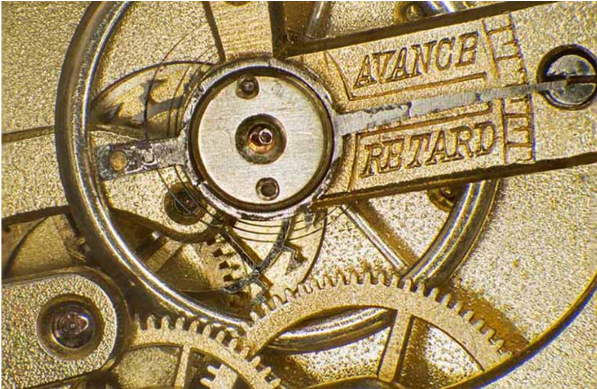
Mécanisme de réglage de la marche diurne : raquette sur le pont de balancier.